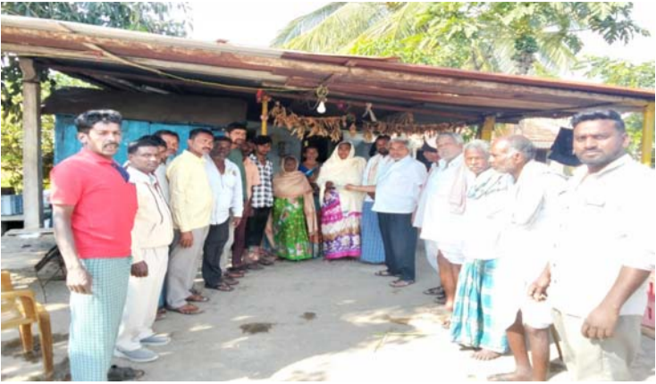
మృతుడి కుటుంబానికి ఆర్థిక సహాయం