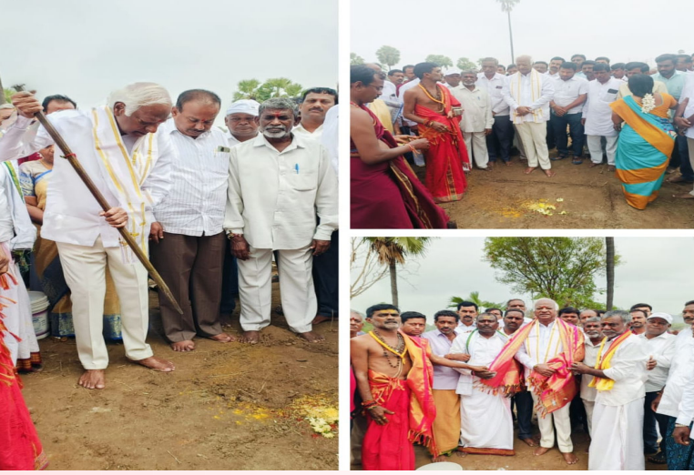
ప్రజా గొంతుక న్యూస్ / స్టేషన్ ఘణపూర్ / ప్రతినిధి

ధర్మసాగర్ మండలం ముప్పారం గ్రామంలో శ్రీ రేణుక ఎల్లమ్మ తల్లి ఆలయ నిర్మాణానికి శనివారం మాజీ ఉపముఖ్యమంత్రి స్టేషన్ ఘనపూర్ శాసన సభ్యులు కడియం శ్రీహరి భూమిపూజ చేశారు. ఆలయాన్ని తొందరగా నిర్మించుకోవాలని సూచించారు. కార్యక్రమంలో గౌరవ సభ్యుల నాయకులు పలువురు కాంగ్రెస్ నాయకులు తదితరులు పాల్గొన్నారు.