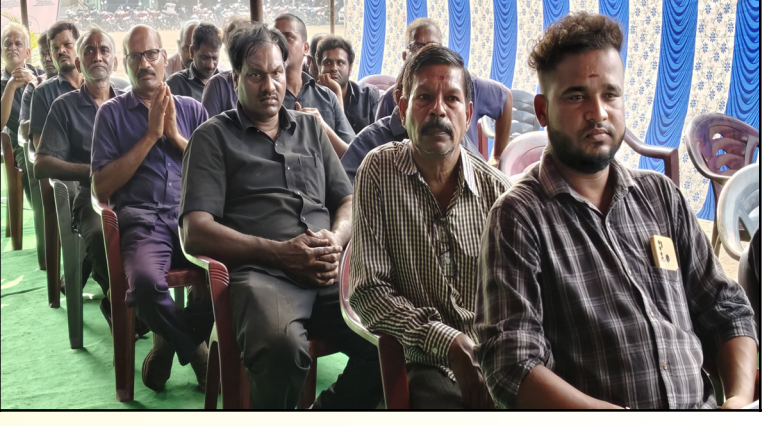
ప్రజా గొంతుక న్యూస్ మంచీర్యాల జిల్లా