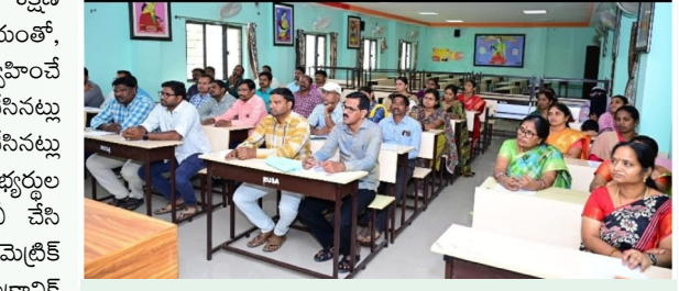
గ్రూప్ -03 ఎగ్జామినేషన్ సెంటర్స్ మెదక్-12 నర్సాపూర్-03 తూప్రాన్ -02 రామాయంపేట-02 మొత్తం 19 సెంటర్లు గ్రూప్ 3 పరీక్షలకు హాజరయ్యే అభ్యర్థులు-5867