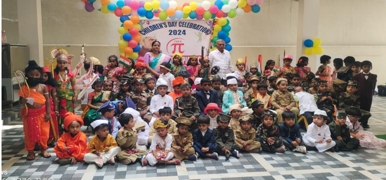
ప్రజా గొంతుక స్కూల్స్, సూర్యాపేట: