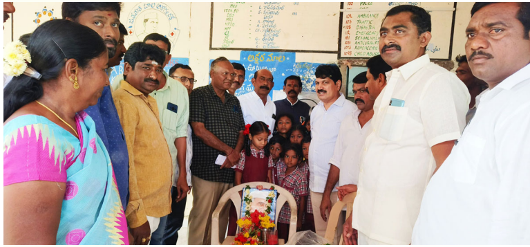
ప్రజా గొంతుక న్యూస్ ప్రతినిధి/భద్రాద్రి కొత్తగూడెం జిల్లా