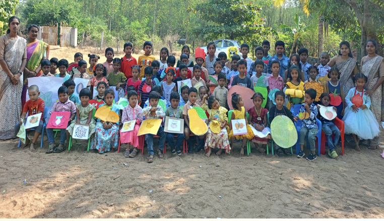
ప్రజా గొంతుక స్కూల్ ప్రతినిధి/భద్రాద్రి కొత్తగూడెం జిల్లా

భద్రాద్రి కొత్తగూడెం జిల్లా చర్ల మండలం సరస్వతి విద్యానికేతన్ లో భారతదేశ మొట్టమొదటి ప్రధానమంత్రి జవహర్ లాల్ నెహ్రూ వుట్టినరోజు సందర్భంగా బాలల దినోత్సవం జరుపబడింది. పిల్లలు విచిత్ర వేషధారణతో వేషధారణలో ఆందరినీ ఆకట్టుకున్నారు. ఉపాధ్యాయిని ఉపాధ్యాయులు పిల్లల దినోత్సవం సందర్భంగా పిల్లలకి జవహర్ లాల్ నెహ్రూ గొప్పతనం గురించి వివరించారు. ప్రాజెక్టర్ పై జవహర్ లాల్ నెహ్రూ యొక్క జీవిత చరిత్ర ని గురించి వివరించడం జరిగింది. బాలల దినోత్సవం సందర్భంగా పాఠశాలలో బాలల ఆనందం కోసం వివిధ ఆటలు పాటలు నిర్వహించడం జరిగింది.