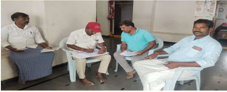
ప్రజా గొంతుక న్యూస్ గండిక్ నవంబర్ 14