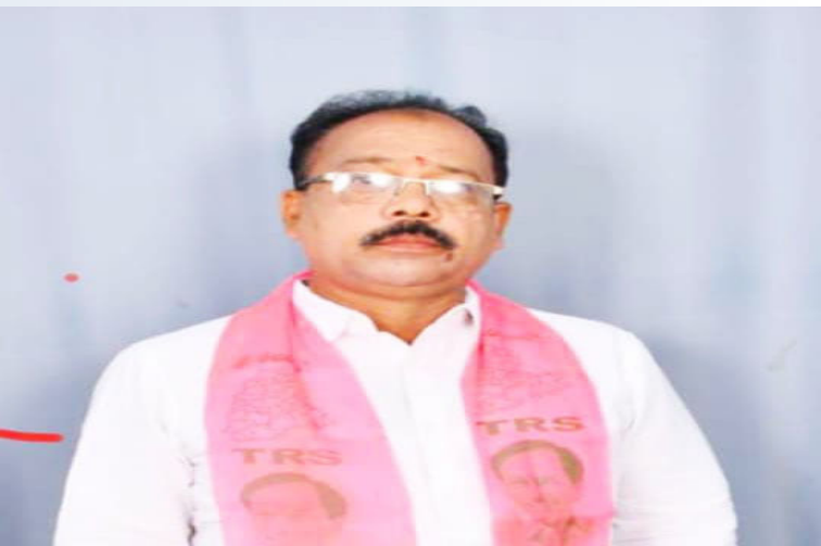
ప్రజా గొంతుక న్యూస్ ప్రతినిధి/భద్రాద్రి కొత్తగూడెం జిల్లా

భద్రాద్రి కొత్తగూడెం జిల్లా చర్ల మండలం తెలంగాణ రాష్ట్రంలో ఏ ఒక సంక్షేమ పథకాన్ని కూడా సరిగ్గా అమలు చేయలేని అసమర్థ పాలన కాంగ్రెస్ పార్టీ, బి.ఆర్.ఎస్ పార్టీ తెలంగాణ రాష్ట్ర మొదటి ముఖ్యమంత్రి కేసీఆర్ పాలనలో మూడు సంవత్సరాలు కరోనా మహమ్మారి వచ్చి రాష్ట్ర ఆర్థిక వ్యవస్థను అతలకుతళం చేసిన కూడా ఏ ఒక్క సంక్షేమ పథకాన్ని అమలు చేసిన ఘనత తెలంగాణ రాష్ట్ర మొదటి ముఖ్యమంత్రి కేసీఆర్ కే సాధ్యమైంది. రైతుల కోసం రైతు బంధు, రైతు బీమా, రైతు వేదిక, రైతు రుణమాఫీ, రైతులకు 24 గంటల ఉచిత కరెంట్ సకాలంలో ఎరువులు పంపిణీ సకాలంలో సబ్సిడీ రైతు పనిముట్లను అందించి తెలంగాణ రాష్ట్రాన్ని అన్నపూర్ణ రాష్ట్రంగా అభివృద్ధి చేసిన కేసీఆర్ కానీ నేడు తెలంగాణ రాష్ట్రంలో రేవంత్ సర్కార్ లో కుంటుబడిన సంక్షేమ పథకాలు లబ్ధి దిబ్బో అని అర్థంకాదు చేస్తున్న బదుగు బలహీన సర్కార్ ప్రజలు, రైతుల గురుంచి, యువకుల గురుంచి, మహిళలు గురుంచి రేవంత్ సర్కార్ చిన్న చూపు చూస్తూ గుడ్డి నిద్రపోతున్న రేవంత్ సర్కార్..