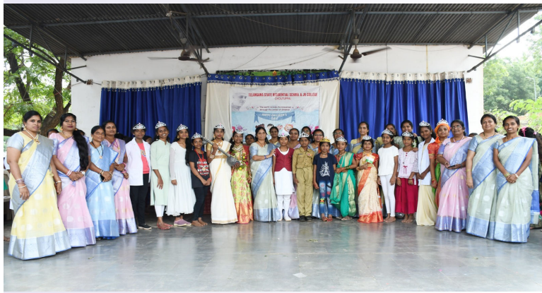
ప్రజా గొంతుక స్కూల్స్/ చౌటుప్పల్

యాదాద్రి భువనగిరి జిల్లా చౌటుప్పల్ మండల కేంద్రంలోని టీజీ ఆర్ఎస్ అండ్ జెసి గర్ల్స్ చౌటుప్పల్ పాఠశాల యందు బాలల దినోత్సవం ఘనంగా జరుపుకోవడం జరిగింది ఈ కార్యక్రమంలో భాగంగా పిల్లలందరికీ వివిధ రకాల ఉపన్యాస పాటల మ్యూజికల్ చైర్ కీడులకు సంబంధించిన పోటీలు నిర్వహించడం జరిగింది ఇందులో ప్రతిభ చూపించిన విద్యార్థులకు ప్రెజెంట్ కి సర్టిఫికేట్లు మరియు సాఫ్ట్ వేర్లు పంపిణీ చేయడం జరిగింది విద్యార్థులు అద్భుతమైన మేరకు ఉపాధ్యాయులందరూ ర్యాంపు వాక్ మరియు బాంబులు ఆడడం జరిగింది విద్యార్థులు అందరూ ఎంతో ఉత్సాహంగా ఉత్సాహంగా కార్యక్రమం లో పాల్గొనడం జరిగింది