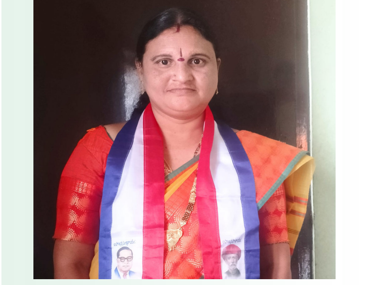
ప్రజా గొంతుక స్కూల్ ప్రతినిధి నల్లగొండ నవంబర్: 14

బీసీ కుటుంబ సర్వే తెలంగాణ రాష్ట్ర ప్రజలందరూ సద్వినియోగం చేసుకోవాలి ఎలాంటి అపోహలు కానీ అసమానాలు కానీ పడవద్దు ఆఫీసర్లు వచ్చినప్పుడు మన కులం గురించి అపోహలు కానీ అసమానాలు కానీ పడవద్దు ఆఫీసర్లు వచ్చినప్పుడు మన కులం గురించిన గర్హం చెప్పాలి బీసీ కులగనలకు సంక్షేమ పథకాలకు ఎలాంటి సంబంధం లేదు ఇప్పుడు గనక మనం కులం పేరు గర్హం చెప్పకా లేకపోతే ఎప్పటికీ మన వెనుకబడిన కులాల వారీగా ఉండాల్సి వస్తుంది