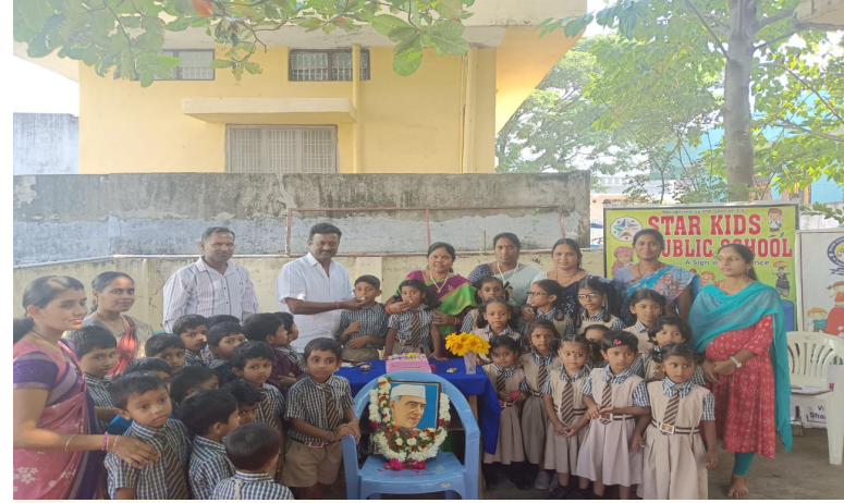
ప్రజా గొంతుక స్కూల్ /వరంగల్ జిల్లా /ప్రతినిధి: