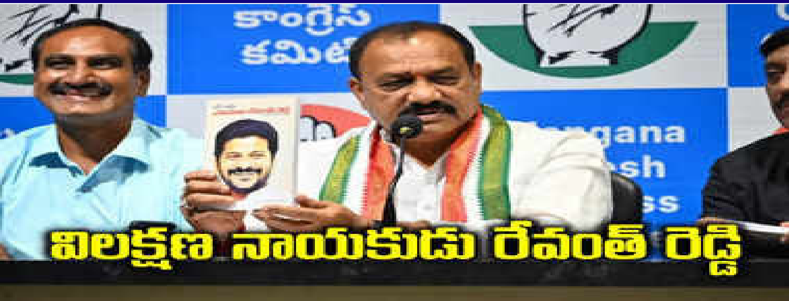
ఖిలక్షణ నాయకుడు రేవంత్ రెడ్డి