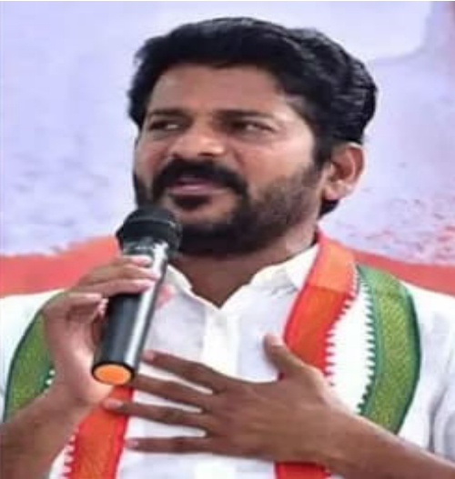
విచారణ చేపడితే ఎదుర్కొంటా. విశ్వసనీయ నరసన హైదరాబాద్ను చేర్చాలనే ఉద్దేశంతోనే ఫారులా-ఈ కారు రేసింగ్ను ఏర్పాటు చేశాం.