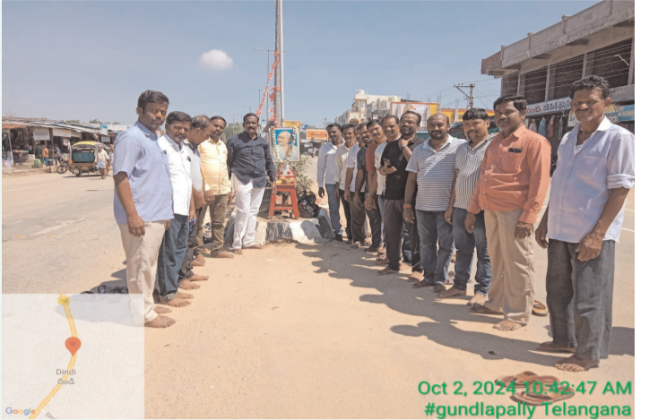
Oct 2, 2024 10:42:47 AM #gundlapally Telangana