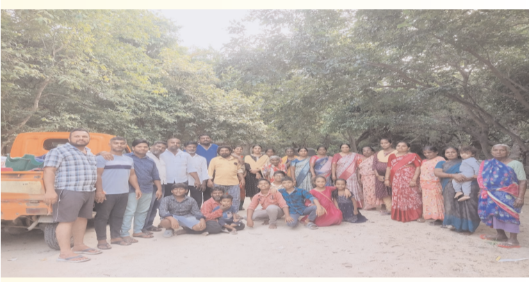
ప్రజా గొంతుకు న్యూస్, సూర్యాపేట:

కీడు వచ్చిందని 20వ వార్డు ప్రజలు వార్డును మొత్తం ఖాళీ చేసిన సంఘటన సూర్యాపేట జిల్లా కేంద్రంలో జరిగింది.