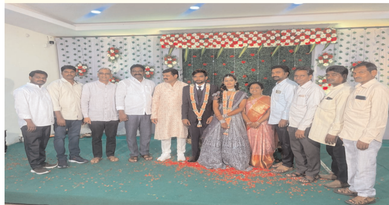
ప్రజా గొంతుకు ప్రతినిధి : శాయంపేట అక్టోబర్ 27