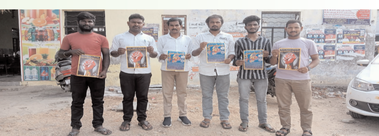
ప్రజా గొంతుక న్యూస్ ప్రతినిధి: నల్లగొండ జిల్లా :అక్టోబర్: 27