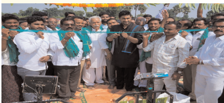
ప్రజా గొంతుక న్యూస్ గుర్రంపాడు

ధాన్యం కొనుగోలు కేంద్రాలను రైతులు సద్వినియోగం చేసుకోవాలని నాగార్జునసాగర్ ఎమ్మెల్యే జైవీరెడ్డి అన్నారు. ఆదివారం గుర్రంపాడులో ప్రాథమిక వ్యవసాయ సహకార సంఘం ఆధ్వర్యంలో ఏర్పాటుచేసిన వరి ధాన్యం కొనుగోలు కేంద్రాన్ని ప్రారంభించారు. రైతులు ధాన్యానికి కేంద్రాలకు తీసుకువచ్చి మద్దతు ధర పొందాలని సూచించారు.