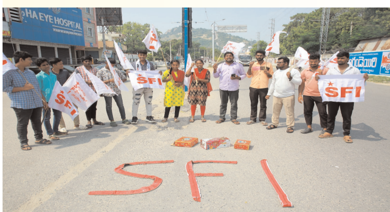
ప్రజా గొంతుక న్యూస్ ప్రతినిధి: నల్లగొండ జిల్లా: అక్టోబర్: 27

హైదరాబాద్ సెంట్రల్ యూనివర్సిటీ ఎన్నికలలో ఎన్ఎఫ్ఐ ప్యానల్ గెలిచి ఎన్ఎఫ్ఐ అడ్డ అని మరోసారి నిరుపించిన విద్యార్థులకు నల్లగొండ జిల్లా కమిటీ పక్షాన విప్లవ జేజీలు తెలియజేస్తూ పోటాటల పురిటి గడ్డ నల్లగొండ జిల్లా కేంద్రంలో బాణాసంచా కాల్చి మిఠాయిలు మంచి విజేత్రులు జరుపుకోవడం జరిగింది