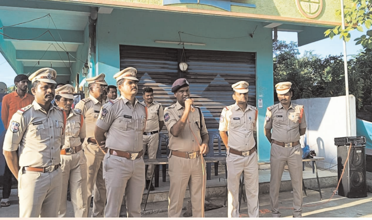
ప్రజా గొంతుకు న్యూస్ ప్రతినిధి/భద్రాద్రి కొత్తగూడెం జిల్లా