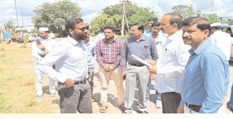
ప్రజా గొంతుకు న్యూస్ రాయకల్ అక్టోబర్ 18: