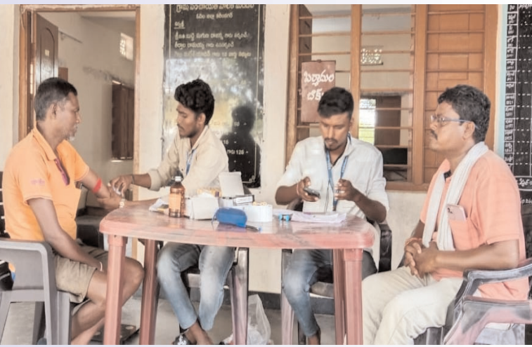
ప్రజా గొంతుక ఓడెల ప్రతినిధి :