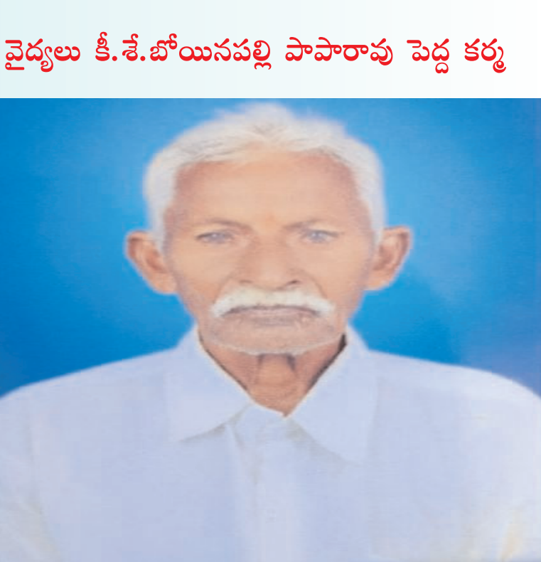
ములుగు అక్టోబర్ 16 (ప్రజా గొంతుకు న్యూస్):