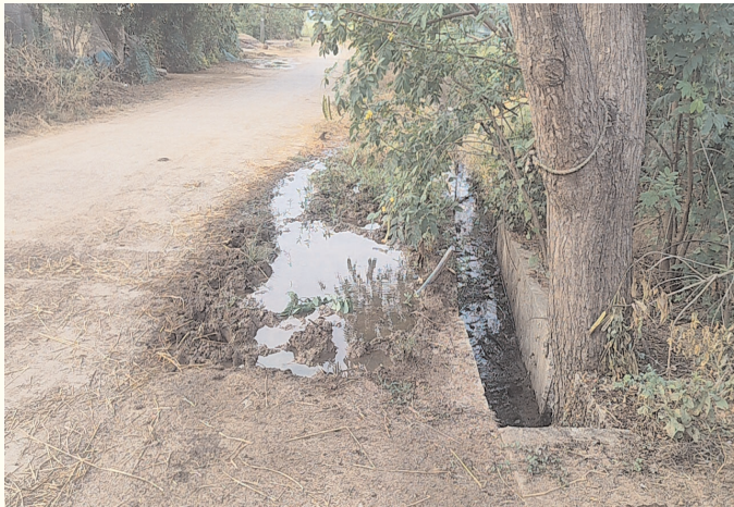
కలుషితమవుతున్న త్రాగునీరు.. బురదమయంగా మారుతున్న రోడ్డు... ప్రజా గొంతుకు న్యూస్/ జమ్మికుంట టౌన్

వీణవంక మండలం బ్రాహ్మణపల్లి గ్రామంలో వాడవాడనా త్రాగునీటి పైపులైన్ లోకేజీలతో పలుచోట్ల రోడ్డు బురదయంగా మారి, నీటి కాలువలు తలపెస్తున్నాయి. గ్రామపంచాయతీ అధికారుల నిర్లక్ష్యం కారణంగా, వాడవాడనా పైప్ లైన్ లోకేజీలు వల్ల, నీరు నిల్వ ఉండడం వల్ల ఈగలు, దోమలు త్వరగా అభివృద్ధి చెంది, రోగాలకు కారణమవుతున్నాయని, అంతేకాక ఆగి ఉన్న మురికి నీరు పైప్ లైన్ లోకి చేరి, త్రాగునీరు కలుషితమవుతుందని, ఒక వైపు తెలంగాణ ప్రభుత్వం గ్రామ గ్రామాన ప్రజల ఆరోగ్యాన్ని దృష్టిలో ఉంచుకుని స్వచ్ఛమైన నీటిని, ప్రతి ఇంటికి అందించాలని ఉద్దేశంతో మిషన్ భగీరథ పథకాన్ని చేపట్టిన, బ్రాహ్మణపల్లి జిపి అధికారుల నిర్లక్ష్యంతో, కలుషితమైన త్రాగునీటిని త్రాగాల్సి వస్తుందని, గ్రామ ప్రజలు ఆవేదన వ్యక్తం చేస్తున్నారు. ఇప్పటికైనా జిల్లా, మండల మిషన్ భగీరథ అధికారులు, నీటి సరఫరాధికారులు మేల్కొని, సత్కరమే పైప్ లైన్లను అధునికీకరించాలని, గ్రామ ప్రజలు కోరుతున్నారు.