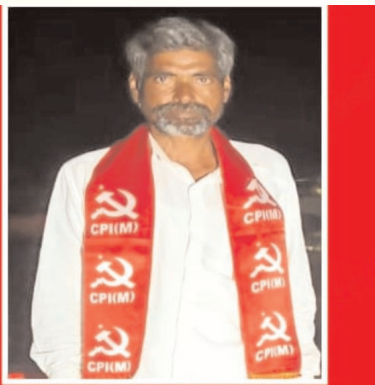
కా. ఏనుగుల నర్సింహ శాఖ కార్యదర్శి

ఏనుగుల, నరసింహ వలిగొండ అక్టోబర్ 16 ప్రజా గొంతుకు ప్రతినిధి