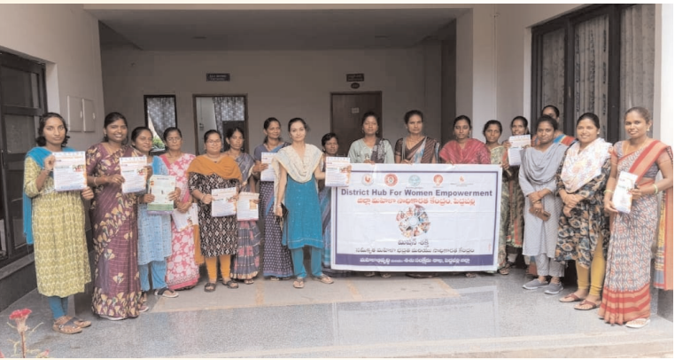
ప్రజా గొంతుకు పెద్దపల్లి ప్రతినిధి :