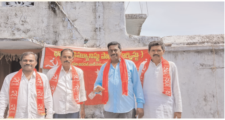
ప్రజా గొంతుకు , యాదాద్రి ( ఆత్మకూర్(ఎం)