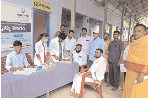
ప్రజా గొంతుకు ఓడెల ప్రతినిధి :