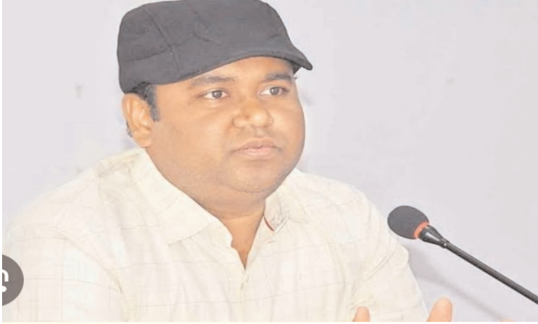
ప్రజా గొంతుక న్యూస్ డిస్కాంట్ అక్టోబర్ 16: