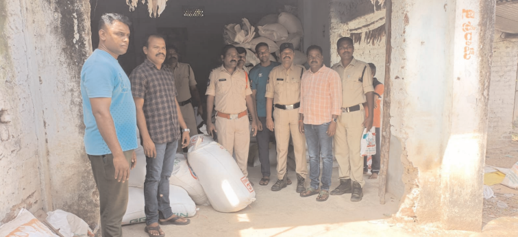
ప్రజా గొంతుకు నెక్కొండ ప్రతినిధి