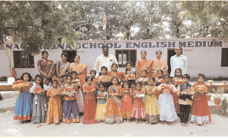
ప్రజా గొంతుక ప్రతినిధి : శాయంపేట అక్టోబర్ 05 :