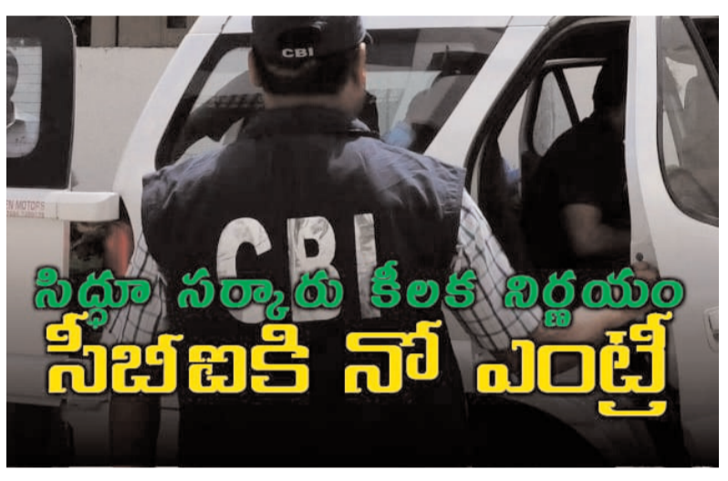
సిద్ధా సర్కారు కీలక నిర్ణయం సీబీఐకి నో ఎంట్రి

మైసూర్ అర్బన్ డెవలప్మెంట్ అథారిటీ (మూడ)స్థానం కేసులో సీఎం సిద్ధరామయ్య విచారణను ఎదుర్కొన్న వేళ కర్ణాటక ప్రభుత్వం కీలక నిర్ణయం తీసుకుంది. రాష్ట్రంలో కేంద్ర దర్యాప్తు సంస్థ సీబీఐ విచారణను అనుమతించే గతంలో మంజూరు చేసిన నోటిఫికేషన్లు ఉపసంహరించుకుంది. ఈ మేరకు గురువారం జరిగిన మంత్రివర్గ సమావేశంలో ఈ నిర్ణయించింది. కుంభకోణం కేసులో వాస్తవాలు వెలుగులోకి వచ్చేందుకు సీబీఐతో దర్యాప్తు జరపాలని డిమాండ్లు వెల్లువెత్తుతున్న తరుణంలో ఈ పరిణామం చోటుచేసుకోవడం గమనార్హం. సీఎంపై సీబీఐ విచారణను నిరోధించడానికి కాంగ్రెస్ సర్కార్ ఈ చర్య తీసుకున్నట్లు తెలుస్తోంది. అయితే సీబీఐ పక్షపాతంగా వ్యవహరించడం వల్లే ఈ నిర్ణయం తీసుకున్నట్లు రాష్ట్ర న్యాయశాఖ మంత్రి హెచ్.పాటిల్ తెలిపారు. సీఎం సిద్ధరామయ్య ఎదుర్కొంటున్న భూ కుంభకోణం ఆరోపణలకు, దీనికి ఎలాంటి సంబంధం లేదని చెప్పారు. 'కేంద్ర దర్యాప్తు సంస్థ దుర్వినియోగానికి గురవుతోంది. పక్షపాతంతో వ్యవహరిస్తోంది. అందుకే ఈ నిర్ణయం తీసుకుంటున్నాం' అని తెలిపారు. మూడూ భూ కుంభకోణం కేసులో సీఎం సిద్ధరామయ్యపై విచారణకు గవర్నర్ అనుమతివ్వడాన్ని బద్దవారం హైకోర్టు సమర్థించిన విషయం తెలిసిందే. ఈ అనుమతిని సవాల్ చేస్తూ సీఎం పేసిన పిటిషన్లు కొట్టివేస్తూ.. గవర్నర్ చర్యలుపట్ల ప్రకారం ఉన్నాయని తెలిపింది. కోర్టు తీర్పు వెలువరించిన నేపథ్యంలో సీబీఐ విచారణకు ఆదేశించింది. అసంతరం ఈ కుంభకోణంలో సిద్ధరామయ్యపై విచారణజరపాలని లోకాయుక్త పోలీసులను ప్రజా ప్రతినిధుల ప్రత్యేక కోర్టు ఆదేశించింది. ఆయనపై సీఆర్.పీ సెక్షన్ 156(3) కింద కేసు నమోదు చేయాలని ఆదేశించింది.