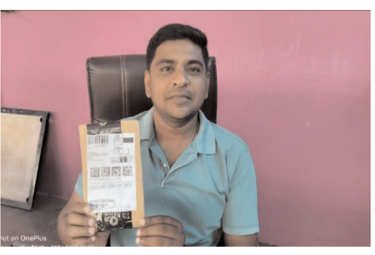
టీ పర్ఫెక్ట్ బుక్ చేస్తే కాళీ వట్టను పంపిన వైనం ప్రజా గొంతుక న్యూస్ / జమ్మికుంట టౌన్