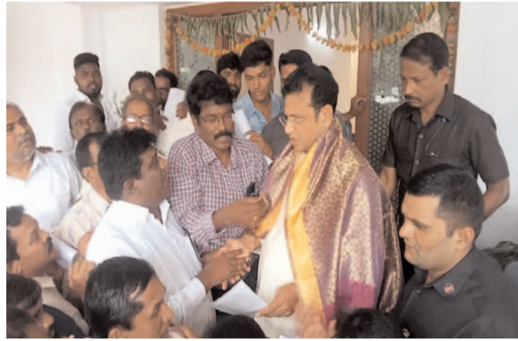
హైదరాబాద్ సెప్టెంబర్ 20 మినిస్టర్ క్వార్టర్స్ ప్రజా గొంతుక డెస్క్