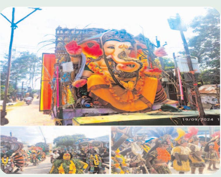
ప్రజా గొంతుక న్యూస్ ప్రతినిధి/ చర్ల మండలం