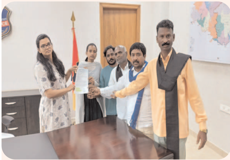
ప్రజాగొంతుకు. కామారెడ్డి ప్రతినిధి సెప్టెంబర్ 19.24.