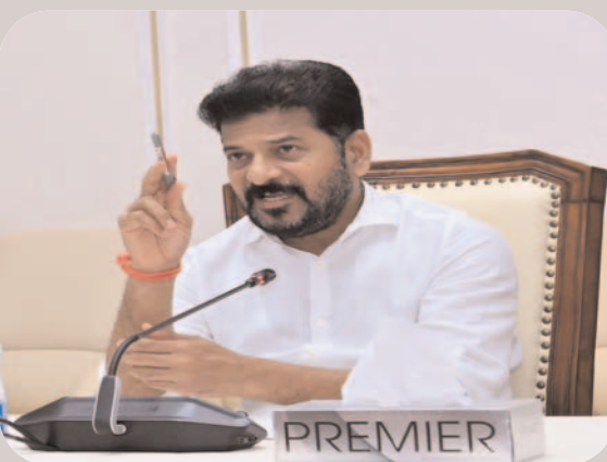
గ్రేటర్ హైదరాబాద్ ను ఇండోర్ తరహాలో అద్భుతమైన క్లీన్ సిటీగా తీర్చిదిద్దేందుకు అవసరమైన ప్రణాళికలు రూపొందించాలని