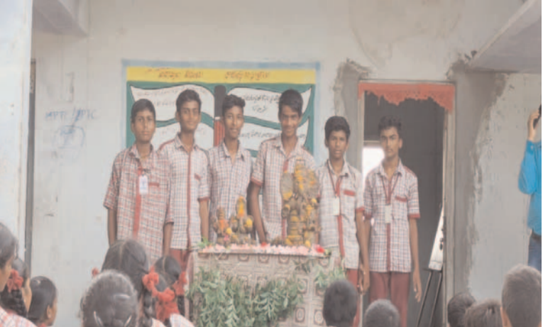
ప్రజా గొంతుక స్పాన్ యాదాద్రి ఆత్మకూర్ ( ఎం )