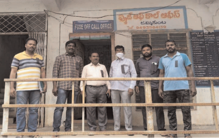
-మెరిట్ కమ్ సీనియారిటీ రద్దు చేయాలని సల్ల బ్యాన్లతో నిరసన. ప్రజా గొంతుక స్యూస్ / జమ్మికుంట టౌన్