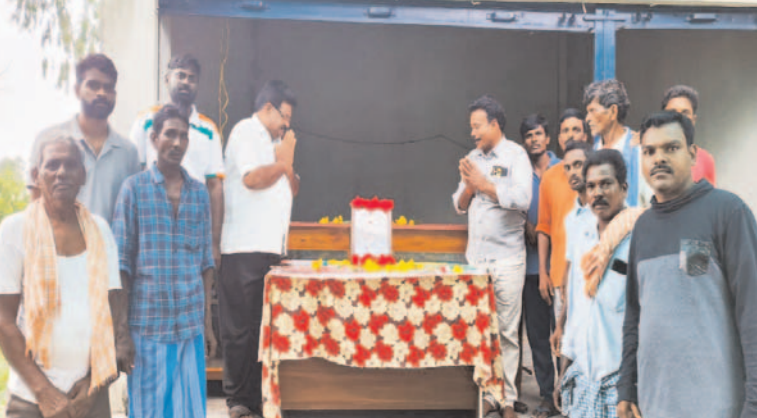
ప్రజా గొంతుక న్యూస్ ప్రతినిధి/భద్రాద్రి కొత్తగూడెం జిల్లా