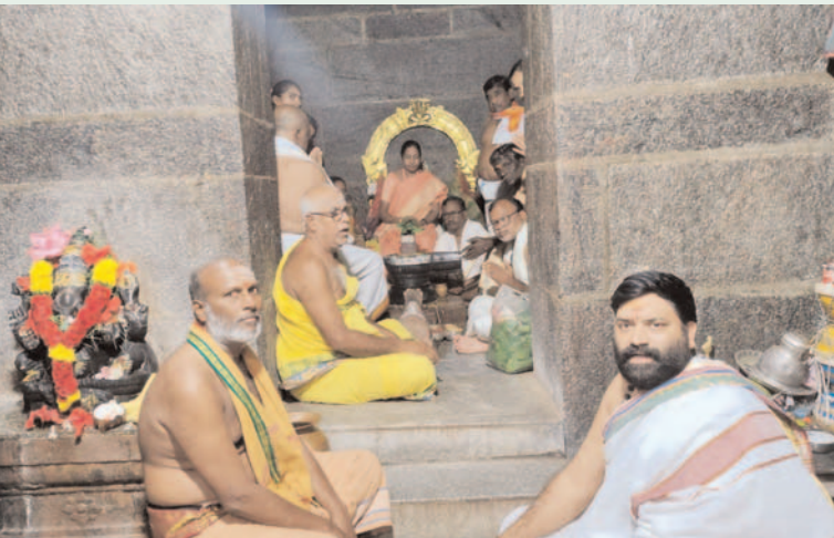
ప్రజా గొంతుక న్యూస్ / జమ్మికుంట టౌన్