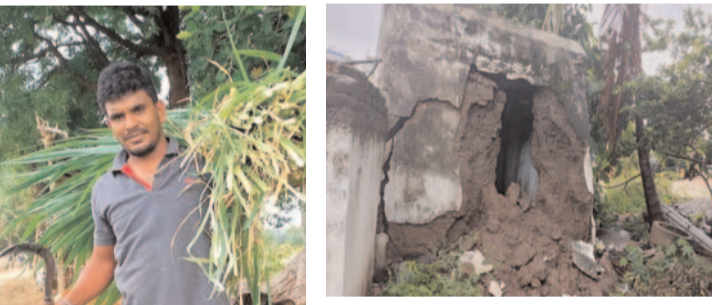
ప్రభుత్వం స్థానిక ప్రజా ప్రతినిధులు ఆదుకోవాలని వలుగొండ శ్రీనివాస్ గౌడ్ మొర ప్రజా గొంతుక గ్రంథాల రెడ్డి జిల్లా బ్యూరో