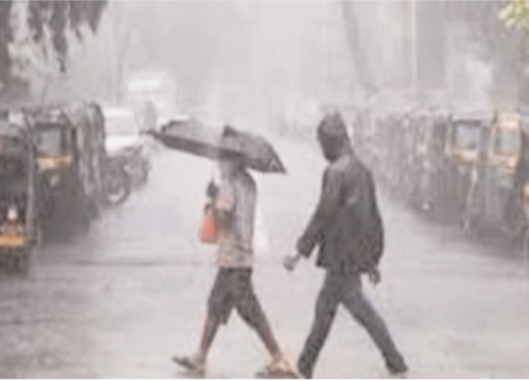
ప్రజా గొంతుక న్యూస్ ప్రతినీధి/భద్రాద్రి కొత్తగూడెం జిల్లా

తెలుగు రాష్ట్రాల్లో భారీ వర్షాలు కురుస్తున్నాయి. శుక్రవారం నుంచి ఎడతెలిపి లేకుండా వర్షాలు కురుస్తూనే ఉన్నాయి. మధ్య బంగాళాఖాతంలో ఏర్పడ్డ తీవ్ర అల్పపీడనం శనివారం ఉదయం వాయుగుండంగా మారింది. దీని ప్రభావంతో ఇవాళ, రేపు తెలంగాణ రాష్ట్రానికి భారీ నుంచి అతి భారీ వర్షాలు కురుసే అవకాశం ఉందని వాతావరణ శాఖ అధికారులు తెలిపారు. ప్రస్తుతం బంగాళాఖాతంలో వాయుగుండం కొనసాగుతోందన్నారు. ఈ వాయుగుండం ప్రభావంతో తెలంగాణలో భారీ నుంచి అతి భారీ వర్షం కురిసే అవకాశం ఉందని వాతావరణ శాఖ అధికారులు తెలిపారు. ఈ మేరకు రాష్ట్రానికి రెడ్ అలర్ట్ జారీ చేశారు. ముఖ్యంగా నల్లగొండ, నాగర్ కర్నూల్, వనపర్తి, జోగులాంబ గద్వాల, నారాయణ పేట జిల్లాల్లో అత్యంత భారీ వర్షాలు కురుస్తాయని చెప్పారు. జయశంకర్ భూపాలపల్లి, ములుగు, భద్రాద్రి కొత్తగూడెం, ఖమ్మం, సూర్యాపేట జిల్లాలో మోస్తరు నుంచి భారీ వర్షం కురిసే అవకాశం ఉందన్నారు. శనివారం నాడు ములుగు, భద్రాద్రి కొత్తగూడెం జిల్లాల్లో అత్యంత భారీ వర్షాలు కురుస్తాయన్నారు. తెలంగాణలో గంటకు 30-40 కిలోమీటర్ల వేగంతో గాలులు వీచే అవకాశం ఉందన్నారు. కాగా, ఇప్పటి వరకు నారాయణపేటలో అత్యధికంగా 13 సెంటీమీటర్ల వర్షపాతం నమోదైంది. రెడ్ అలర్ట్ ప్రకటించిన జిల్లాలివే. కరీంనగర్, పెద్దపల్లి, జయశంకర్ భూపాలపల్లి, ములుగు, భద్రాద్రి కొత్తగూడెం, ఖమ్మం, నల్లగొండ జిల్లాలకు రెడ్ అలర్ట్ జారీ చేసింది హైదరాబాద్ వాతావరణ కేంద్రం ఆదిలాబాద్, కొమరం భీం అసిఫాబాద్, మంచిర్యాల, నిర్మల్, నిజామాబాద్, రాజన్న సిరిసిల్ల, సూర్యాపేట, మహబూబ్ నగర్, వరంగల్, హన్మకొండ, సిద్దిపేట, వికారాబాద్, నంగారెడ్డి, మెదక్, కామారెడ్డి, నాగర్ కర్నూల్ జిల్లాలకు ఆరెంజ్ అలర్ట్ జారీ చేసింది.