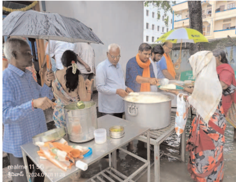
ప్రజా గొంతుకు న్యూస్ / జమ్మికుంట టౌన్

అన్నపూర్ణ సేవా సమితి వారి ఆధ్వర్యంలో శ్రీ విశ్వేశ్వర స్వామి దేవాలయం బొమ్మల గుడి జమ్మికుంటలో గత రెండు సంవత్సరముల నుండి అన్నదానము దాతల సహాయ సహకారాలతో నిర్వహించబడుచున్నది. ఎడతెరిపి లేకుండా కురుస్తున్న వర్షాలలో సహితం అన్నదానం నిర్వహించబడుచున్నది అన్నపూర్ణ సేవా సమితి వారి ఆధ్వర్యంలో అన్నదాన కార్యక్రమానికి సహకరిస్తున్న దాతలు అందరికీ అష్ట ఐశ్వర్య సుఖ సంతోషాలు కలగాలని శివపార్వతుల దీవెనలు కలగాలని అన్నపూర్ణ సేవా సమితి వారు ఆకాంక్షించారు.