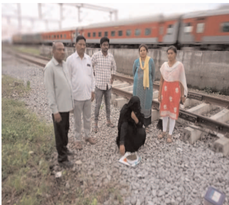
ప్రజా గొంతుకు న్యూస్ / జమ్మికుంట టౌన్