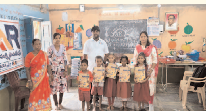
శివంపేట, ప్రజాగొంతుకు స్వస్థ, ఆగస్టు 31: