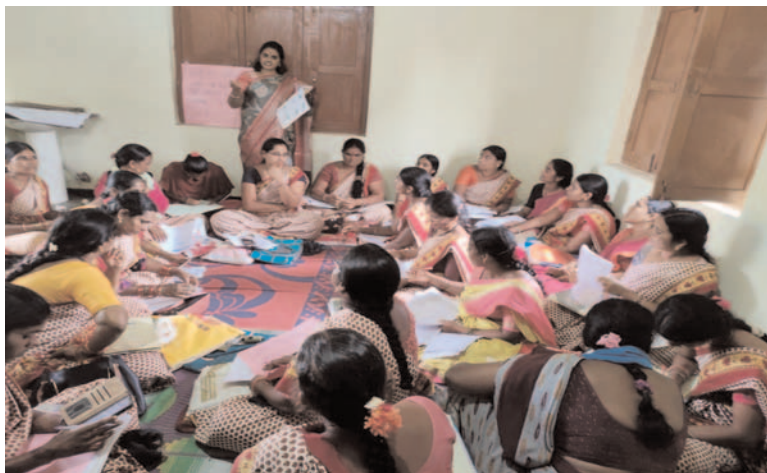
అంగన్నాడి టీచర్లకు శిక్షణ కార్యక్రమం. శివంపేట. ప్రజా గొంతుకు న్యూస్, ఆగస్టు 31: