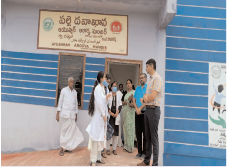
ప్రజాగొంతుక. కామారెడ్డి ప్రతి నిధి ఆగస్టు. 28.24.