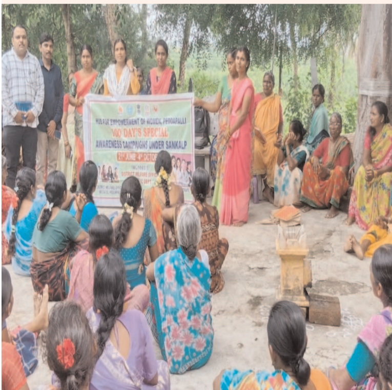
ప్రజా గొంతుక పెద్దపల్లి ప్రతినిధి :

మహిళలు అన్ని రంగాల్లో ముందు ఉండాలి రాఘవాచార్ శుక్రవారం. పెద్దపల్లి జిల్లాలోని రాఘవాచార్ గ్రామ శ్రీ వినాయక గ్రామ సమైక్య సంఘ మహా సభలోపెద్దపల్లి జిల్లా మహిళా సాదికరిత కేంద్రం అవగాహన సదస్సు ఏర్పాటు చేయడం జరిగింది ఈ కార్యక్రమం లో జిల్లా మహిళా సాదికరిత కేంద్రం, జెండర్ సెన్సిటివ్ జె.సచరిత, స్వప్న, సైనాస్ లిట్లాసి, సంద్య రాణి మాట్లాడుతూ,రోజు రోజుకు ఆడపిల్లల సంఖ్య తగ్గి పోతుంది,ఆడపిల్లలకు,మహిళలకు భద్రత లేదు, కాబట్టి ఆడపిల్లల తలి దండ్రులు పిల్లలని జాగ్రత్త గా చూడాలని, వారికి గుడ్ టవ్,బ్యాడ్ టవ్ తెలిసి ఉండాలని,అన్నరు,పిల్లల కోసం ప్రత్యేక మైన పాక్ సో చట్టం, ఉన్నదని, దీని గురించి అందరికీ అవగాహన కలిగి ఉండాలన్నారు,ఆడపిల్లల పట్ల వివక్షత చూప వద్దని,ఆడపిల్లలని, చదివిస్తే వారు మంచి ఉన్నత స్థాయిలో ఉంటారని,ఎవరైన బ్రాణ హత్యలకు పాల్పడిన,వాటికి,ప్రలోబ పెట్టిన పి సి .పి. ఎస్. డి. టి చట్టం ప్రకారం మూడు సంవత్సరాల జైలు శిక్ష మరియు చది వేల రూపాయల జరిమానా వంటి చట్టపరమైన శిక్షలు ఉంటాయని వివరించారు అలగే అత్యవసర వేలల్లో ఉపయోగపడే హెల్త్ లైన్ నంబర్లు 181,1098 మరియు సినీయర్ సిటిజన్ 145677, దివ్యాంగులకు 155326 ల గురించి తెలిపారు, మహిళలకు, రుతు క్రమ ఆరోగ్యం మరియు పరిశుభ్రత, మెన్స్ట్రాల్ కేమ్ ఉపయోగం మరియు వాడకం గురించి వివరించారు, మహిళలు ఆరోగ్యం పట్ల శ్రద్ధ వహించాలని,అన్నరు, అనంతరం కేంద్ర రాష్ట్ర పథకాల గురించి,ప్రమాద బీమా గురించి వివరించారు , ఈ కార్య క్రమం లో సి .సి :క్రిష్ణ. సి .ఎ: పద్మప్రెసిడెంట్: మాధవి,మహిళలుపాల్గొన్నారు.