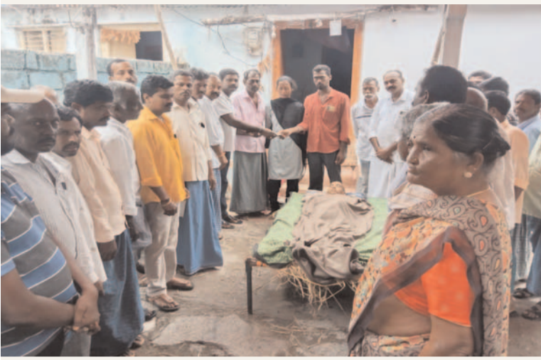
వలిగొండ ఆగస్టు 23 ప్రజా గొంతుకు ప్రతినిధి