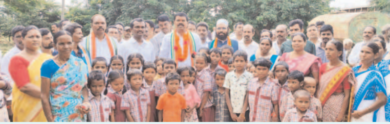
ప్రజా గొంతుకు న్యూస్ ప్రతినిధి/భద్రాద్రి కొత్తగూడెం జిల్లా

భద్రాద్రి కొత్తగూడెం జిల్లా కరకగూడెం మండలంలోని కొత్తగూడెం, చొప్పాల గ్రామపంచాయతీ పరిధిలో 19 లక్షల రూపాయల అంచనా వ్యయంతో నిర్మించిన 4 సీసీ రోడ్లను రిబ్బన్ కట్ చేసి ప్రారంభించి, అలాగే తుమ్మలగూడెం అనంతారం, పద్మాపురం గ్రామపంచాయతీ పరిధిలో 21 లక్షలతో పలు అభివృద్ధి కార్యక్రమాలకు శంకుస్థాపన చేసిన పినపాక నియోజకవర్గ శాసనసభ్యులు పాయం వెంకటేశ్వర్లు అనంతరం ప్రజా సమస్యలపై గ్రామపంచాయతీ పరిధిలో సమీక్ష సమావేశం నిర్వహించి సమస్యలు తెలుసుకుంటూ అధికారులతో చర్చించారు. ఈ సందర్భంగా వారు మాట్లాడుతూ, ప్రజలందరి దీవెనలతో భారీ మెజార్టీతో గెలుపొందిన తర్వాత మన కాంగ్రెస్ పార్టీ ప్రజా ప్రభుత్వంలో ఆయా గ్రామ పంచాయతీల పరిధిలో 40 లక్షల రూపాయలతో చేపట్టినటువంటి సిసి రోడ్లను అందరి సమక్షంలో ప్రారంభించుకోవడం, శంకుస్థాపన చేయడం చాలా ఆనందంగా ఉండవచ్చు. అలాగే సమీక్ష సమావేశంలో ప్రజలతో ఎన్నికల సమయంలో చెప్పినటువంటి సమస్యలన్నీ గుర్తున్నాయని అలాగే ఇంకా సమస్యలు ఏమున్నా తన దృష్టికి తీసుకురావాలని ఎటువంటి సమస్యలైనా అన్నిటిని పరిష్కరించే బాధ్యత నాది అని హామీ ఇచ్చారు. ఎన్నికల సమయంలో కాంగ్రెస్ పార్టీ చెప్పినట్లుగా ఆరు గ్యారెంటీ పథకాలను ప్రజా ప్రభుత్వం అమలు చేస్తుందని ఆ పథకాలు అర్జులైన ప్రతి పేదవాడికి దక్కే విధంగా చేసే బాధ్యత నాది అన్నారు. ఈ కార్యక్రమంలో ప్రభుత్వ అధికారులు, మాజీ ప్రజాప్రతినిధులు, నియోజకవర్గ నాయకులు, మండల కాంగ్రెస్ పార్టీ అధ్యక్షులు సయ్యద్ ఇక్బాల్ హుస్సేన్, సీనియర్ నాయకులు, మండల నాయకులు, మహిళా నాయకులు, యువజన నాయకులు కార్యకర్తలు అభిమానులు గ్రామస్థులు తదితరులు పాల్గొన్నారు.