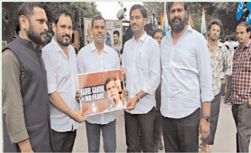
వారిపట్ల ప్రతిఒక్కరు అప్రమత్తంగా ఉండాలి. రుణమాఫీ చేయడంతో బీఆర్ఎస్ నేతలకు ఏం చేయాలో పాలుపోవట్లేదు. దీంతో అబద్ధాలకు తెరతీశారు. కేటీరామారావు రుణమాఫీ విషయంలో పచ్చి అబద్ధాలు చెబుతున్నారు. వారు రూ.లక్ష రుణం మాఫీ చేయడానికి ఆసహించాలి వద్దారు. అప్పటికే అందరికీ పూర్తి చేయలేదు. కానీ మేం ఇచ్చిన మాట ప్రకారం రూ. 2 లక్షల రుణాలను మాఫీ చేశాం" అని టీపీసీసీ నాయకులు బట్టు జగన్ యాదవ్ స్పష్టం చేశారు.