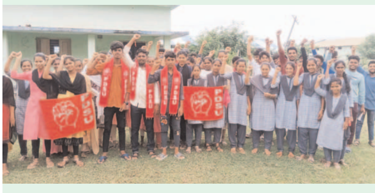
ప్రజా గొంతుకు న్యూస్ ప్రతినిధి/భద్రాద్రి కొత్తగూడెం జిల్లా