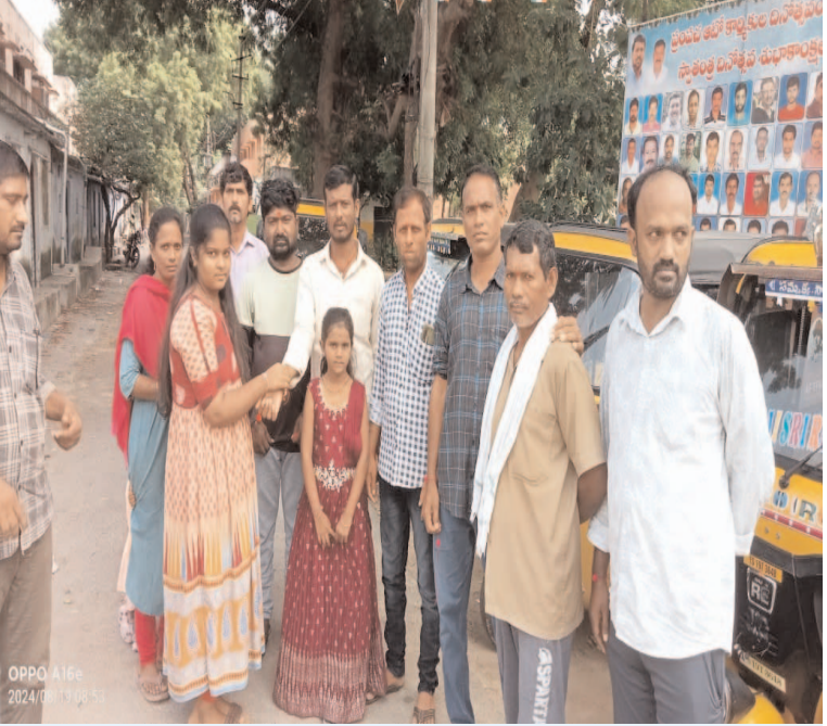
ప్రజా గొంతుక న్యూస్ / మంచిర్యాల నియోజకవర్గం / సన్మూర్తి: