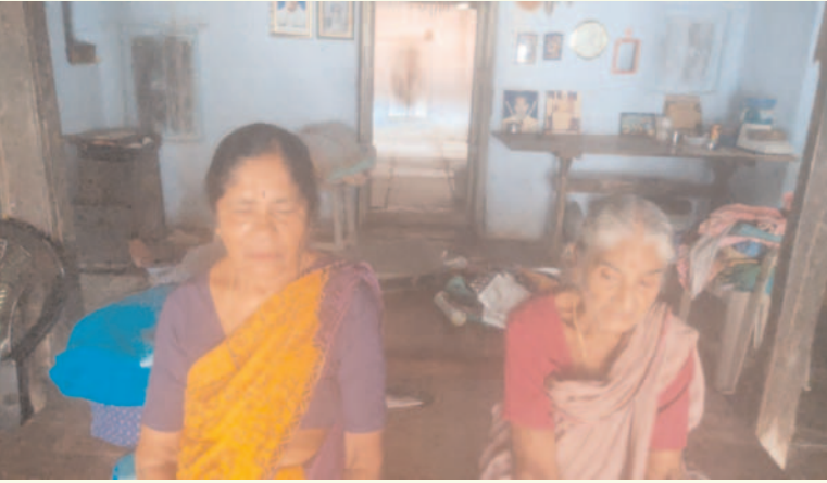
ప్రజా గొంతుక న్యూస్/మంధని/ఆగస్టు 19