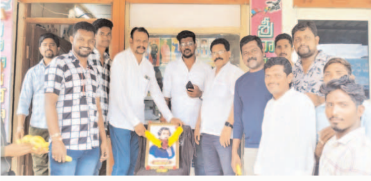
ప్రజా గొంతుకు న్యూస్ ప్రతినిధి/ భద్రాద్రి కొత్తగూడెం జిల్లా

భద్రాద్రి కొత్తగూడెం జిల్లా చర్ల మండలం ప్రపంచ ఫోటోగ్రఫీ దినోత్సవసందర్భంగా పాత చర్ల రఘు థియేటర్ రోడ్డు లో శ్రీరామ స్టూడియో ప్రాంగణంలో ఫోటోవీడియోఅసోసియేషన్ ఆధ్వర్యంలో లూయిస్ దాగ్ రే చిత్రవలూనికీ పూలమాలలేసి,ఘనంగా,నివాళులుఅర్పించారు.ఈకార్యక్రమంలో మండల ఫోటోగ్రాఫర్లు పాల్గొని కార్యక్రమాన్నివిజయవంతం చేశారు.