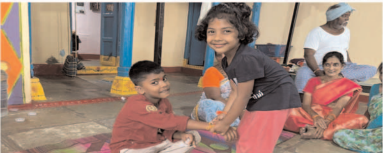
అన్నకు రాణీ కట్టిన చెల్లెలు ఘనంగా మండల వ్యాప్తంగా రాణీ పౌర్ణమి వేడుకలు ప్రజా గొంతుక న్యూస్ దోమ ప్రతినిధి కృష్ణ యాదవ్