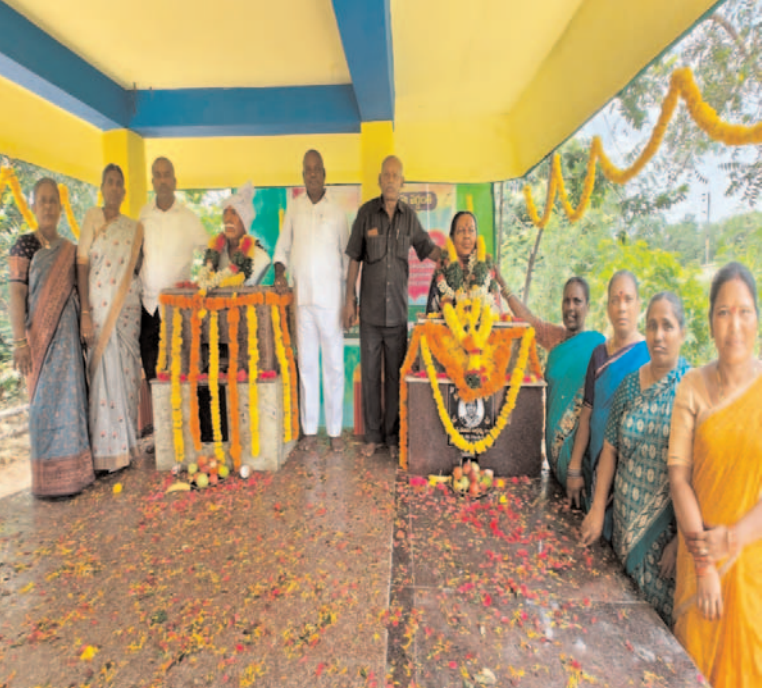
ప్రజా గొంతుక స్పాన్/జనగామ రూరల్: