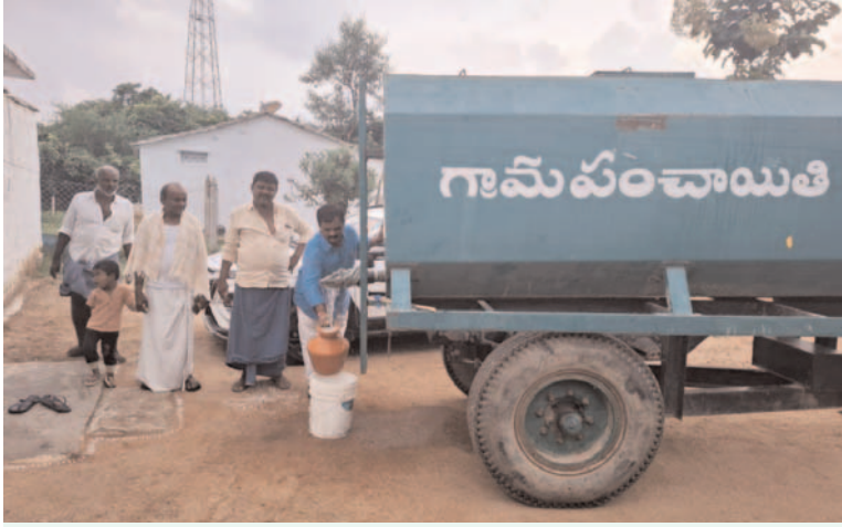
ప్రజా గొంతుక న్యూస్ గండ్లపల్లి ఆగస్టు 18