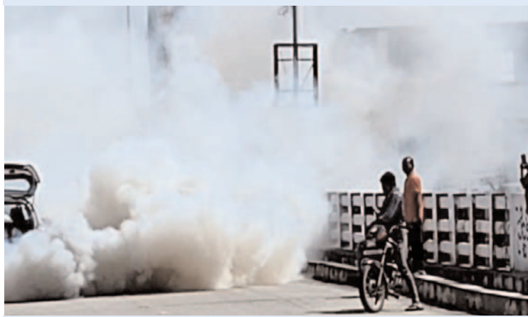
కార్ నుండి ఇంజన్ ఆయిల్ లీక్ అవ్వడంతో కారు నుండి భారీ పొగలు ప్రజా గొంతుక న్యూస్/ జమ్మికుంట టౌన్

జమ్మికుంట స్థానిక బస్టాండ్ వద్దనున్న షైట్ వర్ బ్రిడ్జి పైన జమ్మికుంట నుండి హుజూరాబాద్ వైపుగా వెళ్తున్న కారు ఆసుకోకుండా షైట్ వర్ బ్రిడ్జి పైన ఆగిన కారు నుండి ఇంజన్ ఆయిల్ లీక్ అవ్వడంతో ఇంజన్ వేడిగా ఉండటం వలన ఒక్కసారిగా కారు నుండి దట్టమైన పొగలు రావడం జరిగింది. దీనితో చుట్టూరా ఉన్న ప్రజలు కారు ఎక్కడ పేలిపోతుందోనని ఒక్కసారి భయభ్రాంతులకు లోన కారు నుండి దూరంగా వెళ్లారు. కార్ నుండి విపరీతమైన పొగలు రావడంతో కారు చుట్టూ ఏమి జరుగుతుందో తెలియని పరిస్థితి నెలకొంది. కారులో ఉన్న ఆయిల్ అయిల్ ట్యాంక్ వందల లీటర్ల పొగలు తగ్గుముఖంపడ్డాయి. దీంతో షైట్ వర్ పై ప్రయాణిస్తున్న ప్రయాణికులు ఊపిరిపించుకున్నారు.