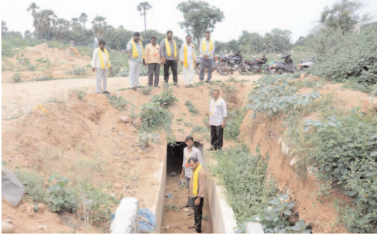
తెలుగుదేశం పార్టీ పక్షాన డిమాండ్ ప్రజా గొంతుక స్పాన్/ చౌటుప్పల్