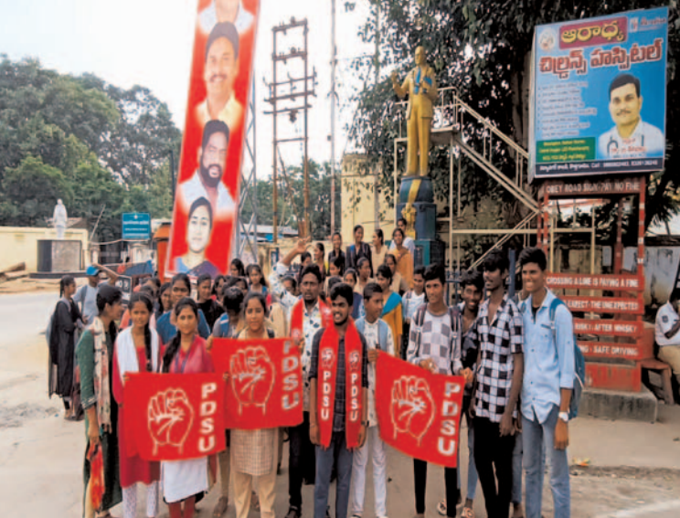
ప్రజా గొంతుక న్యూస్ ప్రతినిధి/భద్రాద్రి కొత్తగూడెం జిల్లా