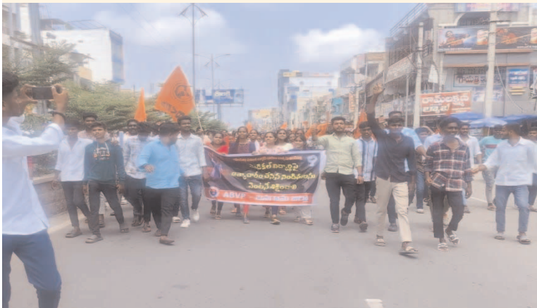
ప్రజా గొంతుక ప్రతినిధి/జనగామ: