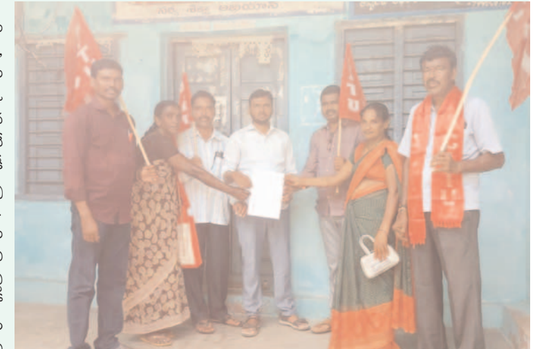
ప్రజా గొంతుక న్యూస్ ప్రతినిధి/ భద్రాద్రి కొత్తగూడెం జిల్లా