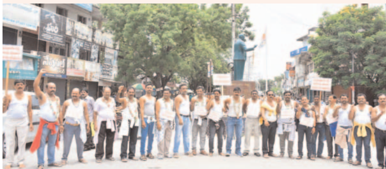
అర్జనగూంగా జర్నలిస్టుల నిరసన ప్రజా గొంతుక న్యూస్ రాయితో టౌన్

ప్రజా ప్రతినిధులు జర్నలిస్టుల చెవిలో పూలు పెడుతున్నారని జిల్లా అధ్యక్షుడు శ్రీనివాసరావు విమర్శించారు. స్థానిక ఆర్టీవో ఆఫీసు ముందు దీక్షా చేస్తున్న జర్నలిస్టులు చెవిలో పూలు పెట్టుకొని, స్థానిక తాహసిల్ చౌరస్తా నుండి పాత బస్టాండ్ వరకు అర్జనగూ దీక్షలు చేస్తున్న ప్రభుత్వ ప్రజా ప్రతినిధులు పట్టించుకోవడంలేదని ఆవేదన వ్యక్తం చేశారు. జర్నలిస్టు లు అందరూ పేద మధ్యతరగతి కి చెందిన వారినని అన్నారు. అరకౌర వసతులతో, ఇంటి రెంట్ కూడా కట్టే పరిస్థితి లేదన్నారు. ప్రభుత్వ పరంగా రావలసిన ఇండ్లలకు కోసమే పోరాటం చేస్తున్నామన్నారు. ఇకనైనా ప్రజాప్రతినిధులు పట్టించుకోకపోతే గల్లి నుండి ఢిల్లీ వరకు ఉద్యమాన్ని ఉద్దేశం చేస్తామన్నారు. వెంటనే ప్రజాప్రతినిధులు పట్టించుకోని వెంటనే ఇండ్ల స్థలాలు కల్పించాలని డిమాండ్ చేశారు.