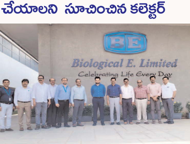
ప్రజా గొంతుక మేడ్చల్-మల్కాజ్గిరి