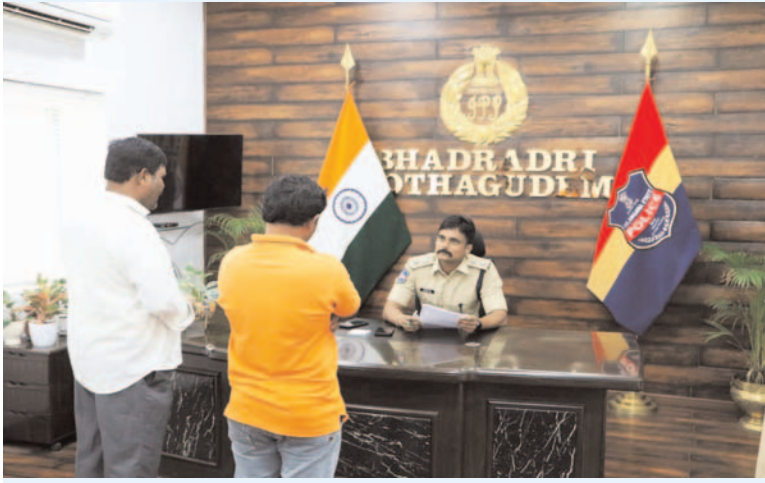
ప్రజా గొంతుకు స్వ్యాస్ ప్రతినిధి/ భద్రాద్రి కొత్తగూడెం జిల్లా

భద్రాద్రి కొత్తగూడెం జిల్లా గ్రీవెన్స్ డే కార్యక్రమంలో భాగంగా జిల్లా ఎస్పీ రోహిత్ రాజు ఐపీఎస్ ఎస్పీ కార్యాలయానికి వివిధ రకాల సమస్యలతో వచ్చిన భాదితుల సమస్యలను అడిగి తెలుసుకున్నారు. అట్టి సమస్యల సత్వర పరిష్కారానికి సంబంధిత అధికారులు తక్షణమే విచారణ చేపట్టి బాధితులకు న్యాయం చేకూర్చాలని ఆదేశించారు. ఈ రోజు ఇట్టి కార్యక్రమంలో మొత్తం 07 గురు భాదితులు ఎస్పీ ని స్వయంగా కలిసి తమ సమస్యలను తెలుపుకున్నారు. ఇందులో నలుగురు భాదితులు జిల్లాలోని వివిధ పోలీస్ స్టేషన్లలో తమ ఫిర్యాదుల మేరకు నమోదైన కేసులలో జాప్యం జరగకుండా విచారణ జరిపించి తమకు న్యాయం చేకూర్చాలని కోరుతూ కేసుల వివరాలను ఎస్పీ కి తెలియజేశారు. ఒక భాదితులూ తనను, తన పిల్లలను గత మూడు సంవత్సరాలుగా తన భర్త పట్టించుకోవడం లేదని, తమకు న్యాయం చేయాలని కోరారు. మరో ఇద్దరు భాదితులు ఇటీవల తమ ఇంట్లో జరిగిన దొంగతనం కేసుల విషయమై దొంగలను పట్టుకుని పోగొట్టుకున్న తమ సొత్తును తమకు అందేవిధంగా చేసి తమకు న్యాయం చేకూర్చాలని కోరారు. ఈ ఏడుగురు భాదితులు విషయంలో వెంటనే విచారణ చేపట్టి భాదితులకు న్యాయం చేకూర్చాలని సంబంధిత అధికారులకు ఎస్పీ ఆదేశించారు.