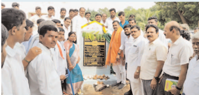
ప్రజా గొంతుకు/ ఆలేరు నియోజకవర్గం ప్రతినిధి/ ఆత్మకూరు

మండలంలో ప్రభుత్వ వివ్ ఆలేరు ఎమ్మెల్యే బీర్ల విలయ్య శుక్రవారం పర్యటించారు. ఈ సందర్భంగా రాయపల్లి గ్రామంలో గౌడ సంఘ భవన నిర్మాణానికి కంకుస్థాపన చేశారు.