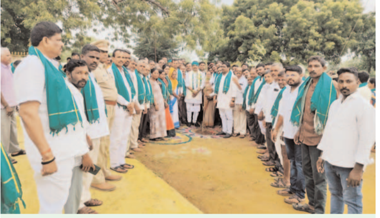
ప్రజా గొంతుక/ ఆలేరు నియోజకవర్గం ప్రతినిధి/ యాదగిరిగుట్ట