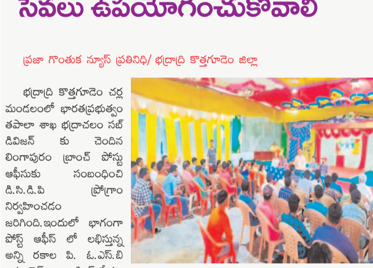
ప్రజా గొంతుక స్టూన్ ప్రతినిధి/ భద్రాద్రి కొత్తగూడెం జిల్లా