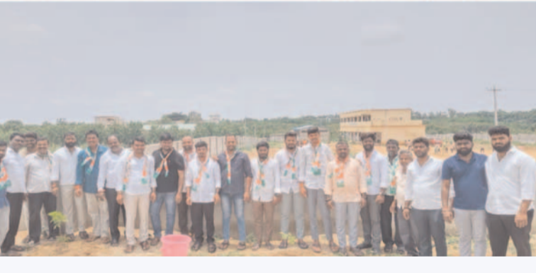
ప్రజా గొంతుక స్టూన్ ఆగస్టు 09

భారతదేశ ఉక్కు మహిళ శ్రీమతి ఇందిరా గాంధీ 09/08/1960 లో కాంగ్రెస్ పార్టీకి అనుబంధ సంస్థగా భారత దేశ జాతీయ యువజన కాంగ్రెస్ ను ఏర్పాటు చేసి నేటికి 64 సంవత్సరాలు పూర్తి అయింది. ఈ కార్యక్రమాన్ని పురస్కరించుకొని నేడు జిన్నారం మండల కాంగ్రెస్ పార్టీ కార్యాలయం లో మండల యువజన కాంగ్రెస్ అధ్యక్షులు యనగండ్ల నరేందర్ అధ్యక్షతన యువజన కాంగ్రెస్ పతాకాన్ని ఆవిష్కరించడం జరిగింది. అనంతరం యువజన కాంగ్రెస్ నాయకులు, కార్యకర్తల కలిసి మొక్కలు నాటడం జరిగింది. అనంతరం స్వీట్లు పంచుకొని శుభాకాంక్షలు తెలియజేసుకోవడం జరిగింది.ఈ కార్యక్రమంలో సీనియర్ కాంగ్రెస్ నాయకులు మరియు యువజన కాంగ్రెస్ నాయకులు కార్యకర్తలు పెద్ద ఎత్తున హాజరై ఈ కార్యక్రమాన్ని విజయవంతం చేయడం జరిగింది