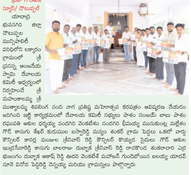
ప్రజా గొంతుక న్యూస్/ చౌటుప్పల్