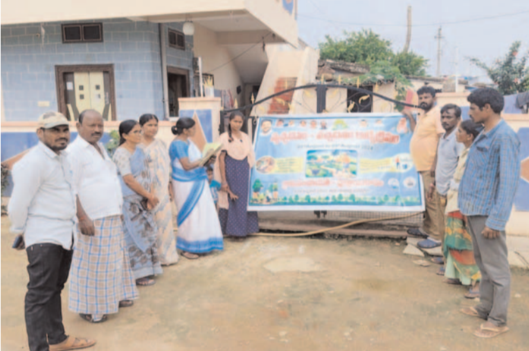
ప్రజా గొంతుక న్యూస్ యాదాద్రి ఆత్మకూర్ (ఎం)