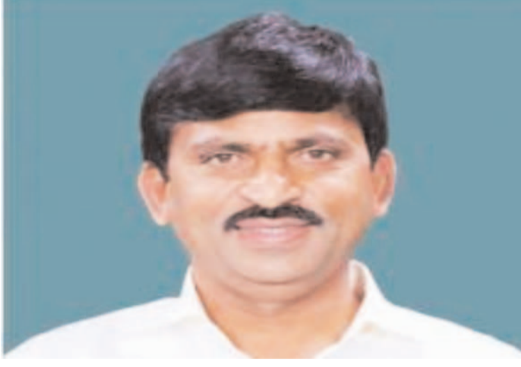
ప్రజా గొంతుకు న్యూస్ ప్రతినిధి/ భద్రాద్రి కొత్తగూడెం జిల్లా

మంత్రి పొంగులేటి శ్రీనివాస్ రెడ్డికి పెను ప్రమాదం తప్పింది. సత్తుపల్లి వెళ్తుండగా వైరా ట్రిడ్డి దగ్గర ఈ ఘటన జరిగింది. మంత్రి పొంగులేటి శ్రీనివాసరెడ్డి ప్రయాణించే వాహనానికి వైరాకు సమీపంలో పంక్తర్ అయింది. హైలెవెల్ వంతెన దిగిన తర్వాత జాతీయ ప్రధాన రహదారిపై పొంగులేటి ప్రయాణిస్తున్న వాహనం వెనుక భాగంలోని ఎడమ ట్రైరు పంక్తర్ కాగా అప్రమత్తమై కారును వెంటనే నిలిపివేశారు. పోలీసులు, భద్రత సిబ్బంది అప్రమత్తం అయ్యారు. మంత్రి పొంగులేటిని మరో వాహనంలో పంపించారు.