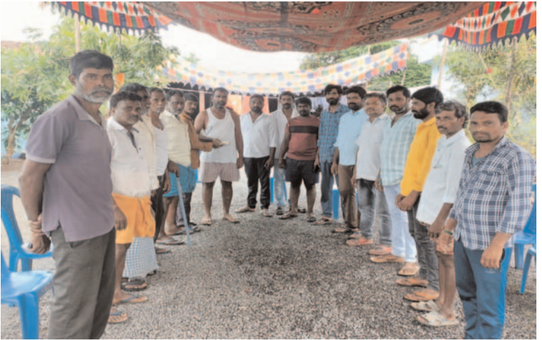
ప్రజా గొంతుకు ప్రతినిధి : శాయంపేట 08/08