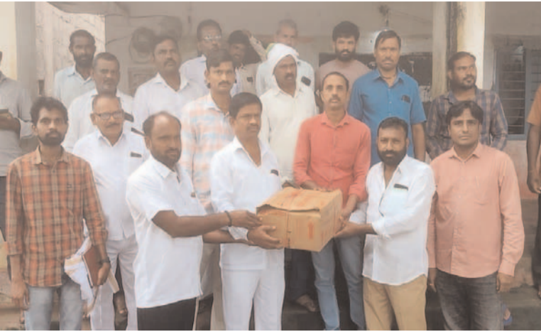
అధ్యక్షులు కావలీ రాజు యాదవ్