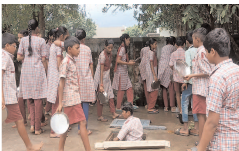
ప్రజా గొంతుకు న్యూస్ ప్రతినిధి/ భద్రాద్రి కొత్తగూడెం జిల్లా