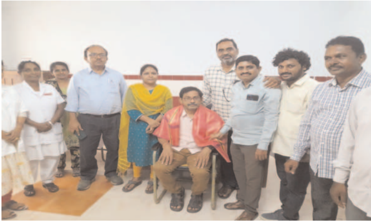
ప్రజా గొంతుక ప్రతినిధి, కోర్టుల్లు