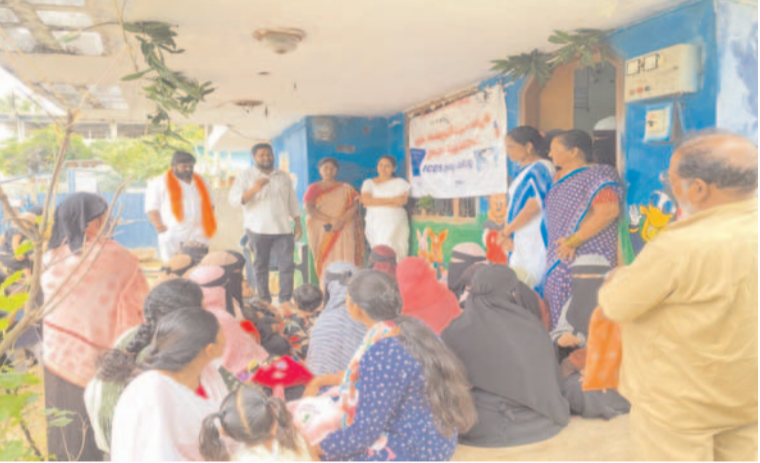
ముగిసిన తల్లిపాల వారోత్సవాల ప్రజా గొంతుకు ప్రతినిధి, కోయల్ల