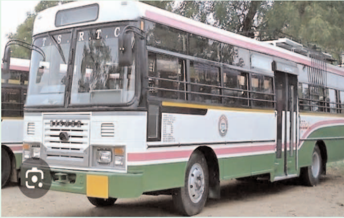
ఉద్యోగ ఒత్తిడిలో ఆర్టీసీ డ్రైవర్లు కండక్టర్లు... ప్రజా గొంతుకు న్యూస్ /మధిర ప్రతినిధి. ఇరుగు పుల్లూరావు