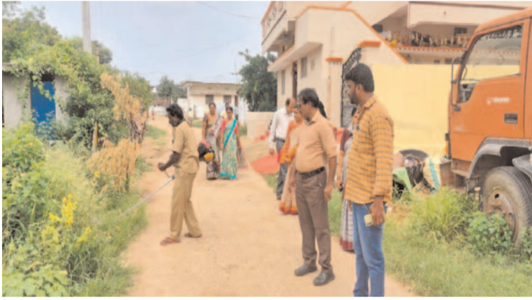
వలిగొండ ఆగస్టు 6 ప్రజా గొంతుకు ప్రతినిధి

వలిగొండ మండల కేంద్రంలో స్వచ్ఛతనం పచ్చదనం కార్యక్రమంలో రెండవ రోజు మండల స్పెషల్ ఆఫీసర్ డిప్యూటీ కలెక్టర్ పిఎన్ జిపి ఎంప్లాయిస్ జడ్పీ హెచ్ఎస్ ఎంపిపిఎస్ హెచ్ఎం వెలర్తుర్ దాక్టర్స్ వి బి కే ఏ ఏ పీ.సి చైర్మన్ పాల్గొనడం జరిగింది