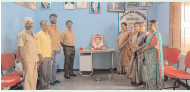
వలిగొండ ఆగస్టు 6 ప్రజా గొంతుకు ప్రతినిధి

వలిగొండ మండల కేంద్రంలోని ఎంపీడీవో కార్యాలయంలో ప్రాఫెసర్ జయశంకర్ జయంతి వేడుకలు ఘనంగా నిర్వహించారు ఈ కార్యక్రమంలో మండల స్పెషల్ ఆఫీసర్ డిప్యూటీ కలెక్టర్ పిఎన్ జిపి ఎంప్లాయిస్ జెడ్పీ హెచ్ఎస్ ఎంపిపిఎస్ వెలర్తుర్ దాక్టర్స్ వి బి కే ఎస్ ఏ పి సి చైర్మన్ పాల్గొనడం జరిగింది