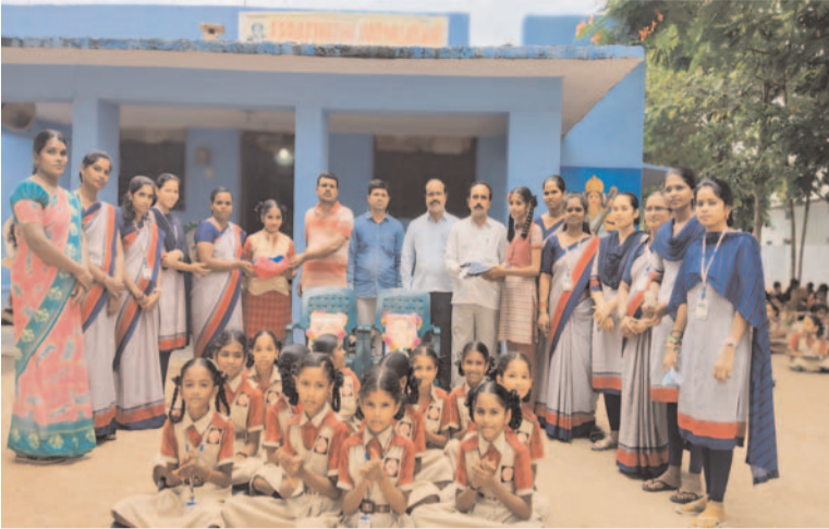
ప్రజా గొంతుక స్వ్యాస్ యాదాద్రి ఆత్మకూర్ ( ఎం)