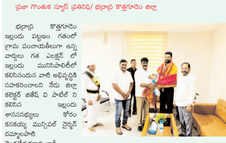
ప్రజా గొంతుక స్వచ్ఛ ప్రతినిధి/ భద్రాద్రి కొత్తగూడెం జిల్లా