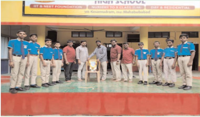
ప్రజా గొంతుకు/ కేసముద్రం/ ఆగస్టు /6