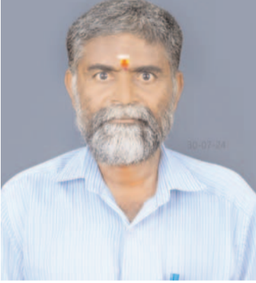
ప్రజా గొంతుకు ఓదెల ప్రతినిధి :