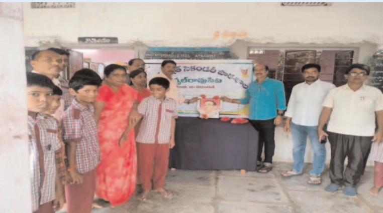
ప్రజా గొంతుక నెకాండ ప్రతినిధి