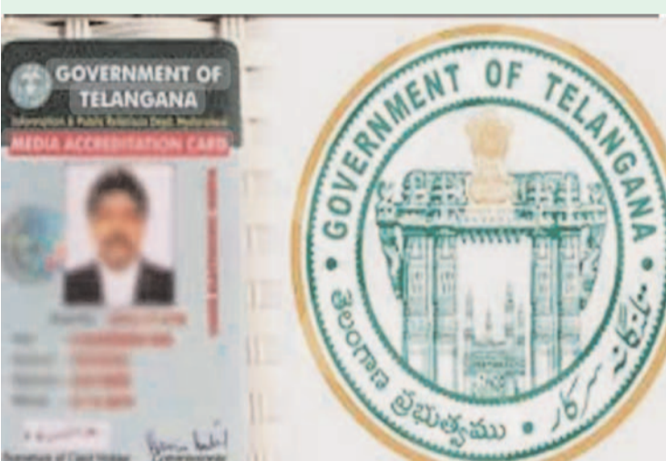
ప్రజా గొంతుకు న్యూస్ ప్రతినిధి/ భద్రాద్రి కొత్తగూడెం జిల్లా