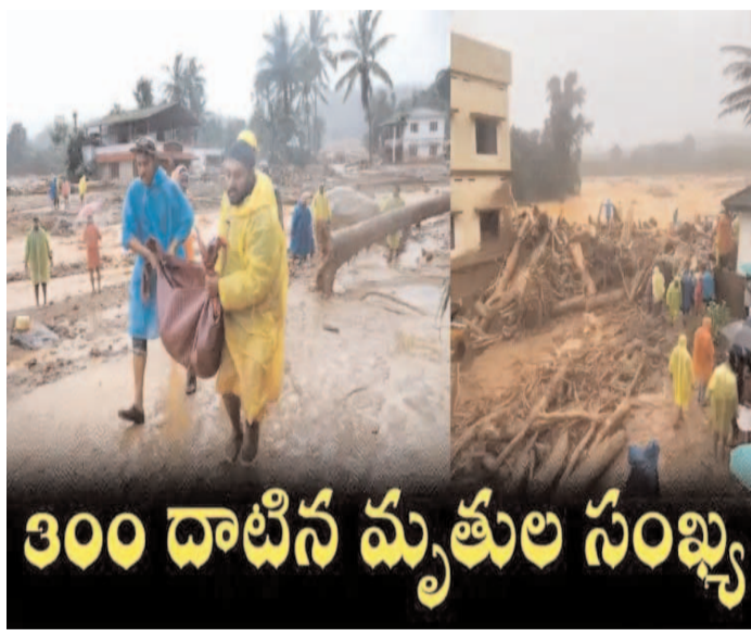
300 దాటిన మృతుల సంఖ్య

కేరళలోని వయనాడ్ ప్రకృతి సృష్టించిన విలయంలో ప్రాణాలు కోల్పోయిన వారి సంఖ్య 300 దాటింది. శిథిలాల కింద చిక్కుకున్న వారి కోసం సహాయక చర్యలు ఇంకా కొనసాగుతున్నావని తెలుస్తోంది. కొండచరియలు విరిగిపడిన ఘటనలో ఇప్పటి వరకు 308 మంది చనిపోయినట్లు అధికారులు నిర్ధారించారు. డ్రోన్ ఆధారిత రాడార్ సాయంతో నాలుగో రోజు కూడా గాలింపు చర్యలు కొనసాగుతున్నాయి. ఈ విలయంలో 200 మందికిపైగా గాయపడ్డారు. భారీ వర్షాలు, ఘటన జరిగిన ప్రాంతానికి సజావుగా వెళ్లే పరిస్థితులు లేకపోవడం, భారీ పరికరాల కొరత వంటివి సహాయక చర్యలను ఆటంక పరుస్తున్నాయి. పేరుకుపోయిన బురద, నేల కూలిన వృక్షాలు, భవనాలను తొలగించడం కష్టంగా మారింది. ఇండియన్ ఆర్మీ ఎన్డిఆర్ఎఫ్, కోస్టగార్డ్, ఇండియన్ నేవీ బృందాలు ప్రభావిత ప్రాంతాల్లో సహాయక చర్యల్లో పాలుపంచుకుంటున్నాయి. ఒక్కో బృందంలో ముగ్గురు స్థానికులు, అటవీశాఖ అధికారి కూడా ఉన్నారు. మొత్తం 40 బృందాలు ఆరు జోన్లుగా విడిపోయి సెర్చ్ ఆపరేషన్లో పాల్గొంటున్నాయి.