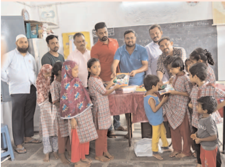
ప్రజా గొంతుక /కేసముద్రం /ఆగస్టు/ 1