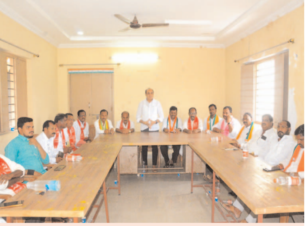
అఖిలపక్ష పార్టీల రౌండ్ టేబుల్ సమావేశం