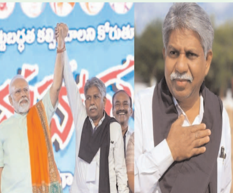
మండ కృష్ణమాదిగ

న్యాయం, ధర్మం కోసం 30 ఏళ్లుగా పోరాటం చేసి విజయం సాధించామని ఎంఆర్పిఎస్ నాయకుడు మండ కృష్ణ మాదిగ సంతోషం వ్యక్తం చేశారు. ఎన్సీ వర్గీకరణ అధికారం రాష్ట్రాలకు ఉందని సుప్రీం కోర్టు తీర్పు ఇచ్చిన సేవల్లో మండ కృష్ణ మాదిగ మీడియాతో మాట్లాడారు. వర్గీకరణ కోసం ఎంఆర్పిఎస్ 30 ఏళ్లుగా పోరాటం చేస్తోందన్నారు. మా జాతికి జరిగిన అన్యాయాన్ని సరిదిద్దేందుకు ఎంఆర్పిఎస్ పోరాటం చేసిందని, 30 ఏళ్ల పోరాటంలో ఎంతోమంది ఎంఆర్పిఎస్ నేతలు ప్రాణాలు కోల్పోయారన్నారు. ఉద్యమంలో ప్రాణాలర్పించిన ఎంఆర్పిఎస్ నేతలకు ఈ విజయం అంకితమని, అనుకూల తీర్పునిచ్చిన జడ్జిలకు ప్రత్యేక ధన్యవాదాలు తెలిపారు. ప్రక్రియ వేగవంతానికి చొరవ తీసుకున్న ప్రధాని సరేంద్ర మోడీకి ధన్యవాదాలు అని చెప్పారు. గతంలో ఉమ్మడి ఎంపిలో ఎన్సీ వర్గీకరణ చేసినది ముఖ్యమంత్రి చంద్రబాబునాయుడేనని, ఎపిలో చంద్రబాబు నాయుడు సిఎంగా ఉండడంతో వర్గీకరణ అమలు జరుగుతోందని, ఎన్సీ వర్గీకరణ చేసిన చంద్రబాబుకు ప్రత్యేక ధన్యవాదాలు తెలిపారు. చంద్రబాబు వర్గీకరణ చేయకపోతే వేలాది ఉద్యోగాలు వచ్చేవి కాదన్నారు. న్యాయం బతికిందంటే ఆ రోజు చంద్రబాబు తీసుకొచ్చిన చట్టం వల్లే అని మండ కృష్ణ మాదిగ చెప్పారు. అధ్యమే తాత్కాలికమైనదని, ధర్మమే గెలుస్తుందని అనాడే చెప్పానని మండ కృష్ణ మాదిగ స్పష్టం చేశారు. ఏనాడైనా ధర్మమే గెలుస్తుందని 2004 నవంబర్ 5న చెప్పానని గుర్తు చేశారు.