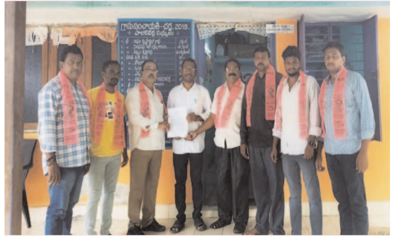
ప్రజా గొంతుకు స్వాస్ ప్రతినిధి/ భద్రాద్రి కొత్తగూడెం జిల్లా