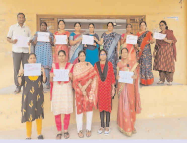
ప్రజా గొంతుక స్టూన్స్/ చౌటుప్ప

యాదాద్రి భువనగిరి జిల్లా చౌటుప్పల్ మున్సిపల్ పరిధిలోని లక్కారం ప్రభుత్వ ఆదర్శ పాఠశాల మరియు కళాశాల ఉపాధ్యాయులు తమ సమస్యలను పరిష్కారించాలని కోరుతూ నల్ల జ్యోతిలు ధరించి నిరసన వ్యక్తం చేశారు గురువారం హైదరాబాద్ ఇందిరాపార్క్ వద్ద తమ సమస్యల కోసం ధర్నా చేస్తున్న తమ ఉపాధ్యాయులకు మద్దతు ప్రకటిస్తూ నిరసన చేపట్టారు. రాష్ట్రవ్యాప్తంగా మోడల్ స్కూల్ ఉపాధ్యాయులు గత 11 సంవత్సరాలూగా ఒకే చోట పని చేస్తూ కుటుంబాలకు దూరంగా బదిలీలు లేక అవస్థలు పడుతున్నారని తమకు వెంటనే బదిలీలు పదోవృత్తులు చేపట్టాలని %శీర్షికీ% పద్దు ద్వారా వేతనాలు ఇవ్వాలని హెల్త్ కార్యులు జారీ చేయాలని ఖాళీగా ఉన్న ఓపీడీ టీజీటీ పోస్టులను భర్తీ చేయాలని రాష్ట్ర ప్రభుత్వాన్ని డిమాండ్ చేశారు నిరసన కార్యక్రమం లో ప్రిన్సిపల్ మరియు పిజిటి టీజీటీ ఉపాధ్యాయ బృందం పాల్గొన్నారు