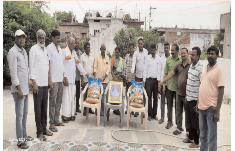
ప్రజాగొంతుకు స్వాస్ / భీమాదేవరపల్లి