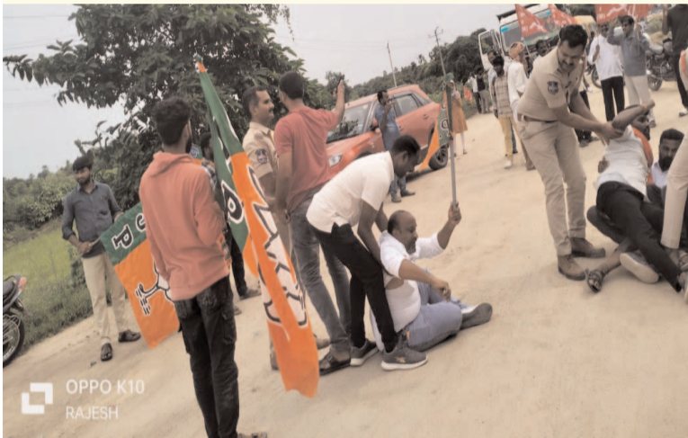
ప్రజా గొంతుక స్వాగ్/జనగామ రూరల్: