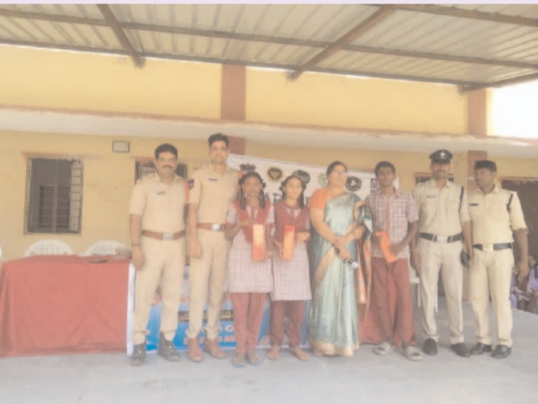
ప్రజాగొంతుక స్టూన్ గుర్రంపాడు