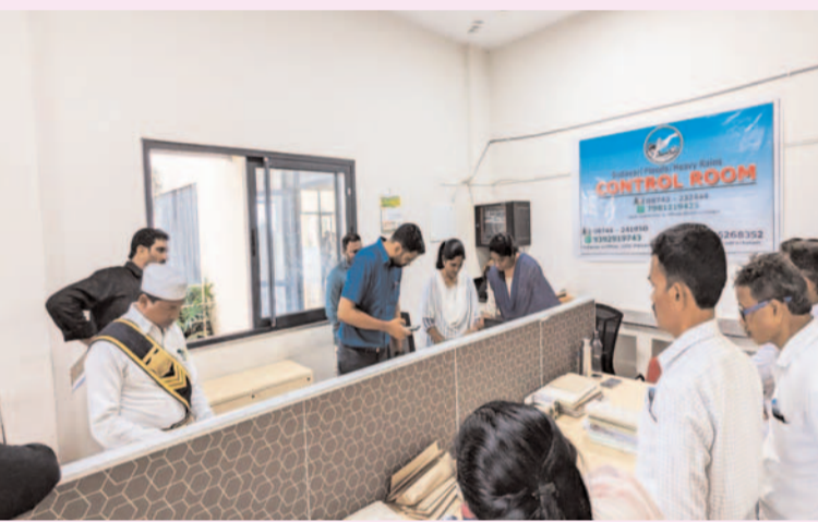
ప్రజా గొంతుక స్టూన్ ప్రతినిధి/ భద్రాద్రి కొత్తగూడెం జిల్లా