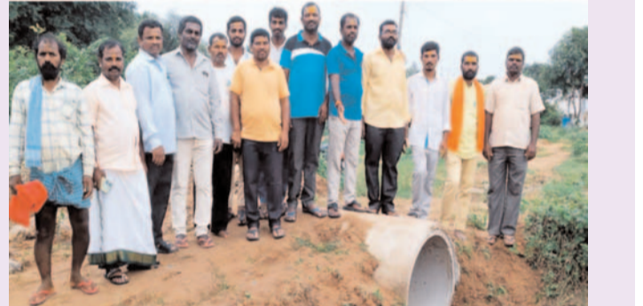
ప్రజా గొంతుకు న్యూస్ జులై 31