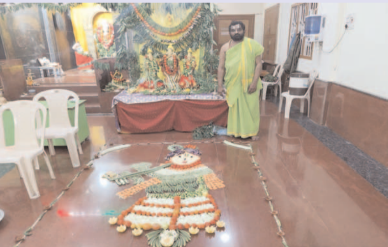
ప్రజా గొంతుకు న్యూస్ / జమ్మికుంట టౌన్:

జమ్మికుంట పట్టణంలోని గీతా మందిర్ లో ఘనంగా శాకాంబరీ ఉత్సవం స్థానిక భగవద్దీతా జ్ఞాన మందిర్ లో బుధవారం రోజున సత్కృతము మరియు ఏకాదశి సందర్భంగా ప్రత్యేక పూజ కార్యక్రమాలు చేపట్టారు. ఈ కార్యక్రమంలో భాగంగా శ్రీ రుక్మిణి సత్యభామ సమేత శ్రీ వేణోపాలస్వామి వారి శాకాంబరీ ఉత్సవం ఆలయ అర్చకులు వేదపండితులు మరియు సంఖ్య ఆచార్య అధ్యక్షులతో ఆత్మీయత వైభవంగా జరిగింది. ఆలయ కమిటీ చారు కార్యక్రమంలో పాల్గొన్న వారికి అల్పాహార వితరణ చేయడం జరిగింది.