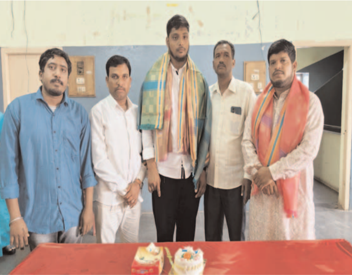
ప్రజా గొంతుక స్టూన్ యాదాద్రి ఆత్మకూర్ (ఎం)