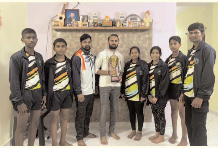
సౌత్ స్కూల్ కబడ్డీ ఛాంపియన్ షిప్-2024 క్రైమం ప్రజా గొంతుక కుత్బుల్లాపూర్