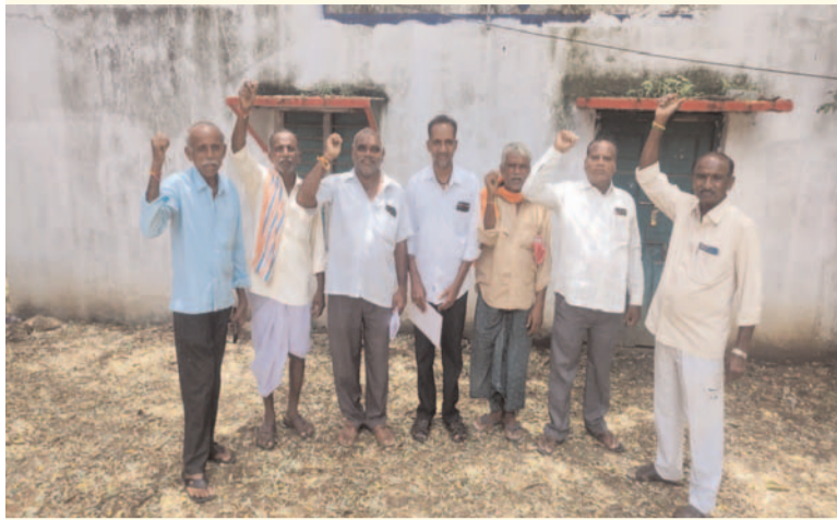
ప్రజా గొంతుక నెక్సాండ్ ప్రతినిధి