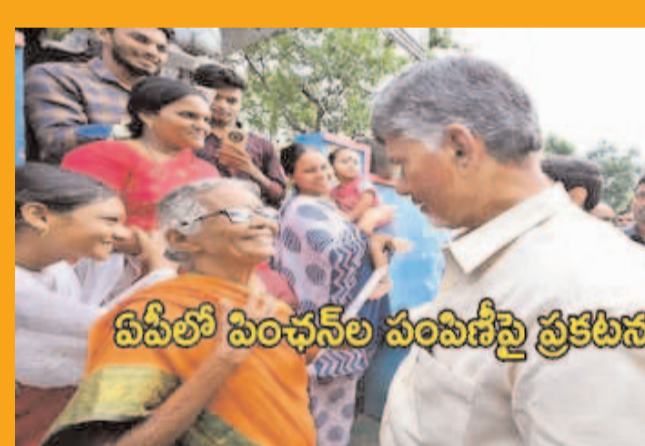
ఏపీలో పింఛన్ల పంపిణీపై ప్రకటన