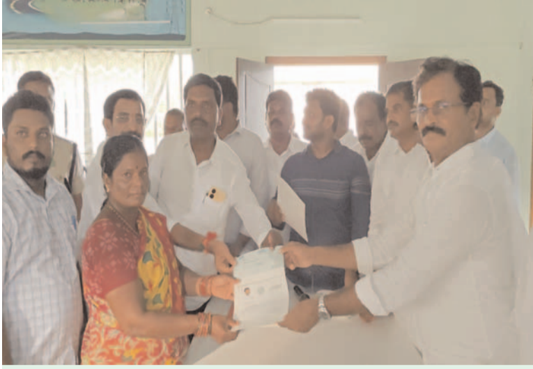
వలిగొండ జూలై 28 ప్రజా గొంతుక ప్రతినిధి