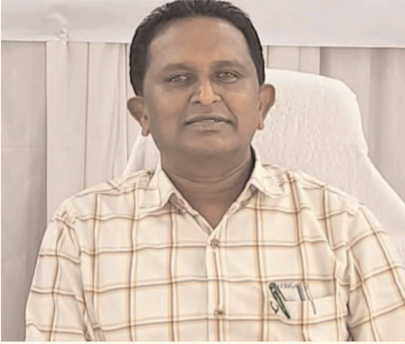
అలాగే ఒక పనికి సంబంధించిన మెటీరియల్ ఏమైనా మిగిలి ఉంటే వేరే పనికి పేపర్ ట్రాన్సాక్షన్ ద్వారా మార్చుకొనే వెసులుబాటు మొత్తం కూడా ఆన్ లైన్ లోనే చేశామని తెలిపారు,ఈ పద్ధతి వలన కూడా ఎంతగానో సమయం ఆదా అవుతుందని వివరించారు సాంకేతిక విధానాన్ని అందిస్తున్నట్లుగా వినయోగదారులకు మెరుగైన , నాణ్యమైన విద్యుత్ సరఫరా 24 గంటల అందిస్తున్నామని ఎస్ఈ ఒక ప్రకటనలో తెలిపారు.