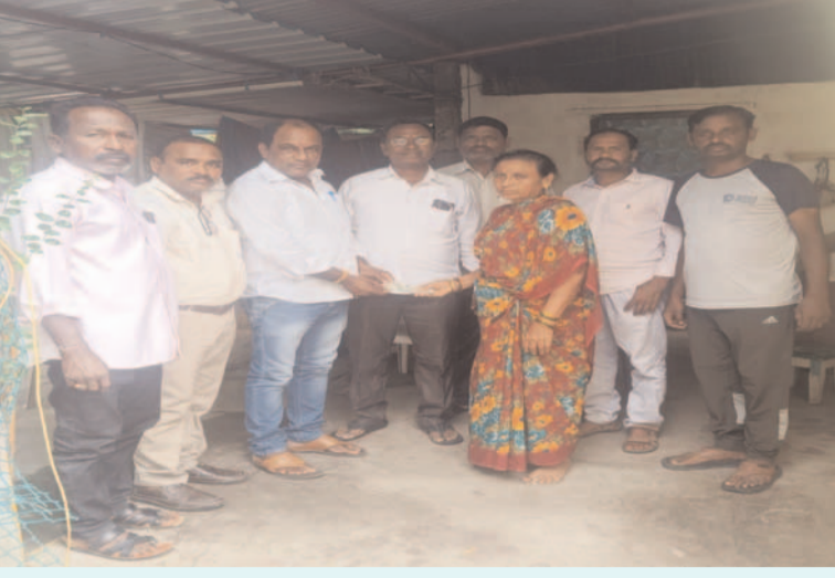
ప్రజాగొంతుక స్వ్యాస్/జమ్మికుంట టౌన్