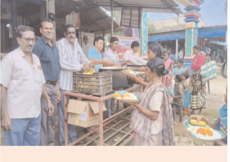
ప్రజా గొంతుకు న్యూస్ ప్రతినిధి/ భద్రాద్రి కొత్తగూడెం జిల్లా