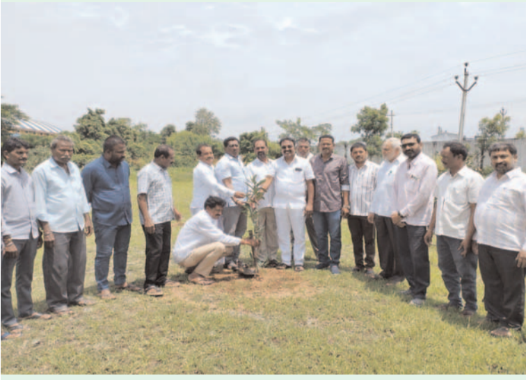
ప్రజా గొంతుక స్వ్యాస్ / జమ్మికుంట టౌన్: