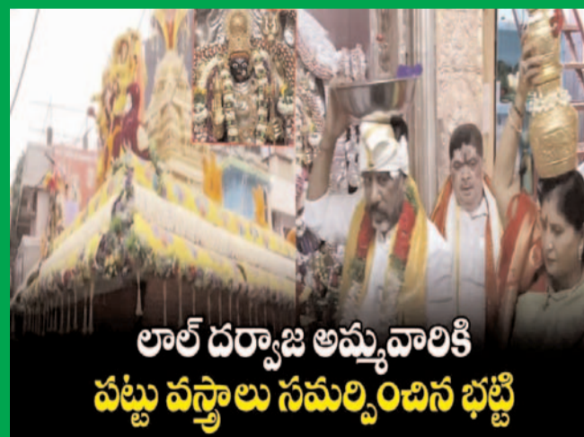
లాల్ దర్వాజా అమ్మవారికి పట్టు వస్త్రాలు సమర్పించిన భద్రీ

హైదరాబాద్ పాతబస్టిలో లాల్ దర్వాజా బోనాల పండుగ ఘనంగా జరుగుతోంది. ఉదయం నుంచి అమ్మవారిని దర్శించుకుంటున్నారు భక్తులు. అమ్మవారికి ప్రభుత్వం తరఫున డిప్యూటీ సీఎం భద్రీ విక్రమార్క పట్టు వస్త్రాలు సమర్పించారు. అమ్మవారికి ప్రత్యేక పూజలు చేశారు ఈ సందర్భంగా మాట్లాడిన ఆయన.. ప్రజా ప్రభుత్వంలో మొదటి బోనాల పండుగ అని అన్నారు. అమ్మ వారికి ప్రభుత్వం తరఫున పట్టు వస్త్రాలు సమర్పించడం సంతోషంగా ఉందన్నారు. పాత బస్టి ప్రజలను మహాంకాళి అమ్మవారు నిరంతరం కాపాడుతోందన్నారు. బోనాలకు ఎటువంటి ఇబ్బందులు కలగకుండా సీఎం ఆదేశాలతో అన్ని దేవాలయాలలో పూర్తి ఏర్పాట్లు చేశామని చెప్పారు. భద్రీలో హైదరాబాద్ అభివృద్ధికి 10 వేల కోట్లు కేటాయించామని చెప్పారు భద్రీ. నకల సౌకర్యాలకు హైదరాబాద్ కేంద్ర కావడంతో ఇతర ప్రాంతాల వాళ్లు నివాసం ఉంటున్నారని తెలిపారు. శాంతి భద్రతల పరంగా ఏ మాత్రం వెనకడుగు వేయకుండా ప్రస్తుత తెలంగాణ ప్రభుత్వం అన్ని రకాల చర్యలు తీసుకుంటుందని చెప్పారు. ఆలయ కమిటీ.. ఇతర ప్రభుత్వ శాఖల కృషితో లాల్ దర్వాజా బోనాల పండుగ ఘనంగా జరుగుతోందన్నారు భద్రీ