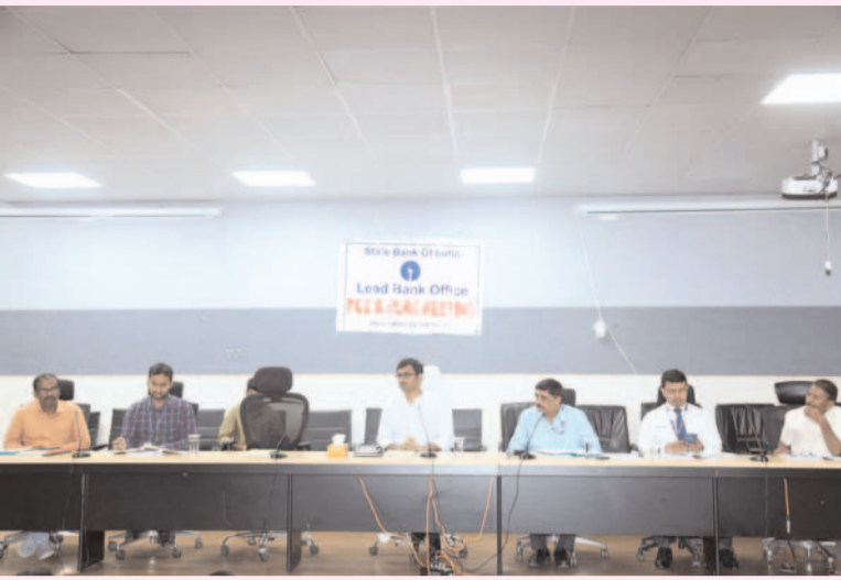
ప్రజా గొంతుక న్యూస్/సల్తానాబాద్