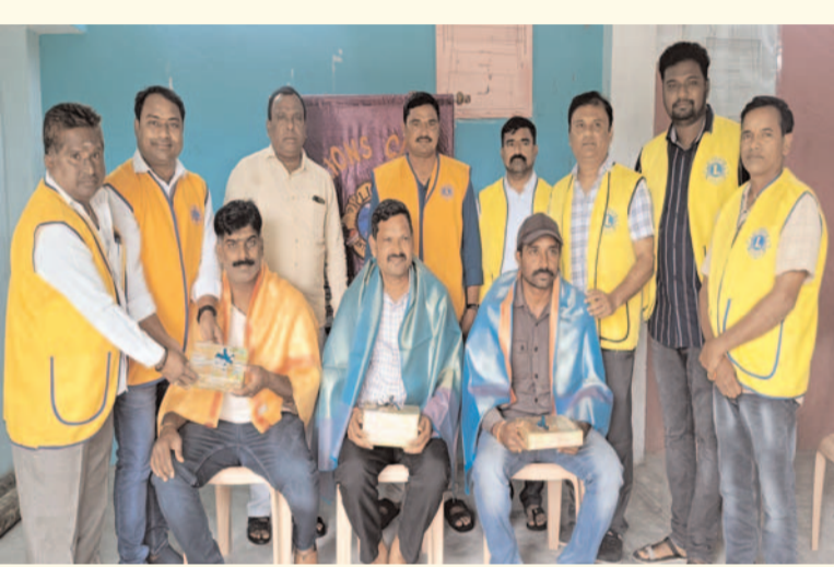
ప్రజా గొంతుక న్యూస్/సల్తానాబాద్