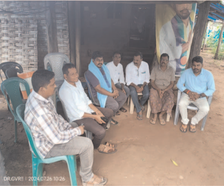
ప్రజా గొంతుక జూలై 26 అశ్వనాష్టమి నియోజకవర్గ ప్రతినిధి