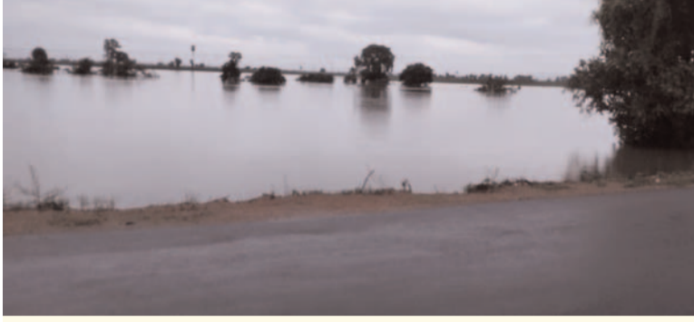
ప్రజా గొంతుక న్యూస్ ప్రతినిధి //వెంకటాపురం ప్రతినిధి జులై 21:

వెంకటాపురం మండలంలో గత మూడు రోజులుగా కురుస్తున్న వర్షానికి వాగులు వంకలు పొంగిపొర్లుతున్నాయి. పాలెం వాగు ప్రాజెక్టు దిగువ ప్రాంతంలో వర్షం నీరు అధికంగా చేరడంతో క్రింది గ్రామాల్లో ప్రజలు ఆందోళన చెందుతున్నారు. వెంకటాపురం మండలం పరిధిలోని పాతపురం గ్రామం సమీపంలో ఉన్న బిల్లకట్టు వాగు ఉదృతంగా ప్రవహించడంతో దగ్గరలో ఉన్న నివాస ప్రజలు ఏ క్షణంలో ఏమి జరుగునోనని భయభ్రాంతులకు గురౌతున్నారు. గత సంవత్సరం కూడా వరద ముంపు కు ప్రజలు అనేక ఇబ్బందులకు గురైనట్లువంటి పరిస్థితులు ఉన్నాయి. ముందస్తు చర్యలను చేపట్టాలని అధికారులను ప్రజలు కోరుతున్నారు.