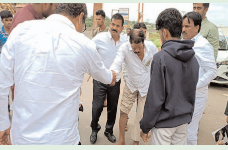
ప్రజా గొంతుక//ప్రతినిధి//మహేశ్వరం//జూలై 21 (చిక్కిరి శ్రీకాంత్)

మహేశ్వరం నియోజకవర్గంలో అమీర్లీట్ గ్రామ కార్యక్రమానికి వెళుతుండగా మహేశ్వరం గ్రామ కేంద్రంలో మోటార్ బైక్ వేసుకొని వెళ్తున్న అయి కిందపడిన అతన్ని కేఎల్ఆర్ కారు దిగి అతని పరామర్శించి స్థానిక హాస్పిటల్ కి తరలించాలని కాంగ్రెస్ పార్టీ కార్యకర్తలకు చెప్పి కార్ ఇచ్చి హాస్పిటల్ కి పంపించారుమరోసారి కేఎల్ఆర్ మానవతా దృక్పథాన్ని చూపించారు.