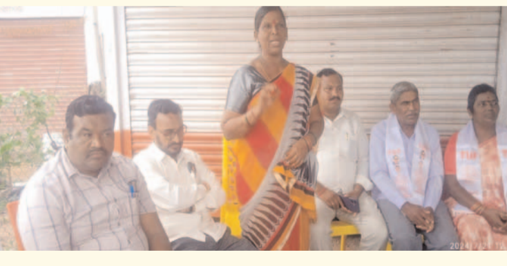
అసెంబ్లీలో ప్రకటన చేయాలి పలిగొంద జూలై 21 ప్రజా గొంతుక ప్రతినిధి.