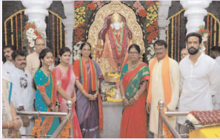
ప్రజా గొంతుక//ప్రతినిధి//మహేశ్వరం//జులై 21