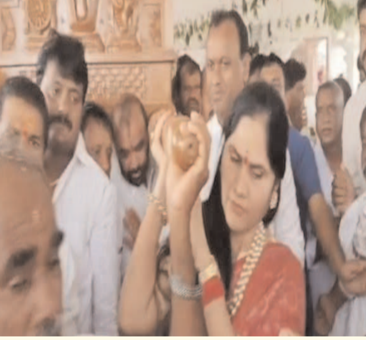
ప్రజా గొంతుకు స్వ్యాస్/ చౌటుప్పల్