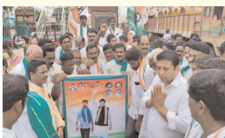
రుణ మాఫీ చరిత్రాత్మక నిర్ణయం రైతు వక్షపాతి దుద్దిల్ల శ్రీధర్ బాలు ప్రజా గొంతుక న్యూస్/మంధని/జూలై 18