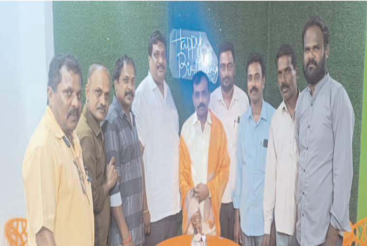
పిఎస్ఎస్ చైర్మన్ ఆధ్వర్యంలో