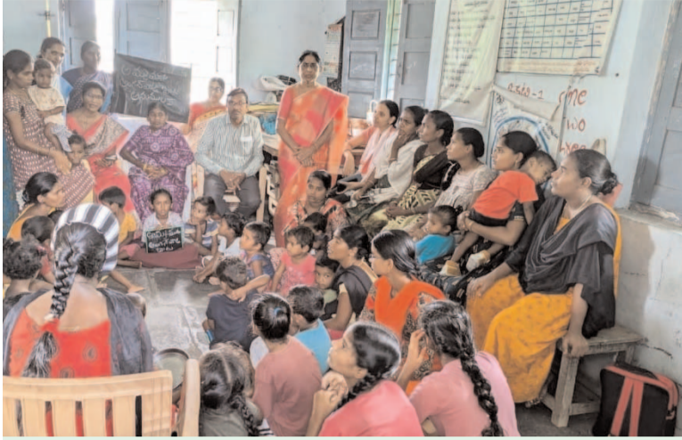
ప్రజా గొంతుకు స్వ్యాస్ ప్రతినిధి/ షేక్ షాకిర్// హోయియా//