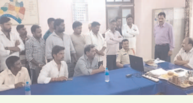
ప్రజా గొంతుకు స్వ్యాస్/ సుల్తానాబాద్

రాత్రి వేళలో అక్రమంగా ఇసుక రవాణా చేస్తే ఇసుక ట్రాక్టర్లను సీజ్ చేస్తామని సుల్తానాబాద్ ఠానిల్డార్ మధుసూదన్ రెడ్డి అన్నారు . సుల్తానాబాద్ ఠానిల్డార్ కార్యాలయంలో మండలంలో ఉన్న ఇసుక రవాణా చేసే ట్రాక్టర్ ల యజమానులతో సమావేశం నిర్వహించారు. సుల్తానాబాద్ ఠానిల్డార్ మధుసూదన్ రెడ్డి మీడియాతో మాట్లాడుతూ, మానేరు పరిసరాల ప్రాంతం నుండి వివిధ గ్రామాలకు అవసరాల నిమిత్తం ట్రాక్టర్ల ద్వారానిరంతరం ఇసుక రవాణా చేయవద్దని, ఉదయం ఆరు నుండి, సాయంత్రం 6 గంటల వరకు మాత్రమే రవాణా చేయాలని, తరువాత రవాణా చేసే ట్రాక్టర్ల పై భారీ జరిమానా విధిస్తూ, ట్రాక్టర్లను సీజ్ చేస్తామని ఠానిల్డార్ మధుసూదన్ రెడ్డి అన్నారు. రెవెన్యూ, పోలీస్, మైనింగ్ మూడు శాఖల సమన్వయంతో ప్రత్యేక నిఘా ఏర్పాటు చేయడం జరుగుతుందని తెలిపారు. ఈ కార్యక్రమంలో ఎస్ ఐ శ్రావణ్ కుమార్ పాల్గొన్నారు.