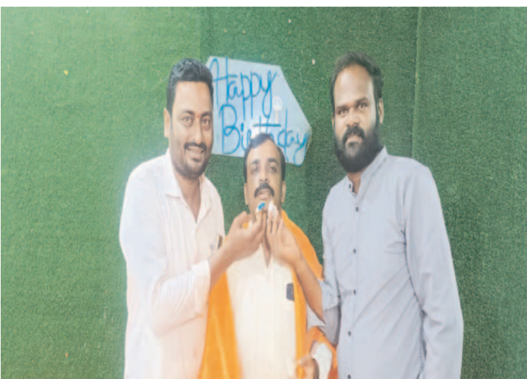
ప్రెస్ క్లబ్ అధ్యక్షుడి ఆధ్వర్యంలో