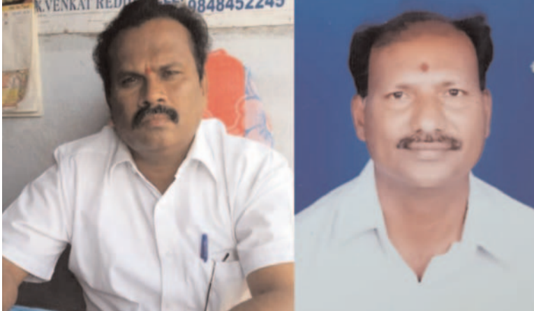
ప్రజా గొంతుకు స్వ్యాస్/ చౌటుప్పల్