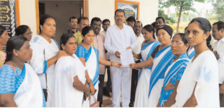
ప్రజా గొంతుకు స్వ్యాస్ ప్రతినిధి/ భద్రాద్రి కొత్తగూడెం జిల్లా