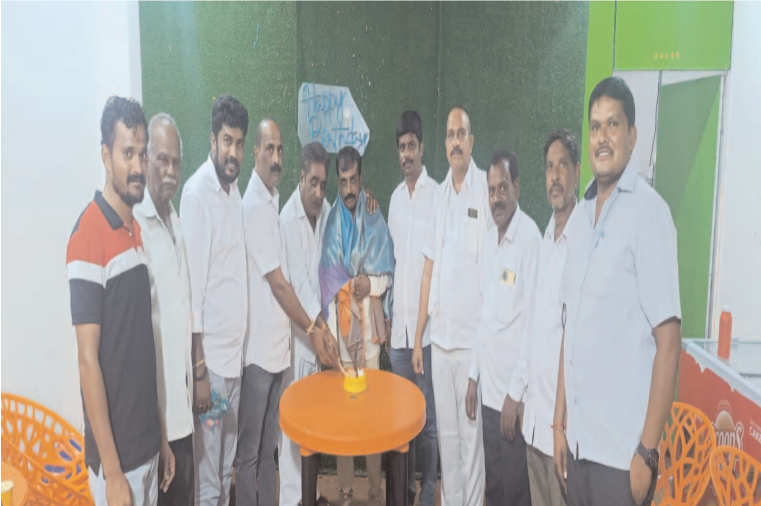
కాంగ్రెస్ పార్టీ నాయకుల ఆధ్వర్యంలో