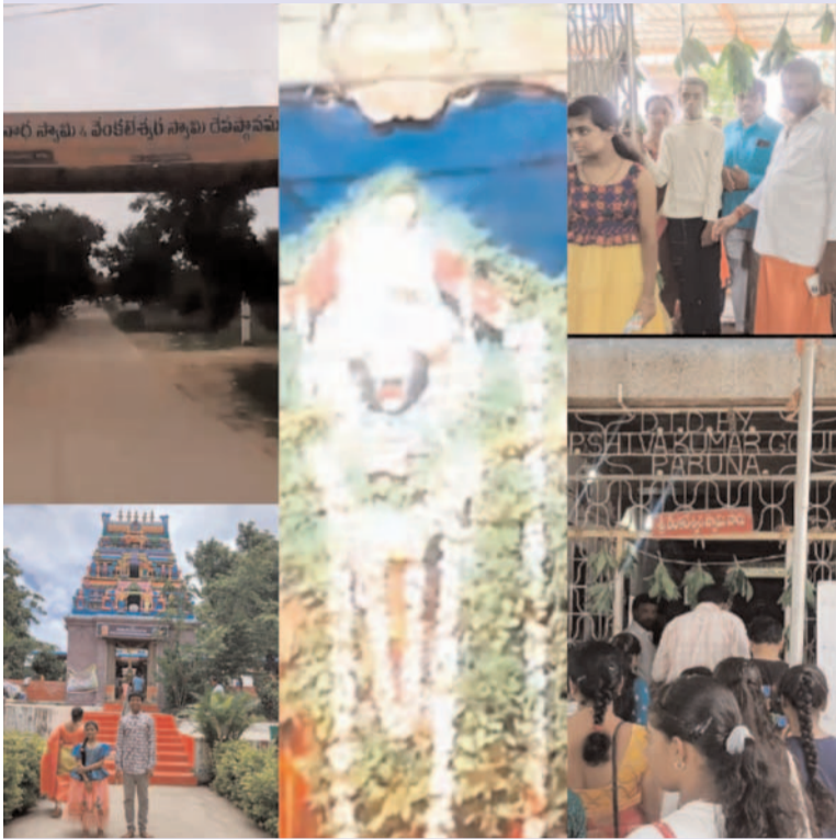
ప్రజాగొంతుక న్యూస్ ఘట్టేశ్వర్.

మేధుల్ జిల్లా, ఘట్టేశ్వర్ మండలం సమీపంలో ఉన్న శ్రీ రంగనాథ వెంకటేశ్వర స్వామి ఆలయంలో తొలి ఏకాదశి పూజలు ఘనంగా నిర్వహించారు, తొలి ఏకాదశి విశేషత చెప్పుకోవాలంటే పండగల్లో తొలి ఏకాదశికి ప్రత్యేక స్థానం ఉంటుంది. ఆషాఢ మాసంలో పౌర్ణమి ముందు వచ్చే ఏకాదశిరోజు మహా విష్ణువు యోగ నిద్రలోకి వెళతాడు. విష్ణువు నిద్రకు ఉపక్రమించే రోజు కాబట్టి దీనిని శయన ఏకాదశి అంటారు. అందుకే ఈ రోజంతా ఉపవాస నియమాలు పాటించి జాగరణ చేస్తారు. అనంతరం మహా విష్ణువు ధ్యానంలో ఉండి దానాది రోజున దాన, ధర్మాలు చేసి ఉపవాస దీక్ష విరమించాలి. తొలి ఏకాదశి రోజు పాటించే నియమాలు వల్ల పాపాలు తొలగిపోతాయని భక్తుల నమ్మకం. ఈ నేపథ్యంలో ఘట్టేశ్వర్ మండలం సమీపంలోని శ్రీ రంగనాథ వెంకటేశ్వర స్వామి దేవస్థానంలో ఆషాఢ మాసం తొలి ఏకాదశి సందర్భంగా భక్తుల రద్దీ నెలకొంది, భక్తులు ఘనంగా పూజలు నిర్వహించి మొక్కులు చెల్లించుకున్నారు. చుట్టుప్రక్కల నుంచి వచ్చిన భక్తులతో కిక్కిరిసి పోయింది, ట్రాఫిక్ నియంత్రణలో భాగంగా ఘట్టేశ్వర్ పోలీసులు భక్తులకు ఎటువంటి ఇబ్బందులు కలగకుండా మాజీ ఉపసర్పంచ్ శ్రీశైలం అలాగే ఎక్స్ ఎంపీటీసీ శ్రీశైలం ముందు జాగ్రత్తగా చర్యలు చేపట్టారు. ఈ యొక్క తొలి ఏకాదశి పూజలో గుడి పూజారులు, భక్తులు పాల్గొన్నారు.