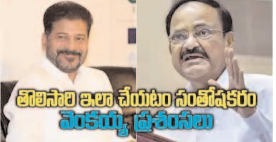
తొలిసారి ఇలా చేయటం సంతోషకరం వెంకయ్య ప్రశంసలు

మాజీ ఉపరాష్ట్రపతి వెంకయ్య నాయుడు తెలంగాణ ప్రభుత్వం, సీఎం రేవంత్ రెడ్డిని మెచ్చుకున్నారు. రైతు రుణమాఫీ మార్గదర్శకాలకు సంబంధించిన ప్రభుత్వ ఉత్తర్వులను స్వచ్ఛమైన తెలుగులో జారీ చేయడం పట్ల వెంకయ్య నాయుడు హార్షం వ్యక్తం చేస్తూ.. ఎక్స్ వేదికగా అభినందనలు తెలియజేశారు. మాజీ ఉప రాష్ట్రపతి పోస్ట్ పై స్పందించిన రేవంత్ రెడ్డి వెంకయ్య నాయుడుకి హృదయపూర్వక ధన్యవాదాలు తెలిపారు. ప్రభుత్వ ఉత్తర్వులు తొలిసారి తెలుగులో జారీ చేయడం చాలాసంతోషకరం. తెలుగు రాష్ట్రాల్లో ప్రభుత్వ ఉత్తర్వులు సహాపరిపాలనకు సంబంధించిన అంశాలు తెలుగులో జారీచేయాలని నేను ఎప్పటినుంచో నూచిస్తూనే ఉన్నాను. తెలంగాణ ప్రభుత్వం తొలిసారి తెలుగులో, అందులోనూ రైతుల రుణమాఫీ మార్గదర్శకాలపై తెలుగులో ఉత్తర్వులు జారీ చేయడం అభినందనీయం. ప్రజల కోసమే పరిపాలన అయినప్పుడువారికి సులువుగా అర్థమయ్యే భాషలోనే ప్రభుత్వ ఉత్తర్వులు, పరిపాలనకు సంబంధించి ఇతర సమాచారం ఉండాలని నేను ఎప్పటినుంచో చెబుతున్నాను. ప్రజల సౌలభ్యానికీ ప్రాధాన్యమిస్తూ తెలుగులో ఉత్తర్వులు జారీ చేసినందుకు తెలంగాణ ప్రభుత్వానికి, తెలంగాణ రాష్ట్ర ముఖ్యమంత్రి శ్రీరేవంత్ రెడ్డి కి, ప్రత్యేక కృతజ్ఞతలు తెలియజేశారు.