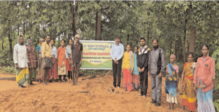
ప్రజా గొంతుగా జూలై 17 అశ్వరావుపేట నియోజకవర్గం ప్రతినిధి