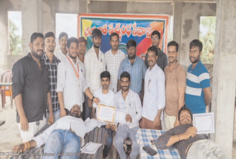
ప్రజా గొంతుక స్యూస్ ప్రతినిధి/వెంకటాచారం%జెఫ్ఎం 17-07-2024 జన్మదిన సందర్భంగా రక్తదాన శిబిరం