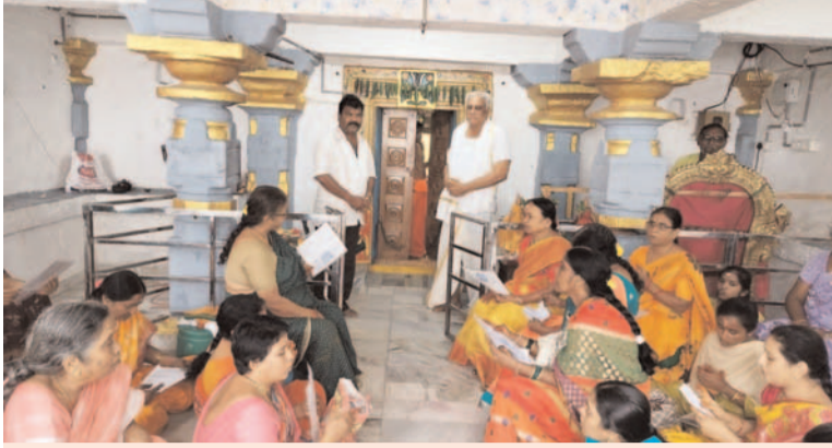
ప్రజా గొంతుకు న్యూస్/సుల్తానాబాద్