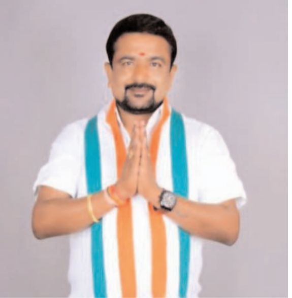
రైతును రాజు చేయడమే కాంగ్రెస్ ప్రభుత్వ లక్ష్యం.!