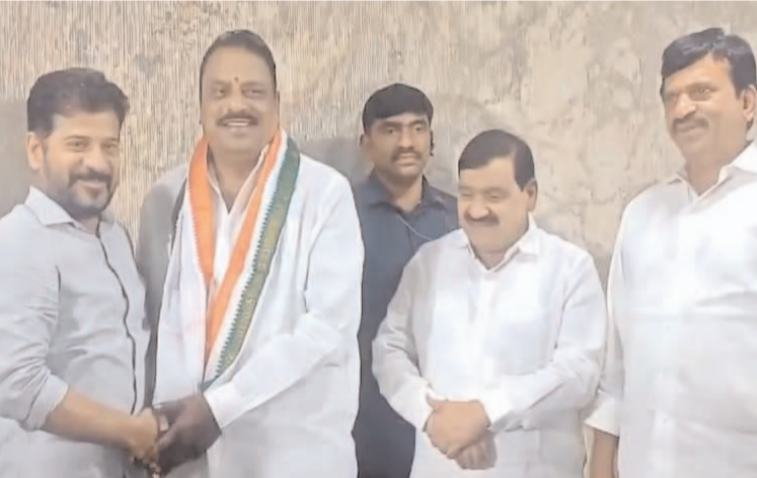
ప్రజా గొంతుక న్యూస్ డెస్క్:

తెలంగాణలో కాంగ్రెస్ ఆపరేషన్ ఆకర్షణ భాగంగా మరో బీఆర్ఎస్ ఎమ్మెల్యే ప్రకాశ్ గౌడ్ కాంగ్రెస్ గూటికి చేరారు. సీఎం రేవంత్ సమక్షంలో రాజేంద్రనగర్ ఎమ్మెల్యే హస్తం పార్టీలో చేరిపోయారు. దీంతో, కాంగ్రెస్ లో చేరిన బీఆర్ఎస్ ఎమ్మెల్యే సంఖ్య ఎనిమిదికి చేరింది.. రాజేంద్రనగర్ బీఆర్ఎస్ ఎమ్మెల్యే ప్రకాశ్ గౌడ్ కాంగ్రెస్ పార్టీలో చేరారు. ఆయనకు పార్టీ కండువా కప్పి కాంగ్రెస్ ఇంఛార్జ్ దీపాదాస్ మున్నీ హస్తం పార్టీలోకి ఆహ్వానించారు. ఇక, తాజాగా ప్రకాశ్ గౌడ్ చేరికతో బీఆర్ఎస్ నుంచి కాంగ్రెస్ లోకి చేరిన వారి సంఖ్య ఎనిమిదికి చేరుకుంది. మరోవైపు.. రేపు మరో బీఆర్ఎస్ ఎమ్మెల్యే కాంగ్రెస్ లో చేరుతున్నట్లు తెలుస్తోంది. ఇదిలా ఉండగా.. ఇంకా పలువురు ఎమ్మెల్యేలు కాంగ్రెస్ లో చేరుతారని హస్తం నేతలు చెబుతున్నారు.