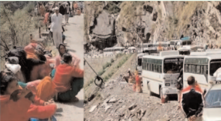
ప్రజా గొంతుక న్యూస్ డెస్క్:

బద్రినాథ్ హైవేని వరుసగా మూడో రోజు మూసి వేయడంతో రాక పోకలకు అంతరాయం ఏర్పడింది. దాదాపు 3,000 మంది యాత్రికులు, ప్రయాణికులు అక్కడే చిక్కుకుపోయారు. జోషిపూర్ వద్ద కొండచరియలు విరిగి పడడంతో రహదారిని మూసివేశారు. మరో 24 గంటల పాటు రోడ్డును బ్లాక్ చేయనున్నట్లు సమాచారం. ప్రయాణికులను ఎన్ డి ఆర్ ఎఫ్, ఎన్ డి ఆర్ ఎఫ్ బృందాల సహాయంతో సురక్షితంగా తరలిస్తున్నామని, ఆహారం, నీరు అందిస్తున్నట్లు అధికారులు తెలిపారు.