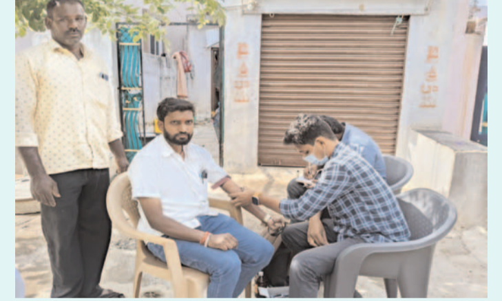
ప్రజా గొంతుక // ప్రతినిధి // మహేశ్వరం // జూలై 12 (చిక్కిరి శ్రీకాంత్)

రంగారెడ్డి జిల్లా మహేశ్వరం నియోజకవర్గం పెద్దపల్లి నాగారం గ్రామంలో లేబర్ ఐడీ కార్డు ఉన్నవాళ్ళందరికీ లేబర్ ఆఫీస్ నుంచి వచ్చి స్వయంగా ఇంటింటికి తిరిగి వైద్య పరీక్షలు నిర్వహించడం జరిగింది లేబర్ ఐడీ కార్డులు ఉన్నవాళ్ళు ఈ కార్యక్రమంలో పెద్ద సంఖ్యలో పాల్గొన్నారు గ్రామ ప్రజలకు ముఖ్య విజ్ఞప్తి... లేబర్ పని చేసే వ్యక్తులందరూ కూడా ప్రతి ఒక్కరూ లేబర్ ఐడీ కార్డు తీసుకున్నట్లు తప్ప దానివల్ల చాలా ప్రయోజనాలు కలిగి ఉంటాయి అని తెలియజేయడం జరిగింది