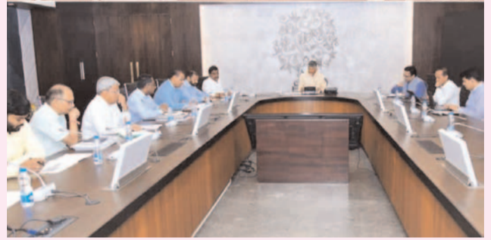
అధికారులను ఆదేశించిన సీఎం చంద్రబాబు ప్రజా గొంతుక న్యూస్ డెస్క్:

సచివాలయంలో ఆర్ఆండ్ బీ శాఖపై ముఖ్యమంత్రి చంద్రబాబు సమీక్ష నిర్వహించారు. ఈ సమీక్షలో రోడ్ల దుస్థితి, నిధుల అవసరం, ప్రస్తుతం ఉన్న సమస్యలపై సీఎంకు అధికారులు వివరించారు. రాష్ట్రంలో 4,151 కిలోమీటర్ల మేర రోడ్లపై గుంతలు ఉన్నాయని, తక్షణమే మరమ్మతులు చేయాల్సిన రోడ్లు మరో 2,936 కిలోమీటర్లు మేర ఉన్నాయని వివరించారు. మొత్తంగా రాష్ట్రంలో 7,087 కిలోమీటర్ల పరిధిలో తక్షణం పనులు చేపట్టాల్సిన అవసరం ఉందని, వీటి కోసం కనీసం రూ.300 కోట్ల నిధులు అవసరం అని తెలిపారు. గుంతలు పూడ్చి పనులు వెంటనే చేపట్టాలని అధికారులను సీఎం ఆదేశించారు. అత్యవసరంగా బాగు చేయాల్సిన రోడ్లపై దృష్టిపెట్టాలని సీఎం సూచించారు. రోడ్ల మరమ్మతులు, నిర్మాణంలో కొత్త, మెరుగైన సాంకేతికతను వినియోగించే విషయంపై తిరుపతి ఐబి, ఎన్ఆర్ఎం యూనివర్సిటీలకు చెందిన ప్రొఫెసర్లు, ప్రభుత్వ అధికారులు, నిర్మాణ రంగ నిపుణులతో చర్చించారు. ఆర్ ఆండ్ బీ మంత్రి బీసీ జనార్ధన్ రెడ్డి, ఆ శాఖ అధికారులు, నిర్మాణ రంగ నిపుణులు సమీక్షలో పాల్గొన్నారు.