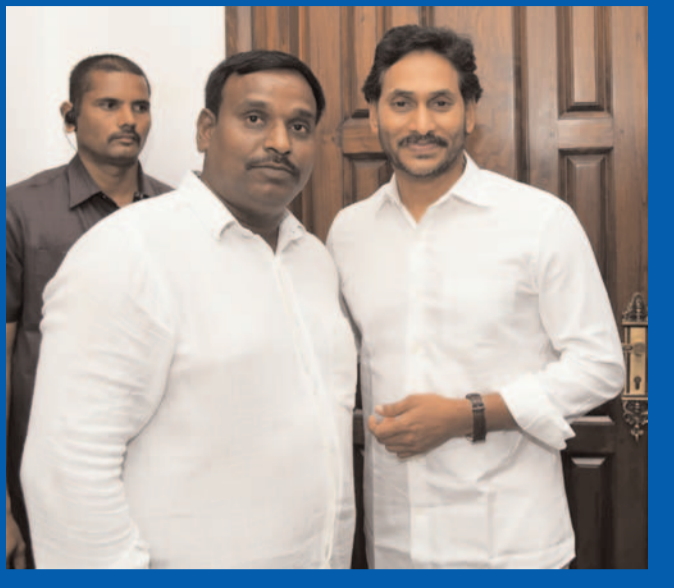
ప్రజా గొంతుక ప్రతినిధి/ బచ్చన్నపేట మండలం.

జనగామ జిల్లా బచ్చన్నపేట మండలం కేంద్రానికి చెందిన జగన్ వీరాభిమాని వైఎస్ఆర్ సిపి నేత, తాడిపత్తిలోని జగన్ను కలిశారు అనంతరం వారు మాట్లాడుతూ, గతంలో తెలంగాణ నుండి తాడేపల్లి వరకు, జగన్ రెండవసారి సీఎం కావాలని సైకిల్ యాత్ర మరియు పాదయాత్ర చేశానని, జగన్ మీద ఉన్న అభిమానంతో తెలంగాణలోని జగన్మోహన్ రెడ్డి పుట్టినరోజు, మరెన్నో సేవా కార్యక్రమాలు చేశానని, జగన్ కు వివరించగా మంచి మనసున్న జగన్ మోహన్ రెడ్డి, నేను ఉన్నానని నీకు అన్ని విధాలుగా అండగా ఉంటానని అన్నారు, పది సంవత్సరాలుగా కింద ఎలాగా పలకరించాడో ఇప్పుడు కూడా అదే పలకరింపు తోని పలకరించడం , చాలా అర్థజ్ఞంగా భావిస్తూ ముందుముందు జగన్ను చేపట్టబోయే కార్యక్రమాలు తెలంగాణ నుండి నా వంతు జగన్ను అభిమానిగా మరింత రెట్టింపు ఉత్సాహంతో మరెన్నో కార్యక్రమాలు చేస్తామని అన్నారు.