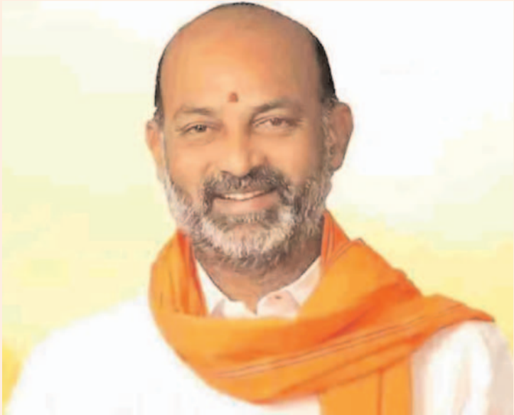
కేంద్రమంత్రి బండి సంజయ్ కీలక వ్యాఖ్యలు ప్రజా గొంతుక న్యూస్ డెస్క్:

బీఆర్ఎస్ నుంచి కాంగ్రెస్ లోకి చేరికల కొనసాగుతూనే ఉన్నాయి. అయితే ఈ చేరికలకు సంబంధించి కేంద్రమంత్రి బండి సంజయ్ కీలక వ్యాఖ్యలు చేశారు. స్వయంగా కేసీఆర్ .. సొంత ఎమ్మెల్యేలను కాంగ్రెస్ లోకి పంపుతున్నారని అన్నారు. తెలంగాణ ప్రజల ఏకైక గ్యారంటీ నరేంద్ర మోదీ అని తెలిపారు. అవినీతి నుంచి బయట పడేందుకు కాంగ్రెస్ కు కేసీఆర్ సహకరిస్తున్నారని ఆరోపించారు. సెక్యూరిటీ లేకుండా.. రాహుల్ గాంధీ ఉస్మానియా యూనివర్సిటీకి రావాలని సవాల్ విసిరారు. నిరుద్యోగులను పోలీసుల ద్వారా కాంగ్రెస్ ప్రభుత్వం అణిచివేస్తోందని కేంద్ర మంత్రి మండిపడ్డారు. రాహుల్ గాంధీని సొంత పార్టీ వాడే ప్రధాని అభ్యర్థిగా అంగీకరించలేదన్నారు. రానున్న స్థానిక సంస్థల ఎన్నికల్లో బీజేపీ కార్యకర్తలకు పెద్ద పీఠ వేస్తుందన్నారు. బీజేపీ కార్యకర్తల గెలుపే రాష్ట్ర బీజేపీ నాయకత్వం లక్ష్యమని స్పష్టం చేశారు. కాంగ్రెస్ ఆరు గ్యారంటీల హామీతో తెలంగాణ ప్రజలు మోసపోయారన్నారు. కాంగ్రెస్ ను ప్రజలు వ్యతిరేకించారనటానికి లోక్ సభ ఎన్నికల ఫలితాలు నిదర్శనమన్నారు. తెలంగాణ ప్రజాప్రతినిధులు కూడా నరేంద్ర మోదీ మాత్రమే గ్యారంటీ అంటున్నారన్నారు. ధర్మం, తెలంగాణ పేదల కోసం పోరాడేది బీజేపీ మాత్రమే అని చెప్పుకొచ్చారు. బీజేపీ కార్యకర్తల పోరాటం వలనే పార్లమెంట్ ఎన్నికల్లో బీజేపీకి గెలుపు వచ్చాయన్నారు. రైతులను మోసం చేసే విషయంలో బీఆర్ఎస్ బాటలోనే కాంగ్రెస్ నడుస్తోందన్నారు..