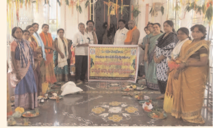
ప్రజా గొంతుక న్యూస్ ప్రతినిధి // చర్ల //