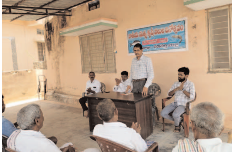
వనపర్తి: ప్రజా గొంతుకు