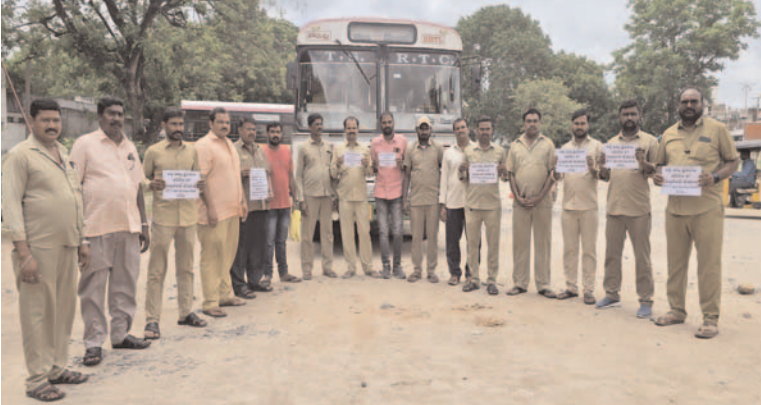
ప్రజా గొంతుక ప్రతినిధి,కోరుట్ల