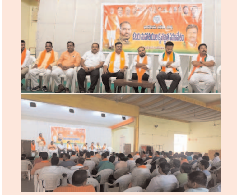
ప్రజా గొంతుక న్యూస్/పెద్దపల్లి