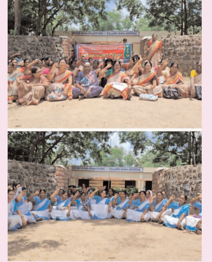
ప్రజాగొంతుకు న్యూస్ //భీమాదేవరపల్లి

ఆల్ ఇండియా డిమాండ్స్ డే సందర్భంగా హనుమకొండ జిల్లా భీమాదేవరపల్లి మండలం తహశీల్దార్ కార్యాలయం ఎదుట ఆశా కార్యకర్తలు, అంగన్వాడీ టీచర్లు, ఆయులు తమ డిమాండ్లను పరిష్కరించాలని కోరుతూ ధర్మా చేపట్టారు. గత ప్రభుత్వ హయాంలో నమ్మి చేసిన తమ డిమాండ్లను పరిష్కరించలేదని, కొత్తగా వచ్చిన కాంగ్రెస్ ప్రభుత్వం అధికారంలోకి వచ్చాక మూడు నెలల్లో పరిష్కరిస్తామన్న తమ సమస్యలను ఏడు నెలలైనా పరిష్కరించకుండా నిర్లక్ష్యం పహిస్తోందని వారు ఆందోళన వ్యక్తం చేశారు. కనీస వేతనం 26 వేల రూపాయలతో పాటు, ఆన్లైన్ వర్క్ తో పెరిగిన పనిభారాన్ని తగ్గించాలని ఆశ కార్యకర్తలు డిమాండ్ చేశారు. సర్వేల పేరుతో తీవ్ర ఇబ్బందులు పడుతున్నారన్నారు. పని భారం ఎక్కువై పనిపోయిన ఆశ కార్యకర్తలకు 50 లక్షల రూపాయల ఎక్స్ట్రాపెయింట్ ఇవ్వాలని డిమాండ్ చేశారు. మరోవైపు 65 సంవత్సరాలు నిండిన అంగన్వాడీ టీచర్లు, ఆయులను విధులకు రావద్దని అధికారులు ఒత్తిడి చేస్తున్నారని అంగన్వాడీ టీచర్లు వాపోయారు. 65 సంవత్సరాల నిండిన అంగన్వాడీ టీచర్లకు రెండు లక్షల రూపాయలు, ఆయులకు లక్ష రూపాయలు ఇవ్వాలని రాష్ట్ర ప్రభుత్వాన్ని డిమాండ్ చేశారు.