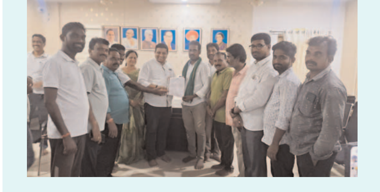
ప్రజా గొంతుక న్యూస్/మంధని/జూలై 10