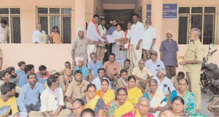
ప్రజా గొంతుకు న్యూస్ / యాదాద్రి