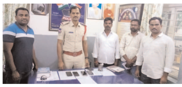
వనపర్తి :ప్రజా గొంతుక