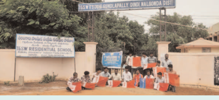
అధికారుల నిర్లక్ష్యం వల్లే స్కూళ్లలో ఇలా జరుగుతున్నాయి విభవన్ ఎఫ్, విభవన్ ఎఫ్ ప్రజా గొంతుక ప్రతినిధి/ డిండి: