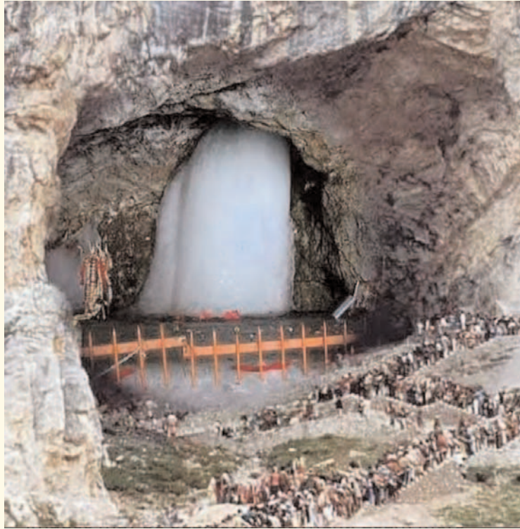
ప్రజా గొంతుక /జమ్మూ కాశ్మీర్ :-