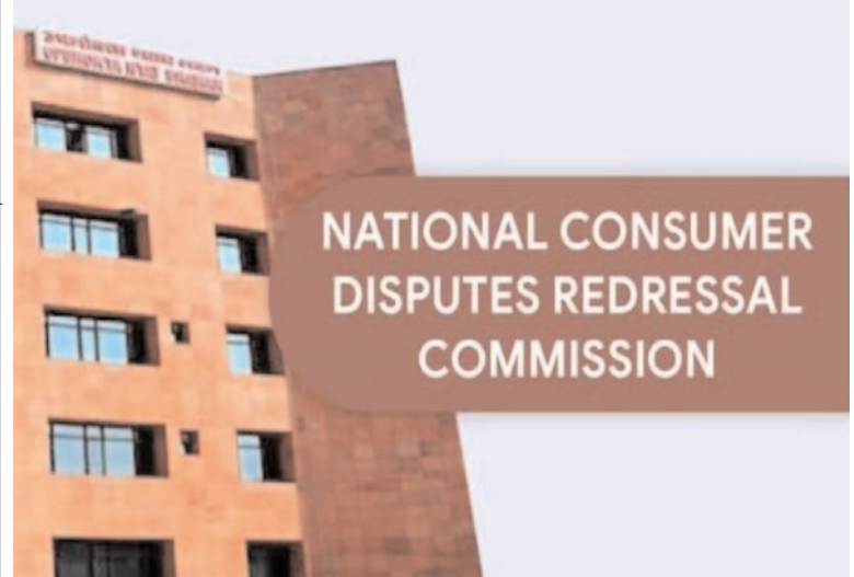
ప్రజా గొంతుక న్యూస్ డెస్క్:

ఎమ్మార్సీ కంటే ఎక్కువ ధరకు వస్తువులు విక్రయిస్తున్నారా? నాసిరకం ఉత్పత్తులు అంటగట్టి సేవలోపానికి పాల్పడ్డారా? అయితే ఇక నుంచి మీ ఇంటి నుంచే వినియోగదారుల కమిషన్ కు ఫిర్యాదు చేయొచ్చు. కేంద్ర వినియోగదారుల మంత్రిత్వ శాఖ ఇందు కోసం 'వాట్సాప్ చాట్ బాట్' సేవలను తీసుకొచ్చింది. వాట్సాప్ నంబర్ 88000 01915 లో మొదట హాట్ అని టైప్ చేయాలి. అక్కడి నుంచే అధికారికంగా వివరాలు సమోదా చేస్తే జాతీయ వినియోగదారుల కమిషన్ వెబ్ సైట్ లో ఫిర్యాదు సమోదావుతుంది. అనంతరం కేసు పరిష్కారం కోసం ఈ వివరాలు ఆయా జిల్లా వినియోగదారుల కమిషన్ కు పంపుతారు. కేసు పరిష్కారం అయ్యే వరకు అవసరమైన సలహాలు, సూచనలు ఇస్తారు. దీంతో పాటు 1800114000 లేదా 1915 నంబర్ కు కాల్ చేసి సైతం (ఉదయం 8గంటల నుంచి రాత్రి 8గంటల వరకు) ఫిర్యాదు చేయొచ్చు. ప్రతి రోజూ వేల ఫిర్యాదులు సమోదావుతుండగా, అందులో పరిష్కారమైన కేసులకు సంబంధించిన వివరాలను కేంద్ర వినియోగదారుల మంత్రిత్వ శాఖ వెబ్ సైట్ లో 'ఎన్ సీ హెచ్ సర్వేస్ స్టోరీస్' పేరుతో పొందుపరుస్తోంది.