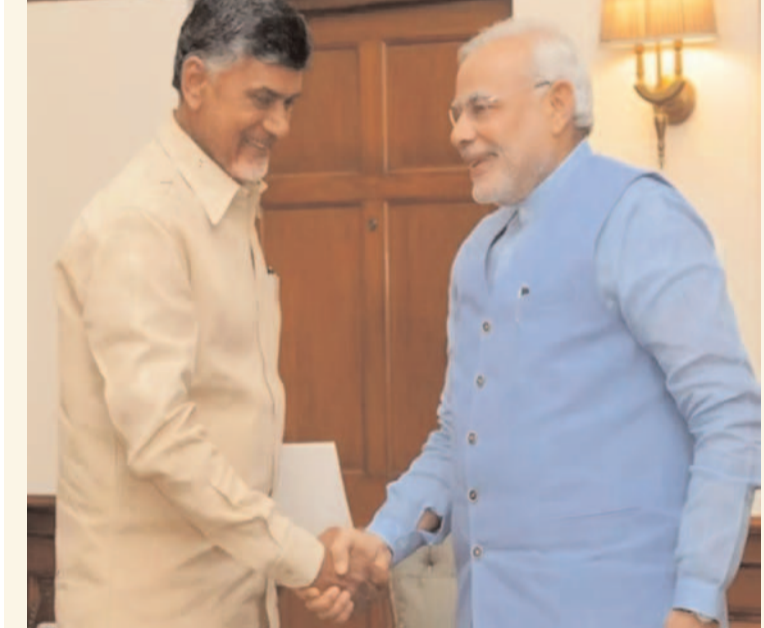
ప్రజా గొంతుక న్యూస్ డెస్క్: న్యూ ఢిల్లీ :