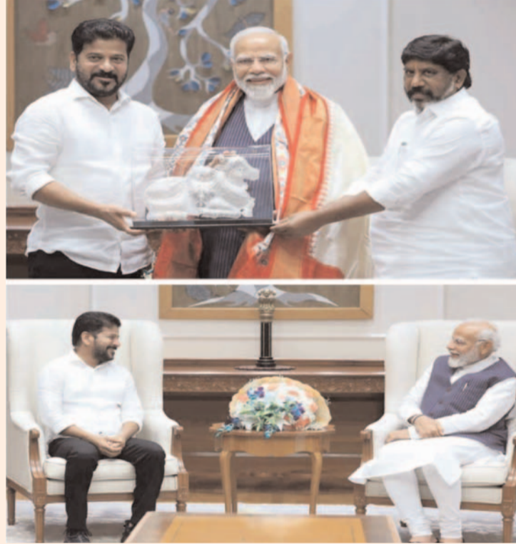
ప్రజా గొంతుక న్యూస్ డెస్క్: