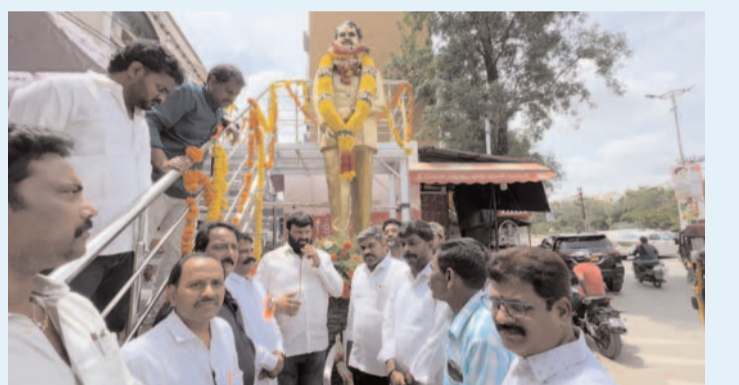
ప్రజా గొంతుక కుత్బుల్లాపూర్