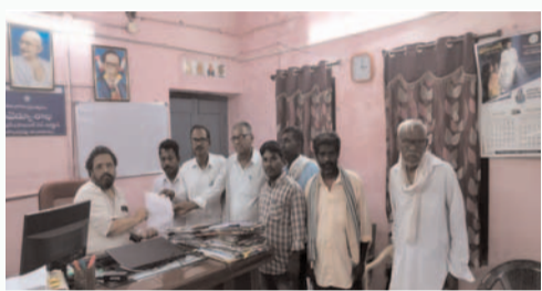
ప్రజా గొంతుక ప్రతినిధి/ ఖమ్మం వ్యవసాయ కార్మికులకు సమగ్ర చట్టం చేయాలని కనీస వేతనం 600 రూపాయలు పెంచాలని 50 సంవత్సరాలు దాటిన