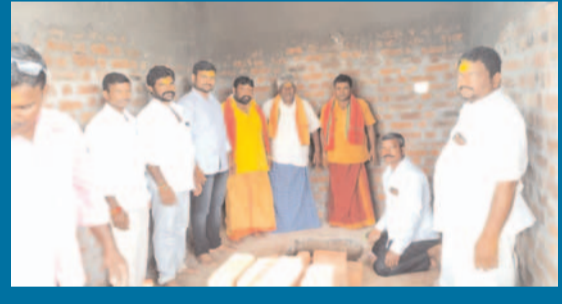
పూజలు చేస్తున్న ముదిరాజ్ సంఘం సభ్యులు