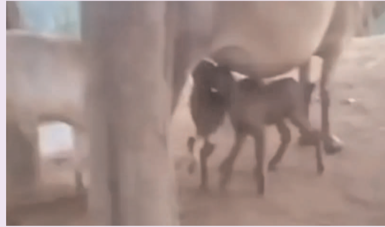
ప్రజా గొంతుక న్యూస్ డెస్క్: