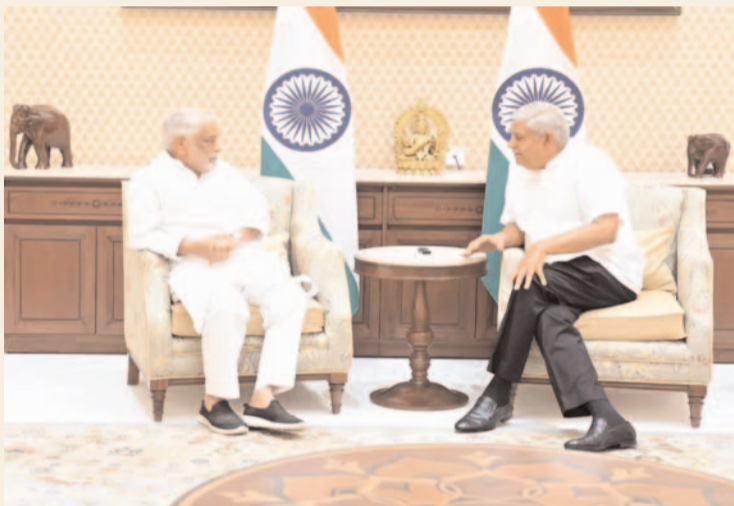
ప్రజా గొంతుక న్యూస్ డెస్క్:

సీనియర్ పాలిటీషియన్, రాజ్యసభ ఎంపీ కే.కేశవరావు (కేకే) తన రాజ్యసభ సభ్యత్వానికి రాజీనామా చేశారు. సీనియర్ పాలిటీషియన్, రాజ్యసభ ఎంపీ కే.కేశవరావు (కేకే) తన రాజ్యసభ సభ్యత్వరాజీనామా చేశారు. రాజ్యసభ చైర్మన్ ఉపరాష్ట్రపతి జగదీష్ దస్ తన రాజీనామా లేఖను సమర్పించారు. బుధవారం సాయంత్రం ఆయన కాంగ్రెస్ జాతీయ నేతల సమక్షంలో ఆధికారికంగా కాంగ్రెస్ కండువా కప్పుకున్నారు. బీఆర్ఎస్ నుంచి రాజ్యసభకు ఎంపీగా ఎంపికయ్యారు. పార్టీ మారితే ఆయనపై అనర్హత వేటు పడుతుంది. ఈ నేపథ్యంలోనే ఆయన తన రాజ్యసభ పదవికి రాజీనామా చేశారు.