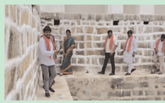
మెట్టాభి(కోనేరు) పరిశీలన మంత్రి సబితా ఇంద్రారెడ్డి

ప్రజాగొంతుకు//ప్రతినిధి//మహేశ్వరం//విక్రీలి(శ్రీకాంత్) మహేశ్వరం మండల కేంద్రంలో పావీనకట్టడం మెట్టాభి(కోనేరు) శిథిలావస్థకు చేరిన విషయం తెలుసుకున్న సబితా ఇంద్రారెడ్డి అంటి కట్టడాలు సభావితరాలకు అందించాలనే ఉద్దేశ్యంతో. ప్రత్యేక చొరవ తీసుకుని గత ప్రభుత్వం నుండి దాదాపు కోట్ల రూపాయలు మంజూరు చేయించి పునర్నిర్మిస్తున్న పనులను తుదిదశకు చేరడంతో. అక్కడక్కడ మిగిలిపోయిన ప్యావ్ వరులను క్షుణ్ణంగా పరిశీలించి ఎలాంటి చిన్న