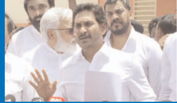
ప్రజా గొంతుక న్యూస్ డెస్క్:

చంద్రబాబు పాపాలు చండుతున్నాయి. రాష్ట్రాన్ని రావణకాష్టం చేస్తున్నారు. వైఎస్సార్ కి నేతలపై అక్రమ కేసులు పెడుతున్నారు. ప్రజలు అన్నీ గమనిస్తున్నారు. రెడ్ బుక్ పేరుతో టార్గెట్ చేసిన దాడులు చేస్తున్నారు.. ఇలాంటి వెంటనే ఆపాలని వైఎస్ జగన్ హెచ్చరించారు. వైఎస్ జగన్ నెల్లూరు జిల్లాలో జైలులో ఉన్న పిన్నెల్లి రామకృష్ణారెడ్డిని పరామర్శించారు. అనంతరం, వైఎస్ జగన్ మీడియాతో మాట్లాడుతూ.. పిన్నెల్లిపై అక్రమ కేసులు పెట్టారు. పిన్నెల్లిపై హత్యానేరం మోపారు. కారంపూడి సీఐని పిన్నెల్లి కనిసం చూసిన దాఖలాలు కూడా లేవు. మే 14న ఘటన జరిగితే.. మే 23న హత్యాయత్నం కేసు నమోదు చేశారు. నిజంగా దాడి జరిగితే ఆ మరనటి రోజు జమ చేసే ఎందుకు పెట్టలేదు?.. ఒక్క పిన్నెల్లిపైనే కాదు.. రాష్ట్రవ్యాప్తంగా ఇలానే దాడులు కొనసాగుతున్నాయి. ప్రజలకు మంచి చేసే రాజకీయాలు చేయాలి కానీ.. దౌర్జన్యం కాదు. టీడీపీకి ఓటు వేయలేదన్న కారణంతో అక్రమ కేసులు పెడుతున్నారు. టీడీపీకి ఓటు వేయలేదని ఆస్తులు ధ్వంసం చేస్తున్నారు. వైఎస్సార్ విగ్రహాలను కూడా ధ్వంసం చేశారు. ప్రజలు అన్నీ చూస్తున్నారు. దాడుల రాజకీయాలు మళ్లీ కాలం నిలబడవు. లెక్క జమ చేసే ప్రజలు బాబుకు గట్టిగా జవాబిస్తారు. ప్రతీ గ్రామం, మండల పరిధిలో రెడ్ బుక్ పేరుతో దాడులు చేస్తున్నారు. టీడీపీ వాళ్లే కొట్టి.. అక్రమ కేసులు బనాయిస్తున్నారు. దాడులు చేస్తే చూస్తూ ఉబుకునేది లేదు. దాడుల రాజకీయాలు మంచిది కాదు.. దగ్గరుండి దాడులను పోతపాంచడం , ఇలాంటివి వెంటనే ఆపాలని హెచ్చరిస్తున్నా అంటూ వార్తల్లో ఇచ్చారు.