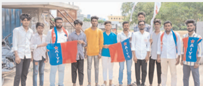
వలిగొండ జూలై 4 ప్రజా గొంతుక ప్రతినిధి