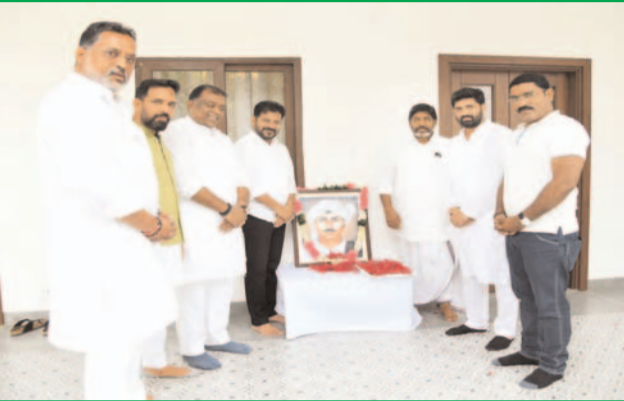
ప్రజా గొంతుక న్యూస్ డెస్క్:

తెలంగాణ రైతాంగ సాయుధ పోరాటంలో అమరులైన దొడ్డి కొమురయ్య వర్ణించిన పురస్కారముకుని ముఖ్యమంత్రి శ్రీ రేవంత్ రెడ్డి ఆ యోధుడి చిత్రపటానికి పుష్పాంజలి ఘటించారు. ఢిల్లీ వర్సటైల్ లో ఉన్న ముఖ్యమంత్రి, ఉప ముఖ్యమంత్రి శ్రీ భట్టి విక్రమార్కు, ఇతర ప్రతినిధులు శ్రీ కొమురయ్య కి నివాళులు అర్పించారు.