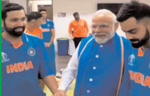
ప్రజా గొంతుక న్యూస్ డెస్క్:

టీ20 వరల్డ్ కప్ సాధించిన భారత జట్టు ఆటగాళ్లు ఈరోజు ప్రధాని మోదీని కలిశారు. గురువారం ఉదయం 6 గంటలకు ఢిల్లీ విమానాశ్రయంలో దిగిన క్రికెటర్లు ఐటీసీ మార్గ హౌసులో డ్రైక్ ఫాస్ట్ చేసి అక్కడ నుంచి ప్రధాని నివాసానికి చేరుకుని ఆయనను కలిశారు. ఈ సందర్భంగా వారిని ప్రధాని మోదీ ఆభినందించారు.