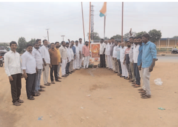
మనోహరాబాద్ 08జులై(ప్రజా గొంతుక)