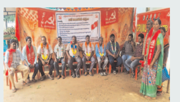
ప్రజా గొంతుక స్టూన్ ప్రతినిధి/ భద్రాద్రి కొత్తగూడెం జిల్లా