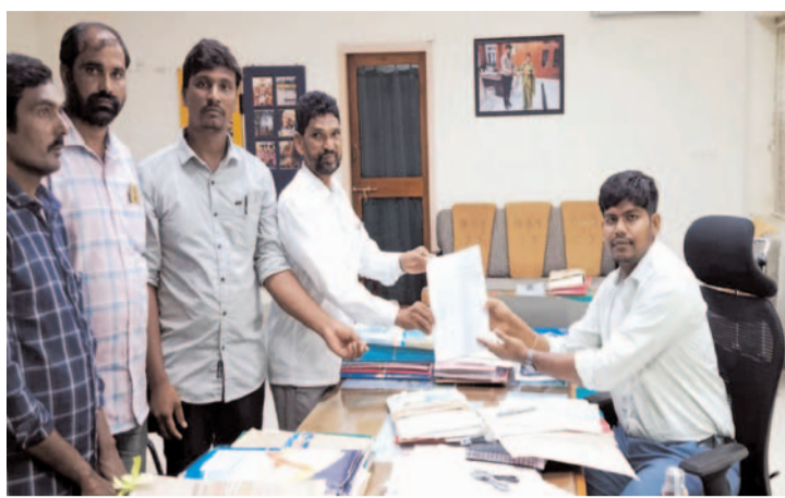
ప్రజా గొంతుక న్యూస్ ప్రతినిధి/ భద్రాద్రి కొత్తగూడెం జిల్లా