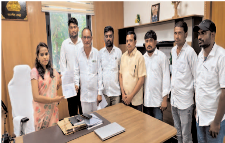
ప్రజా గొంతుక న్యూస్/మంధని/జూలై 8