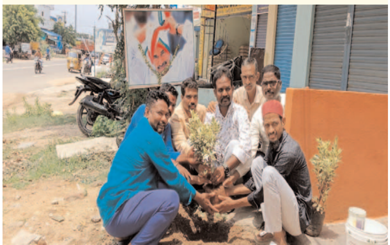
ఘనంగా వైఎస్ఆర్ జయంతి వేడుక వైఎస్ ఆర్ జయంతి సందర్భంగా మొక్కలు నాటిన వీరాభిమాని