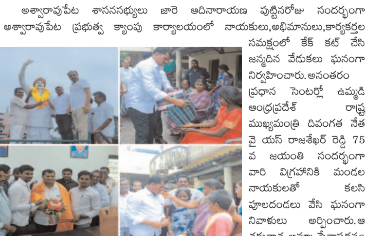
ప్రజా గొంతుక జులై 8 అశ్వరావుపేట నియోజకవర్గం ప్రతినిధి