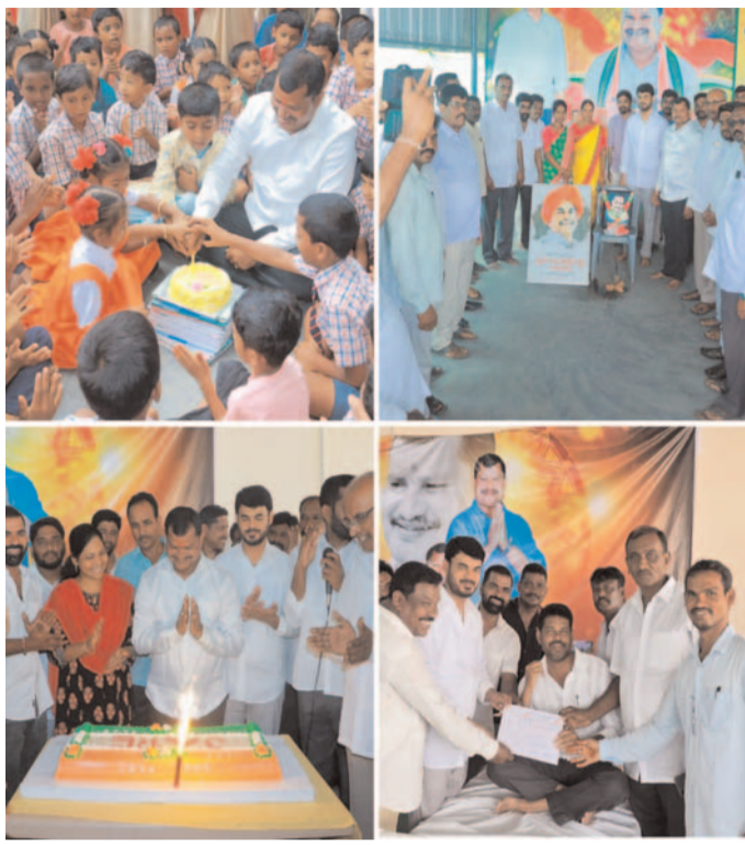
ప్రజా గొంతుక జులై 8 అశ్వరావుపేట నియోజకవర్గం ప్రతినిధి