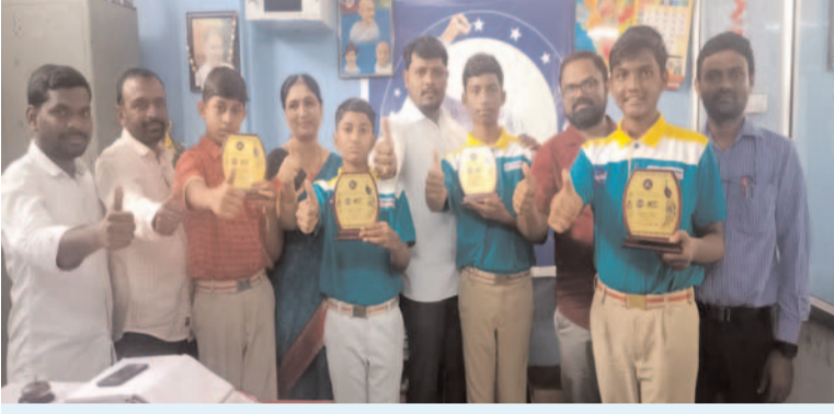
ప్రజా గొంతుక స్వస్తి/కరీంనగర్