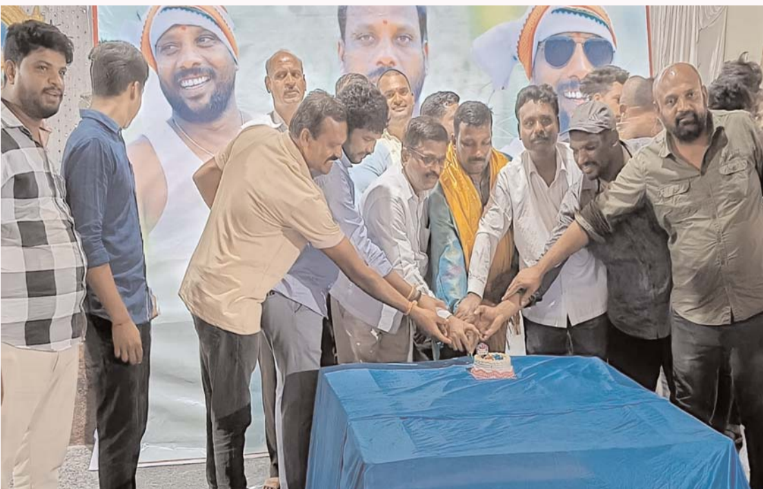
జన్మదిన వేడుకల్లో పాల్గొన్న కాంగ్రెస్ పార్టీ నాయకులు