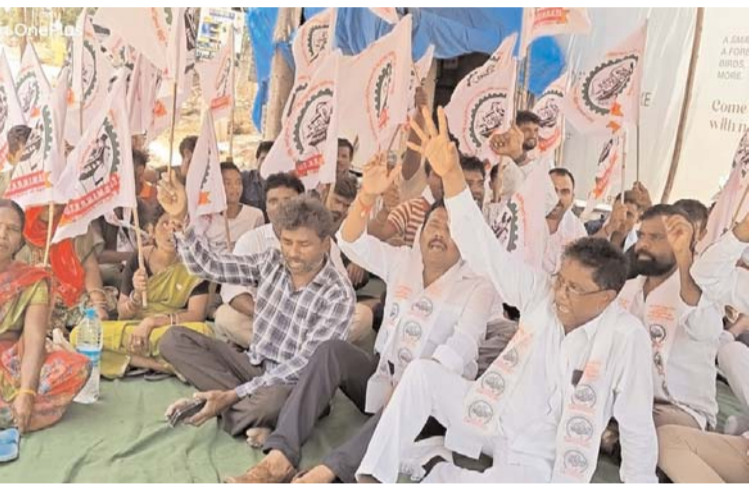
ప్రజా గొంతుక కుత్బుల్లాపూర్