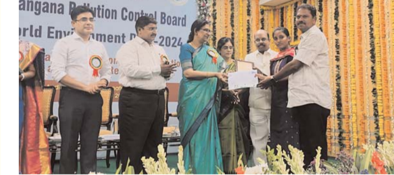
ప్రజా గొంతుక ప్రతినిధి/ దుమ్ముగూడెం: