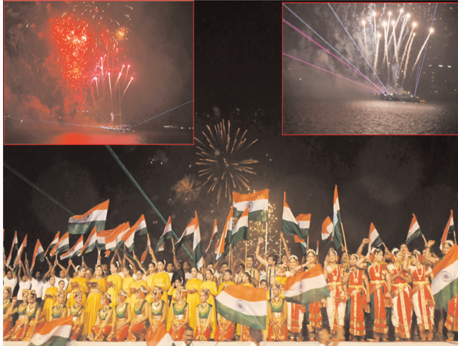
-అలరించిన కళాప్రదర్శనలు - భారీ వర్షంలోనే తిలకించిన గవర్నర్, సీఎం