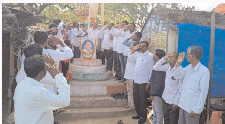
మండల కేంద్రంలో జిందా ఆవిష్కరణ