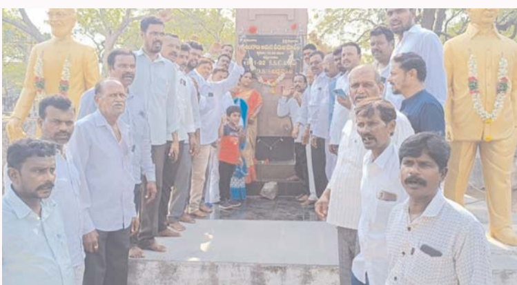
అమరవీరుల స్మారకం పద్ద ఘన నివాళులు