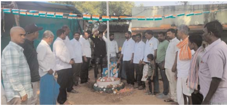
పడమటి కేశవురం గ్రామంలో జెందా ఆవిష్కరణ