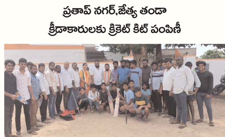
ప్రతాప్ నగర్, జెత్త తండా క్రీడాకారులకు క్రికెట్ కిట్ పంపిణీ