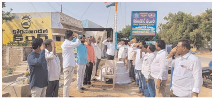
గోపాల్ నగర్ గ్రామంలో జెందావిష్కరణ