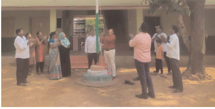
ప్రజా గొంతుక స్టూడెంట్స్ గుర్తించారు...

మండలంలోని పిట్టలగూడెం గ్రామంలో గల మైనార్టీ బాలర జూనియర్ కళాశాలలో తెలంగాణ ఆవిర్భావ దినోత్సవ వేడుకలను ఆదివారం ఘనంగా జరుపుకున్నారు.