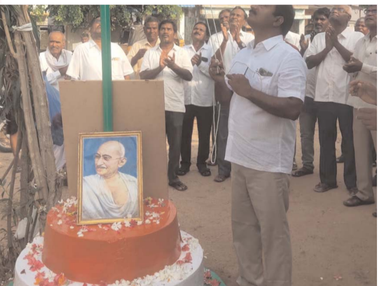
పోచన్నపేట గ్రామంలో జెందా ఆవిష్కరణలో