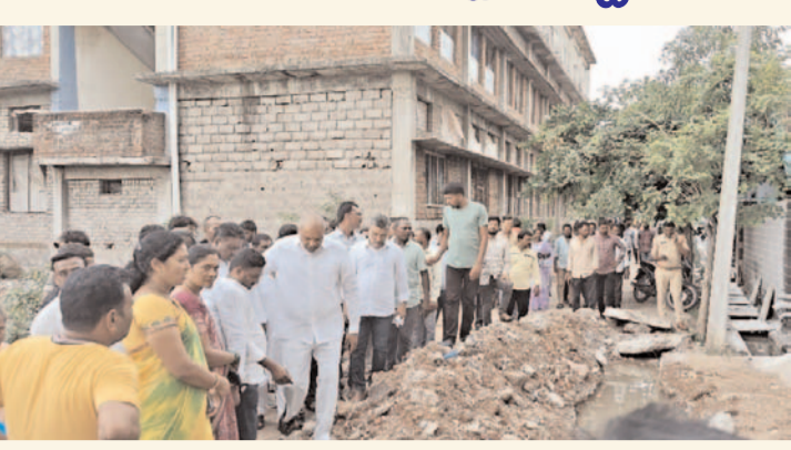
ఎమ్మెల్యే విజయరమణ రావు.. ప్రజా గొంతుకు పెద్దపల్లి :

పెద్దపల్లి పట్టణాభివృద్ధికి ప్రత్యేక కృషి చేస్తానని పెద్దపల్లి ఎమ్మెల్యే చింతకుంట విజయరమణ రావు తెలిపారు. పెద్దపల్లి పట్టణం 19,34 వార్డుల్లో శుక్రవారం ఎమ్మెల్యే విజయరమణ రావు మున్సిపల్, ప్రభుత్వ అధికారులు, స్థానిక నాయకులతో కలిసి పర్యటించారు ఈ సందర్భంగా ఎమ్మెల్యే విజయరమణ రావు మాట్లాడుతూ,, పెద్దపల్లి పట్టణంలో త్రాగునీటి సరఫరా, డ్రైనేజీ, విద్యుత్ సమస్యలు లేకుండా చర్యలు తీసుకుంటామని అన్నారు. ఎమ్మెల్యే ప్రజల నుండి సమస్యలు అడిగి తెలుసుకుని పరిష్కరించాలని స్థానిక మున్సిపల్ కమిషనర్ వెంకటేశ్ ను ఎమ్మెల్యే ఆదేశించారు. రానున్న వారం, పదిహేను రోజుల్లో పెద్దపల్లి పట్టణంలోని అన్ని వార్డుల్లో క్షేత్రస్థాయిలో పర్యటించి సమస్యలను తెలుసుకొని పరిష్కరిస్తానని హామీ ఇచ్చారు. దాదాపు రూ. 30 కోట్ల పైబిలుకు నిధులు రోడ్డు, డ్రైనేజీల నిర్మాణం కోసం జూన్ నుండి జూలై మొదటి వారంలో టెండర్లను పిలిచి ఆగస్టు మొదటి వారంలోనే పనులు మొదలు చేసేలా కృషి చేస్తామని అన్నారు. అమ్మత్తు పథకంలో రూ. 22 కోట్లతో చేపట్టే పనులకు టెండర్లు పిలవడం జరిగిందన్నారు. పట్టణంలో ఎక్కడ కూడా సమస్యలు లేకుండా చేసి, త్రాగు నీటి సమస్యలు రాకుండా పూర్తి స్థాయిలో చర్యలు తీసుకుంటామన్నారు పెద్దపల్లి పట్టణంలో సమస్యలు ఉంటే నేరుగా తన దృష్టికి తీసుకురావాలని, స్థానిక కౌన్సిల్లర్ల దృష్టికి తీసుకువచ్చినా తక్షణమే స్పందించి సమస్యలను పరిష్కరించడం జరుగుతుందని హామీ ఇచ్చారు ఈ కార్యక్రమంలో పెద్దపల్లి మున్సిపల్ కమిషనర్ ఆకుల వెంకటేశ్, అధికారులు, కౌన్సిలర్లు, కాంగ్రెస్ పార్టీ నాయకులు, కార్యకర్తలు, వార్డుల ప్రజలు పాల్గొన్నారు.