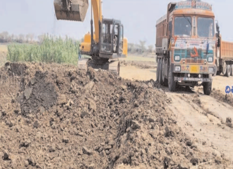
పరిశుభ్రమ విరుద్ధంగా చెరువు మట్టి తవ్వకాలు ప్రజా గొంతుక న్యూస్/మంథని/జూన్ 28

మంథని నియోజకవర్గంలో ఇటుక బట్టిల పరిశ్రమలకు మట్టి వినియోగించుకునేందుకు కొన్ని చెరువుల్లో మట్టిని తరలించుకు పోయేందుకు అనుమతులు ఇచ్చారు అయితే ఒక్కోచోట ఒక్కో రీతిలో పరిశుభ్రం చేసిన ప్రాసీడింగ్స్ విధానాలకు దారితీస్తున్నాయి మొక్కుబడి తంతుగా సగిస్తున్న అధికార యంత్రాంగం పూడికతీత పనులు పేరిట నిబంధనలకు పాతరా వేస్తున్నారన్న విమర్శలు వస్తున్నాయి బహిరంగంగా ప్రభుత్వ ఆధీనంలో ఉండే చెరువులు కుంటల్లో పూడికతీతకు అనుమతిస్తూ జారీ చేసిన ప్రాసీడింగ్స్ కాపీలు మాత్రం బయటకు ఇవ్వడానికి ఇరిగేషన్ అధికారులు నిరాకరిస్తున్నారని పబ్లిక్ ప్రాసీడింగ్స్ విషయంలో వారు ప్రైవేటు వ్యవహారాలు చక్కబెడుతున్నారని విమర్శలు వస్తున్నాయి అధికారులు ప్రాసీడింగ్స్ కాపీలు మంత్రి అడిగిన ఇవ్వమని అవసరమైతే చూపిస్తామని ఇరిగేషన్ అధికారి చెప్పన్న సమాధానం విడూరంగా ఉంది మంత్రికి కూడా ప్రాసీడింగ్స్ ఇవ్వమని సదరు అధికారి చెప్పన్న సమాధానం ఎలాంటి ప్రాసీడింగ్స్ లేకుండా బిల్లులు లేకుండానే కోట్లు విలువ చేసే మట్టిని అక్రమంగా దోచుకుంటున్నారు