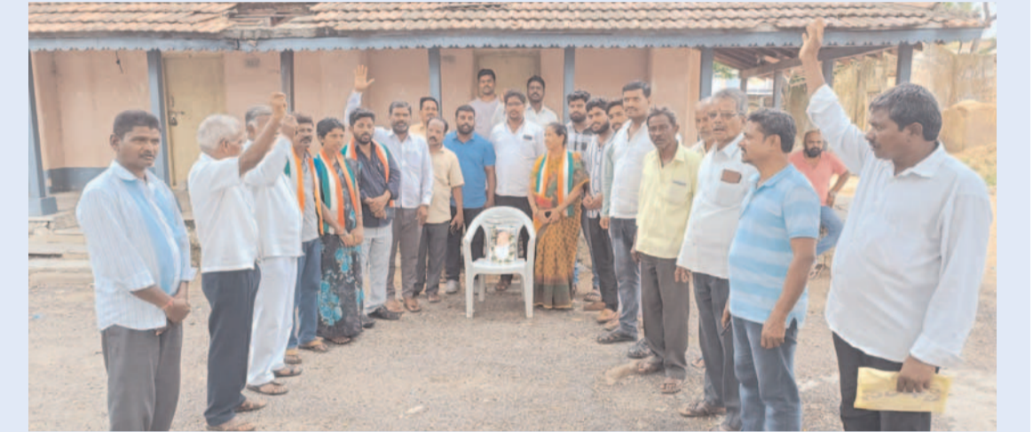
ప్రజా గొంతుక స్టూన్/ బచ్చన్నపేట మండలం