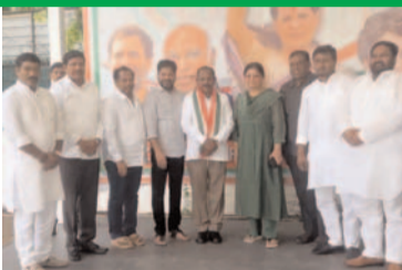
ప్రజా గొంతుక న్యూస్ డెస్క్ / ఢిల్లీ

ఢిల్లీలో ముఖ్యమంత్రి రేవంత్ రెడ్డి, ఏబిసీసీ ఇంచార్జ్ దీపాదాస్ మున్నీ సమక్షంలో కాంగ్రెస్ లో చేరిన ఎమ్మెల్యే కాలె యాదయ్య కంఠపాత్ర పాఠ్యంలోకి ఆహ్వానించిన ముఖ్యమంత్రి రేవంత్ రెడ్డి.