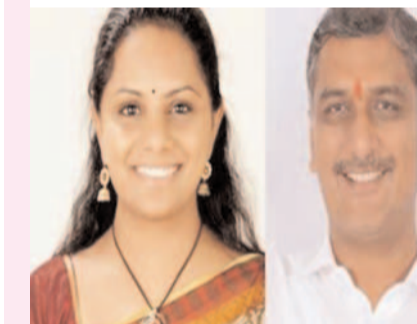
ప్రజా గొంతుక/ ఢిల్లీ / హైదరాబాద్

జూన్ 28 న్యూఢిల్లీ బీఆర్ఎస్ సీనియర్ నేత, మాజీ మంత్రి, ఎమ్మెల్యే హారిష్ రావు 4 ఢిల్లీ పర్యటనలో ఉన్నారు. ఢిల్లీ లిక్కర్ కేసులో అరెస్టు అయి తిహార్ జైల్లో ఉన్న బీఆర్ఎస్ ఎమ్మెల్యే కవితతో శుక్రవారం ఉదయం ఆయన భేటీ అయ్యారు. ములాఖాత్ సందర్భంగా ఎమ్మెల్యే కవిత యోగక్షేమాలు అడిగి తెలుసుకున్నారు. ధైర్యంగా ఉండమని ఆయన కవితను సూచించారు.