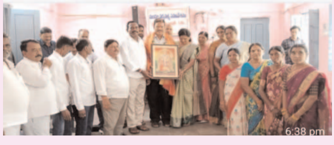
ప్రజా గొంతుకు ఓదెల :