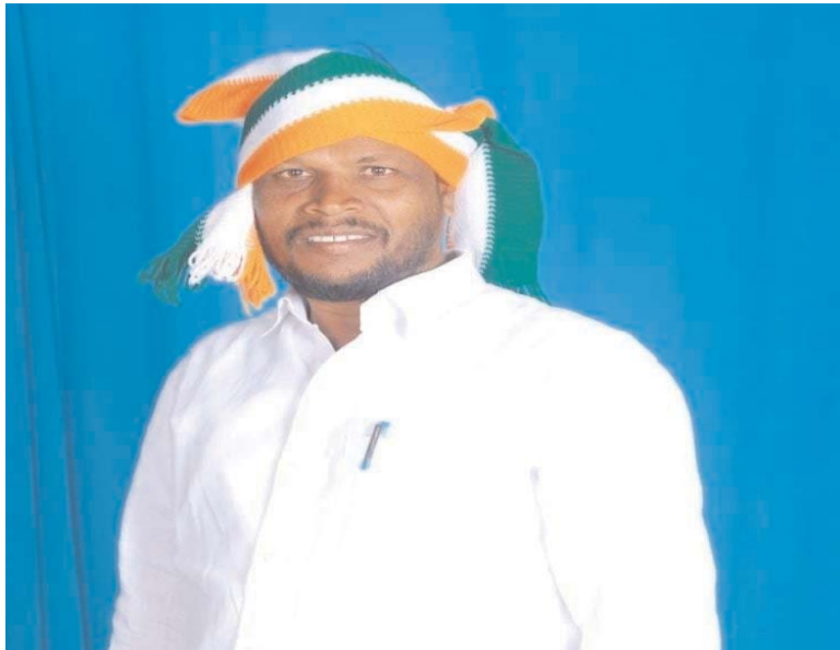
కల్పించడానికి ప్రభుత్వం ప్రణాళికలు సిద్ధం చేస్తుందని తెలిపారు. రైతులకు అండగా నిలబడుతూ ఒకే దఫాలో రెండు లక్షల రుణమాఫీ చేసే ముఖ్యమంత్రి రేవంత్ రెడ్డి, అచ్చంపేట ఎమ్మెల్యే డాక్టర్ చిక్కుడు వంశీకృష్ణ తో పాటు రాష్ట్ర క్యాబినెట్ కు ప్రత్యేక ధన్యవాదాలు తెలిపారు.

వ్యవసాయానికి పునర్నిర్మాణం తీసుకువచ్చి రైతుల కళ్ళలో ఆనందం చూడాలన్నదే ముఖ్యమంత్రి రేవంత్ రెడ్డి తపన అన్నారు. అందులో భాగంగా 2 లక్షల రూపాయల రుణమాఫీని ఒకే దఫాలో చేయడంతో రైతులంతా ఆనందంతో సంబరాలు చేసుకుంటున్నారని పేర్కొన్నారు. రైతు సంక్షేమం కోసం కృషి చేస్తున్న కాంగ్రెస్ ప్రభుత్వం రుణమాఫీ తో పాటు రైతులు పండించిన పంటలకు మద్దతు ధర కల్పించడంతో మెరుగైన మార్కెటింగ్ వ్యవస్థను