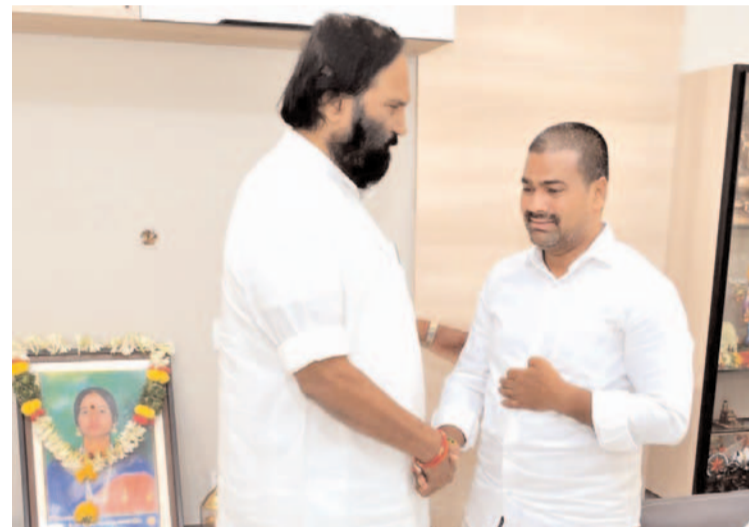
ప్రజా గొంతుక స్పాన్సర్ హుజూర్ నగర్

చొప్పండ్ల ఎమ్మెల్యే మేడిపల్లి సత్యం సతీపతి జూన్ 21 ఆకాల మరణం చెందడంతో సోమవారం నీటిపారుదల మరియు పౌరసరఫరాల శాఖ మంత్రి ఉత్తమ్ కుమార్ రెడ్డి ఎమ్మెల్యే