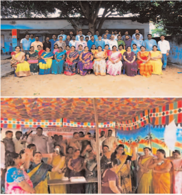
ప్రజా గొంతుక స్పాన్సర్ ప్రతినిధి/ భద్రాద్రి కొత్తగూడెం జిల్లా

కరిగిపోయింది కమ్మని బాల్యంతిరిగి రాదుగా ఆ కల్యం లేని స్నేహం భద్రాద్రి కొత్తగూడెం జిల్లా చర్ల మండల పరిధిలోగల సత్యనారాయణపురం గ్రామంలో ఉన్న శ్రీ సీతారామ ఉన్నత పాఠశాలలో 1995-96 సంవత్సరంలో చదివిన మిత్రుల, అపూర్వ జ్ఞాపకాల పందిరి చేసుకొని ఆదివారం నిర్వహించారు. ఇప్పటికి 28 వసంతములు గడిచింది. ఈ కార్యక్రమంలో ఇక్కడ చదివి ఇతర దేశాలలో, వివిధ రాష్ట్రాలలో స్థిరపడిన 47 మంది విద్యార్థులను విద్యార్థులు పాల్గొన్నారు. ఇదే రోజు కర్ణాటక చెందిన మిత్రురాలి పుట్టినరోజు కావడం విశేషం. మిత్రురాలి కి గ్రూపు సభ్యులంతా కేక్ కట్ చేయించారు. అనంతరం కరిగి పోయింది కమ్మని బాల్యం, తిరిగి రాదుగా ఆ కల్యం లేని స్నేహం, కొన్ని జ్ఞాపకాలు మనస్సు లోతుల్లో, ఎప్పటికీ సజీవమే మిత్రమా, అనే జ్ఞాపకాలను ఉద్దేశించి, పాత జ్ఞాపకాలు మననం చేసుకొని ప్రతి ఒక్కరు మాట్లాడి, ఆటపాటలతో సందడి చేశారు.