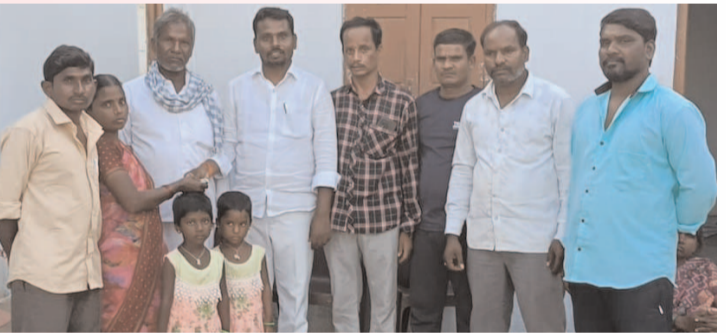
ప్రజా గొంతుక స్పాన్సర్ గండిడ్ జూన్ 24