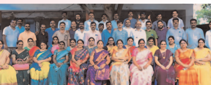
ప్రజా గొంతుక స్పాన్సర్ ప్రతినిధి // చర్ల //

భద్రాద్రి కొత్తగూడెం జిల్లా చర్ల మండలం సత్యనారాయణపురం శ్రీ సీతారామ ఉన్నత పాఠశాలలో 1995- 96 సంవత్సరంలో విద్యను అభ్యసించిన 47 మంది విద్యార్థులను, విద్యార్థులు అందరూ కలిసి ఆత్మీయ సమ్మేళనం ఏర్పాటు చేసుకున్నారు. వీరంతా 28 సంవత్సరాల తర్వాత అందరూ కలిసి ఒకరినొకరు ఆప్యాయంగా పలకరించుకొని ఎవరెవరు ఏ వృత్తిలో కొనసాగుతున్నారో ఒకరినొకరు తెలుసుకొని పాత జ్ఞాపకాలను గుర్తు చేసుకున్నారు ఈ పూర్వ విద్యార్థుల ఆత్మీయ సమ్మేళనంలో అందరూ కలిసిన రోజే ఇదే పాఠశాలలో విద్యనభ్యసించి కర్ణాటకలో స్థిరపడిన విద్యార్థిని పుట్టినరోజు కావడం విశేషం ఈ సందర్భంగా ఆమెకు మిత్రులందరూ కలిసి పుట్టినరోజు వేడుకను ఘనంగా నిర్వహించారు. అనంతరం కరిగిపోయింది కమ్మని బాల్యం తిరిగి రాదుగా ఆ కల్యం లేని జీవితమే మన స్నేహం అని అందరూ పాత జ్ఞాపకాలను గుర్తు చేసుకొని ఆటపాటలతో ఆడి వేడుకను విజయవంతం చేశారు.