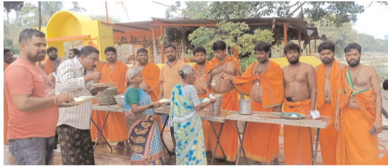
ప్రజా గొంతుక ప్రతినిధి/ బచ్చన్నపేట మండలం