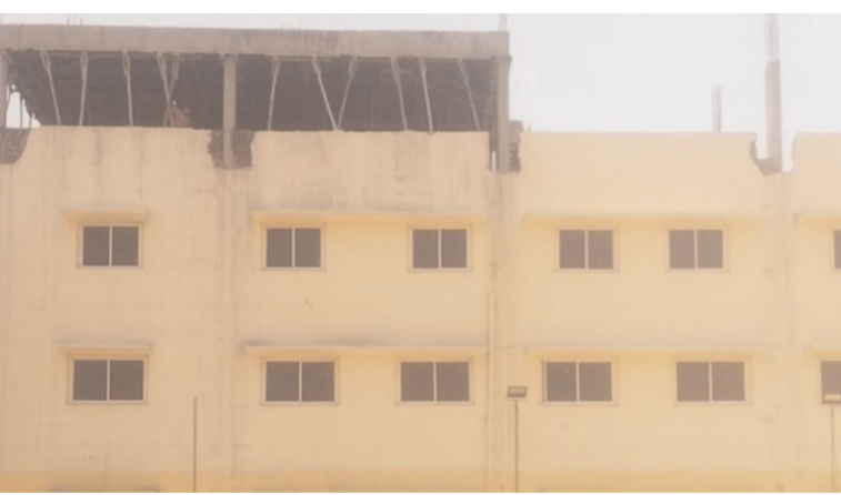
ప్రజా గొంతుక స్టూన్ జూన్ 01, దమ్మెగూడ

మేడ్చల్ జిల్లా దమ్మెగూడ మున్సిపాలిటీ సాయి ఫ్రెయి కాలనీలో అనుమతి లేకుండా పై అంతస్తు నిర్మిస్తున్న స్థానిక మున్సిపల్ అధికారులు, టౌన్ ప్లానింగ్ అధికారి ఎటువంటి చర్యలు తీసుకోకపోవడంతో స్థానిక ప్రజలు ఆగ్రహం వ్యక్తం చేస్తున్నారు. ఇప్పటికైనా స్థానిక మున్సిపల్ అధికారులు ఇటువంటి అక్రమ నిర్మాణం చేపడుతున్న వారిపై చట్టరీత్యా చర్యలు తీసుకోవాలని కోరుతున్నారు.