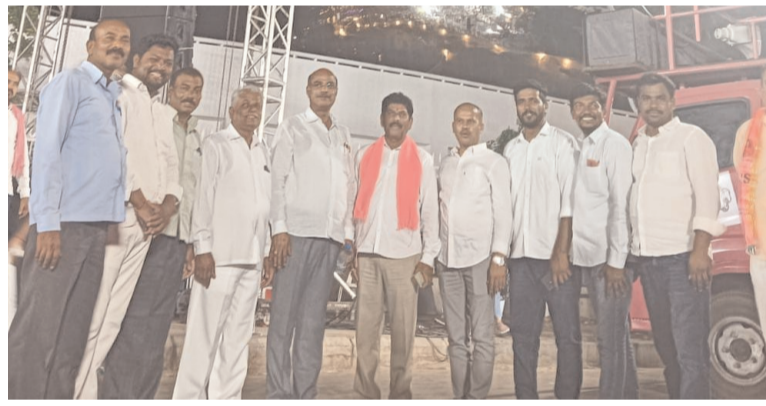
ప్రజా గొంతుక ప్రతినిధి/ బచ్చన్నపేట మండలం

బీఆర్ఎస్ పార్టీ ఆధ్వర్యంలో తెలంగాణ రాష్ట్ర ఆవిర్భావ దశాబ్ది ఉత్సవాలు ప్రారంభమయ్యాయి. హైదరాబాద్ గన్ పార్క్ వద్దకు చేరుకున్న బీఆర్ఎస్ అధినేత కేసీఆర్ క్యాంపిలో ర్యాలీని ప్రారంభించారు. గన్ పార్క్ లోని తెలంగాణ అమరవీరుల స్తూపం సుంచి డాక్టర్ బీఆర్ అంబేద్కర్ తెలంగాణ సవలయం ఎదురుగా ఉన్న అమరజ్యోతి వరకు క్యాంపిలో ర్యాలీ కొనసాగుతుంది. ఈ కార్యక్రమానికి బచ్చన్నపేట బిఆర్ఎస్ పార్టీ నాయకులు