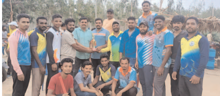
5 రోజుల క్రికెట్ టోర్నమెంట్ విజేతగా మంగువాయిబడవ జట్టు..