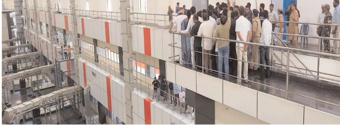
మణుగూరు జూన్ 13