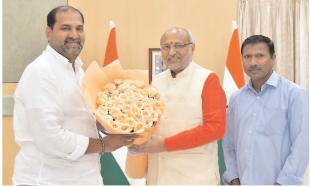
ఆక్రయించగా తమకు అనుకూలంగా తీర్పు ఇచ్చి, ఇరిగేషన్, వరకు ఉద్యమం ఆపబోమని స్పష్టం చేశారు. ఫిర్యాదుపై మైనింగ్ శాఖలకు రూ.50కోట్ల జరిమానా విధించారని స్పందించిన గవర్నరు బాధ్యులపై చట్టపరమైన చర్యలు వివరించారు. దీనికి బాధ్యులైన వారిపై చర్యలు తీసుకునే తీసుకునేలా చూస్తామని హామీ ఇచ్చినట్లు తెలిపారు.