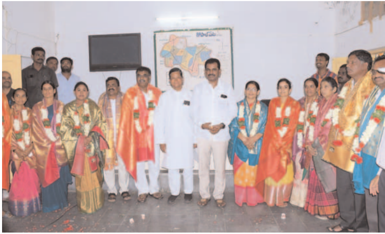
ప్రజాప్రతినిధులు తదితరులు పాల్గొన్నారు